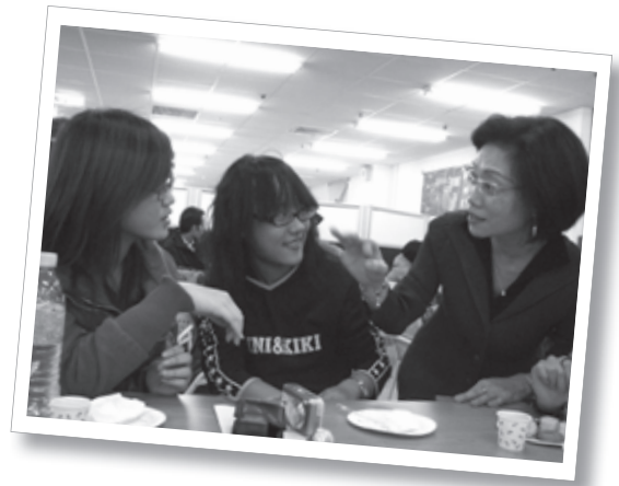
圖三：體驗不一樣的教學

本系97學年度共有專任教授3名、專任副教授16名、專任助理教授1名，另有兼任教師8名，合計28名。其中擁有博士學位者共計19名，乃全國法語系師資陣容最為堅強之系所。本系教師皆學有專精，專攻學科涵蓋法國語言學、法國文學、哲學思潮、法語教學法、法國史、法國政治與文化行政等領域。