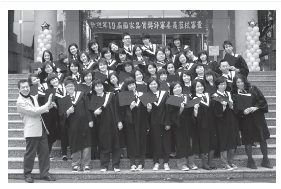
圖二：一路照顧到你（妳）學成畢業

為擴展碩士生研究領域，增進其國際視野，本系於93學年度開始推行研究生出國研習，並與里昂第三大學簽訂雙學位合作。在此合作架構下，本所研究生在碩三時可赴里昂第三大學進修一年。進修其間，同時要完成三項任務：里昂三大碩士學分修習、在該校大學部教授華語或台語課程、論文寫作。合作四年來，計有11位研究生先後獲得本校與里昂第三大學雙碩士學位，成果斐然。96學年度起，碩士一年級學生亦可選擇赴巴黎第四大學或比利時達文西高等學院（Institut Libre Marie-Haps）的翻譯學院擔任交換生。