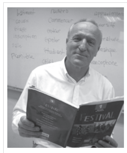
圖一：貼身的教導，客製化的服務

2002年，本系為配合學校三化教育，提升學術實踐能力，培育精進國際語文人才，成立碩士班。其宗旨為「結合語言能力與人文素養，掌握世界潮流、貼近社會脈動、訓練獨立思考、策劃、實踐、分析、論述之能力，培養兼具實務經驗與理論方法之法蘭西語言文化之複合型人才」。發展特色有四大學術領域：當代思潮、文學專題、文化與社會、語言與翻譯。