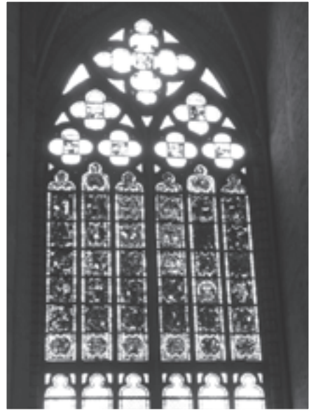
圖5 美麗的鑲嵌玻璃。