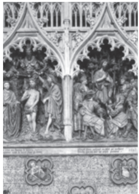
圖6 教堂內部以聖經故事為主題的浮雕。