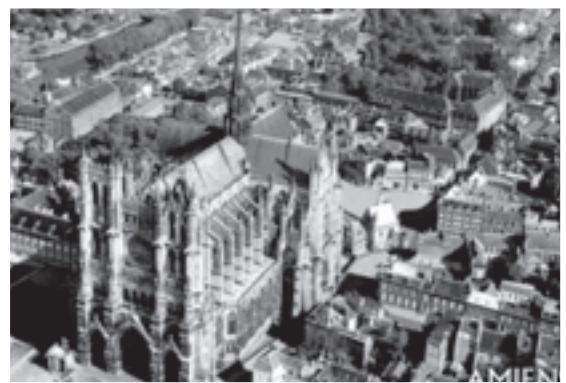
圖4 宏偉的亞眠大教堂。