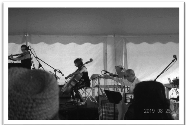
圖四：筆者與各國音樂家合作「客家山歌遇見 OMI」。