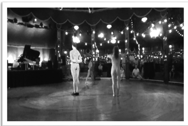
圖三：舞蹈團在舞台中央表演。

8月24日週末在 Benenson Visitors enter 外的草坪對外開放的音樂會是重頭大戲，Arts OMI 重視即興與文化的交融，原則上是要在音樂營新的創作首演，不鼓勵既有作品重演，最後一週星期二(20日)大家討論出原則，星期三上午敲定曲目，四天的功夫從創作排練到演出，一氣呵成，有幾首大型曲目及壓軸大合唱曲(Shannon Barnett 的作品 Leaves of Green)提前一個星期就開始排練，一場充滿嘉年華貼近民眾的音樂會在黃昏落日斜照下愉悅完成。