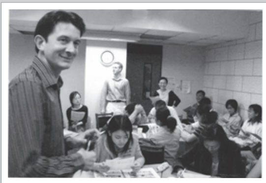
法語中心舉辦法語漫畫節比賽

台師大法語中心成立於1984年，二十多年來在嚴格的教學下，共培育了超過九萬名各級法語人才，對促進台法文化、教育與各項交流有其顯著的貢獻。作為候選者之一，台師大法語中心此次能否脫穎而出，各界正在拭目以待！