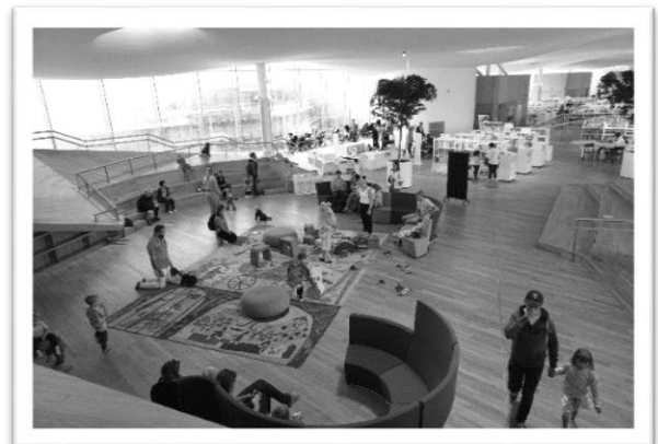
圖四：三樓小孩開放式閱讀空間

書館雖然不是芬蘭書冊量最多的圖書館，但在這裡你可以找到多種語言的書籍，另外為了增加服務效率，頌歌中央圖書館也「雇用」一群機器人圖書館員，負責從地下室搬出歸回圖書，並分置於書櫃中。書櫃上還提供了桌遊可以讓大人小孩一起玩，另外在三樓也劃分了大人與小孩兩大讀書區(圖四)。在小孩的開放式閱讀空間旁，圖書館還很貼心的規畫了一大塊區域讓父母能夠擺放嬰兒推車，可見其對於大人帶小孩來圖書館的重視；三樓也設置了咖啡廳，坐在戶外的座位區一邊喝著咖啡，一邊欣賞著眼前一片人們和樂融融的畫面，多麼愜意(圖五)。