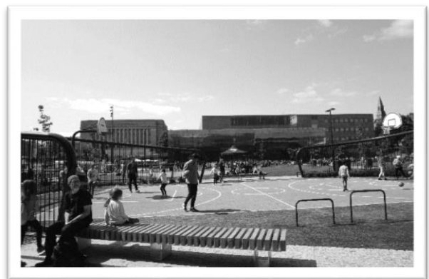
圖二：圖書館外小型球場

走進頌歌圖書館，圖書服務就在門口的正前方，在這裡人們即可輕鬆的借還書，無須特地跑上三樓；想要來點輕鬆的，你可以到一旁的 Kino Regina 欣賞一部電影；又或者是有活動要舉辦時，Maijansali Hall 則是個很棒的空間。感到飢腸轆轆的時候，在一樓的咖啡廳就可以享用到 Fazer Food & Co Oodi 提供的美食。突然覺得需要消耗一下體內的熱量卻苦無機會嗎？別擔心，在一樓的諮詢櫃台更是提供了租借籃球的服務，你絕對不會想到，外面的小型球場也是隸屬於圖書館的一環，所以當你對於靜態活動感到厭煩時，不妨和櫃檯借一顆籃球，到外頭伸展筋骨一番吧(圖二)！