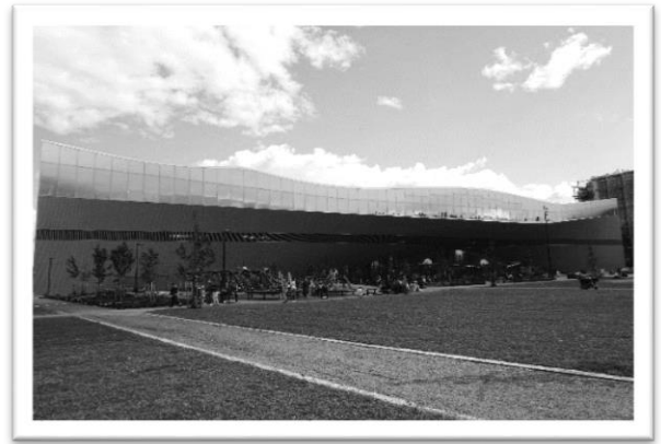
圖一：頌歌中央圖書館外觀

對於圖書館的所有想像，前所未見的設備全都能夠在這座圖書館找到。究竟這座圖書館有甚麼樣的特色及魅力呢？接下來就讓我們來好好認識這座圖書館，一睹其風采吧！