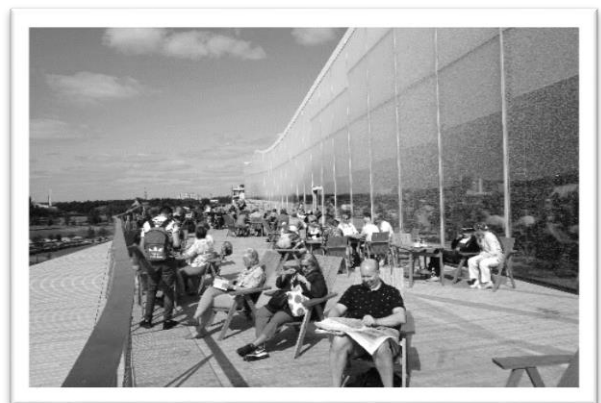
圖五：三樓咖啡廳戶外區