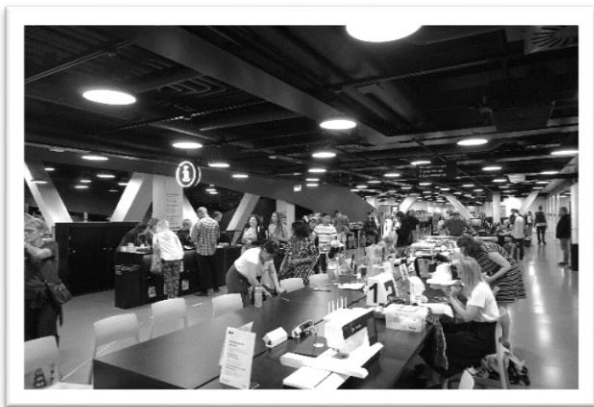
圖三：二樓開放式縫紉空間

產品設施。二樓的每個角落都充滿了未來感，提供了許多設備與機會讓人創造出一些新事物同時也能讓你修改舊有的衣物。在這裡，你可以學習到最新的 3D 列印技術或縫製一件專屬於自己的衣服(圖三)。安靜的個人閱覽室能夠讓人百分之百的投入於工作中，舒適的遊戲間則能讓你在繁忙的生活中找到一席抒壓之地。你以為在圖書館只能時刻保持安靜嗎？二樓還規劃了音樂室，你可以盡情揮灑自己的創作能力，從一開始的創造到最後的排練全部都能在這進行呢！你是否覺得在圖書館就千萬不能攜帶任何食物呢？圖書館是否與食物沒有任何關聯？絕對不是這樣的，在這裡竟有著一間小廚房，只要事先預約時段，人們便可以在這邊製作簡單的料理，若是需要舉辦小型烹飪課程也是沒有問題的。想不到在這一層樓能夠擁有如此豐富的體驗，不論何種類型幾乎應有盡有，且動靜皆宜，實在讓人感到十分驚豔。