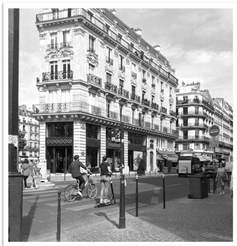
圖為巴黎街景，隨處可見用路人使用共享交通工具

的不同視角，對城市如巴黎而言，更是新生的面貌，下次造訪巴黎時，記得選台滑板車，參與最美好的流動饗宴。