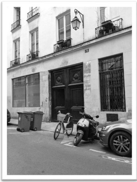
左邊為 Jump 共享單車，右為 Gogoro 共享電動車 圖為筆者個人攝影