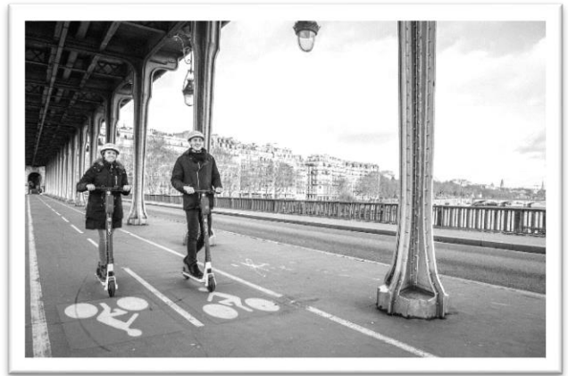
圖為巴黎 Lime 電動車行進圖

除了單車之外，時下巴黎街頭最吸睛的莫過於電動滑板車了，2018 年起始，由 Google 投資的 Lime 電動滑板車首先進駐巴黎街頭，最初投放了一百五十台的電動滑板車，使用者只需要下載 app 註冊帳號、綁定信用卡或其他支付方式即可開始體驗，有些其他品牌的電動滑板車則需要歐洲當地手機號碼，因此，到巴黎觀光的旅客若想體驗電動滑板車，也可能需要一張攜有歐洲手機號碼的 SIM 卡；付費方式的部分，Lime 為儲值式，有不同價位的方案可以選擇，依照使用狀況扣款；Lime 電動滑板車 app 裡直接提供使用者周邊地圖查詢，快速定位離自己最近的可用車輛及可用電量，找到車輛之後用手機掃描車把手上的 QRcode 即可使用，電動滑板車騎乘方式與一般滑板車相同，起步時用腳滑動幾下之後按下電動油門按鈕，便能輕鬆漫遊街頭，煞車則有兩種機型選擇，按鈕式及手煞式，抵達目的地之後，停靠在路邊就可以輕鬆還車，另外亦有他牌電動滑板車以拍照證明還車地點的方式歸還車輛；計費方式以目前車輛數量最多的 Lime 為例，則是一開始騎乘即扣基本費用約 1 歐，接下來以每分鐘 0.15 歐為單位計價。除了 Lime 品牌之外，目前巴黎亦可見其他如 Bird、Jump 等共享電動滑板車，各家廠牌的操作過程及收費標準皆大同小異，現在電動滑板車已成為巴黎車陣中的日常風景，整個巴黎已經投放至少兩萬台電動滑板車。