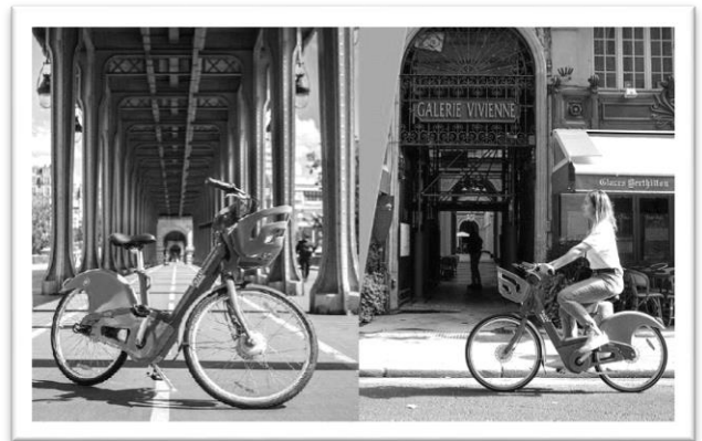
圖為 Vélib' 巴黎公共單車， 左為電動自行車，右為一般自行車。

車行的樂趣及方便性讓不少當地人樂意改變生活型態，利用單車上下班或上下學，公共單車亦拉近熱門景點與其他大眾運輸如地鐵或公車站之前的距離，同時也擴大了觀光客移動範圍，甚至出現不少部落客、旅遊書主打巴黎單車自由行的路線，2014 年，Vélib' 推出幼童版的公共單車，讓親子能夠騎單車共遊，至去年（2018）Vélib' 再度改版推出新選擇，除原先綠色車體的單車外，還有藍色車體的電動自行車滿足不同需求的使用者；目前巴黎除了 Vélib' 系統的共享單車外，還有 Mobik、OFO、Obike 三家單車廠商可供選擇，有別於 Vélib' 定點站式還車，此三家則是路邊隨處可見即可租借騎乘。