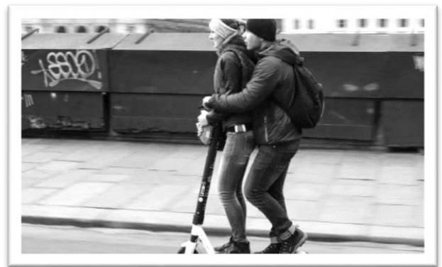
圖為巴黎街頭電動滑板車雙人騎乘

作為一位旅行者，見到路上如雨後春筍不斷冒出，不分男女老少騎著電動滑板車呼嘯而過，彷彿所有巴黎人都在與你業配：「這就是巴黎最新時尚。」，來到此地，如果不一騎滑板車，別說你造訪過這裡！這樣的畫面確實大大激起旅人的好奇心與嚐鮮心態，加上其極佳的便利性及機動性，當你發現地圖上地鐵站或公車站至參訪景點仍有段尷尬步行距離時，路邊停靠著的電動滑板車吸引力再度加乘，加上簡單的 app 操作，電動滑板車對於異鄉旅客來說，十分友善好上手。