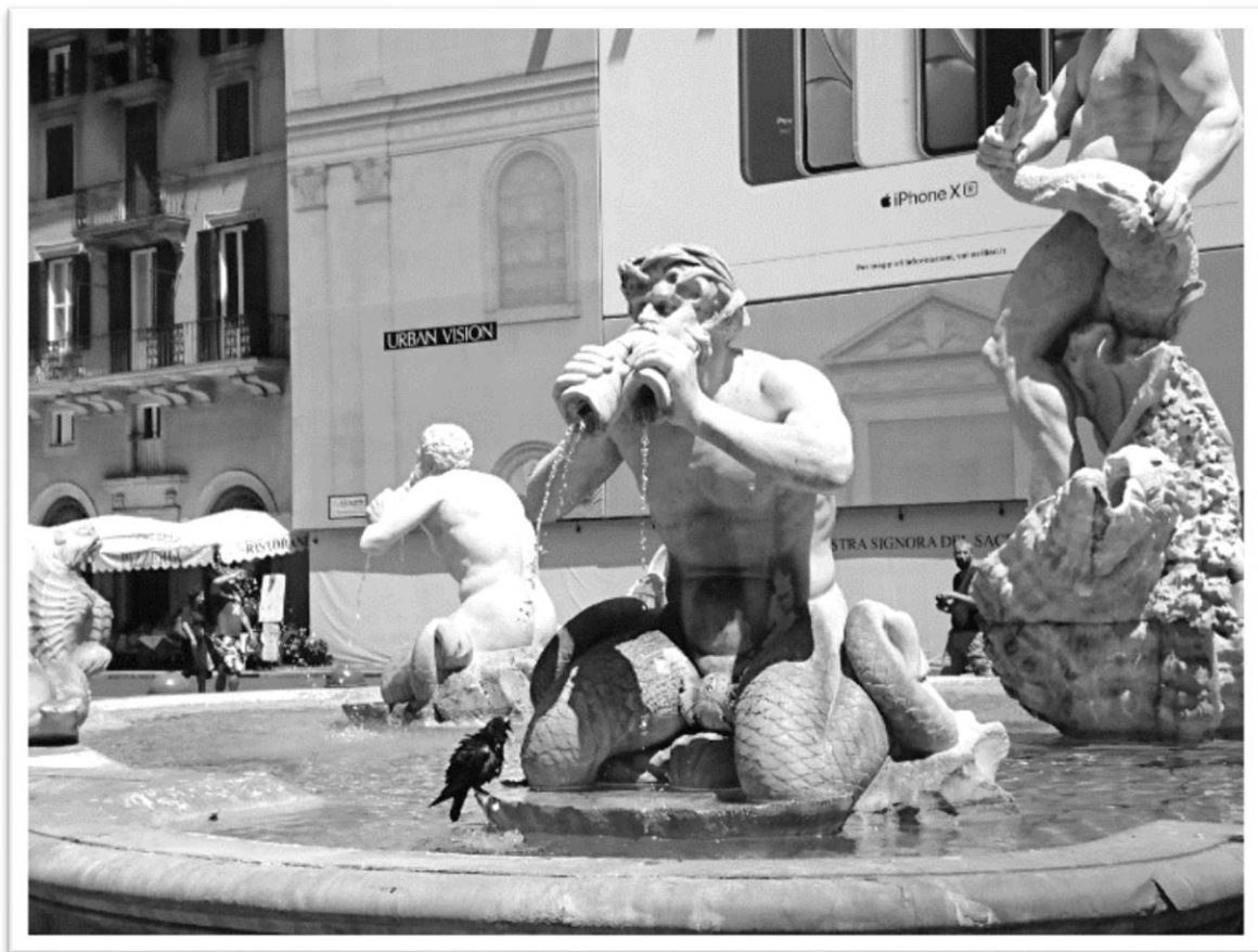
圖五：海神信使崔萊頓

由文藝復興時期的建築師兼雕塑家波爾塔（Giacomo della Porta）所設計的水池領先四河噴泉約一百年存在於廣場南北兩端，與建造、裝飾一氣呵成的四河噴泉不同，較為樸素兩座水池經過多位藝術家的妝點，才形成今日的摩爾人及海神噴泉。位於南端的噴泉在波爾塔完工時尚未取得其「摩爾人」之名，中央不見今日亮點的人物塑像，以石階架高的大理石水池內只是擺上了四座飾有海豚與貝殼且面容詭異且怪誕的面具以及由四位雕刻家分別完成的崔萊頓 3 雕像（圖五），海之信使吹奏的海螺型雙頭笛尾端噴出不甚湍急的水流，這便是噴泉的原型。