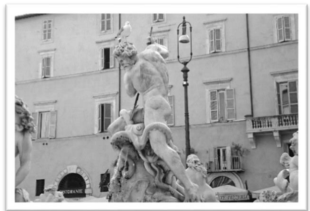
圖六：海神涅普頓持三叉戟擊退章魚

神話故事裡，來自科林斯（Corinth）的詩人兼音樂家——阿里昂（Arion）的琴技一流，在他出國比賽返程途中，贏得許多獎金與寶物的阿里昂受船員謀財害命，在被扔入海中之際，阿里昂哀求再彈奏最後一曲，優美的樂聲吸引了海裡的生物齊聚，阿里昂也因此獲救。扎帕拉所設計的雕塑正是描繪著慕樂聲而來的海寧芙仙女（Nereids）以人魚的形象與邱比特及海怪一同現身的情景，唯獨在噴泉中，他們簇擁的不是身懷絕技的音樂家，而是符合納沃納廣場風格的海神形像。