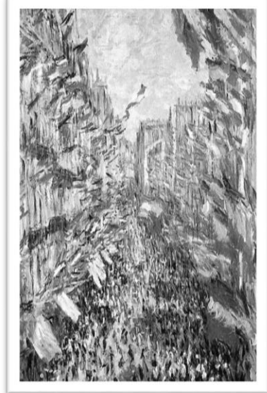
圖三：莫內畫作蒙托格伊路(Rue Montorgueil)。