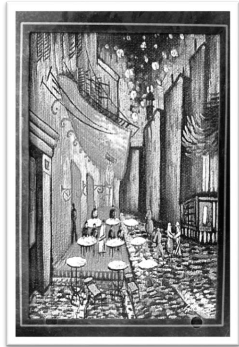
圖五：餐酒館戶外座位區。

灰缸，石子路上的空隙則常常卡著菸屁股，這種微小而確切的街邊日常正是我想收藏的。如果說咖啡廳是短暫休息的喘息空間，那麼餐酒館就是能夠忘掉一整天疲勞的救贖空間，為忙碌的一天畫下完美的句點。