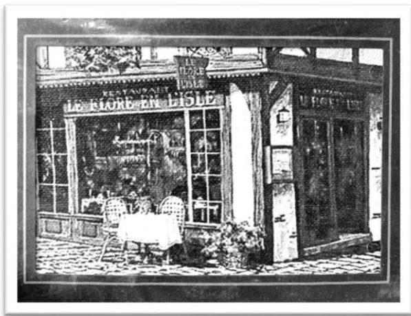
圖四：轉角的咖啡廳。

約莫一兩個街區就會有一間這樣的咖啡廳，不管重複率多高，每家店幾乎都門庭若市，因為它是巴黎人日常生活當中很重要的一個所在，提供忙碌的都市生活一個喘息的空間、一杯咖啡的時間、一塊小蛋糕的餘裕，讓人走出咖啡廳之後又能充滿活力。