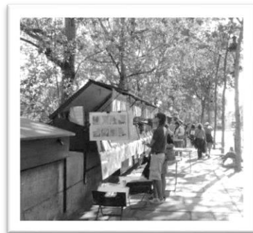
圖一：巴黎街頭販賣畫作的小攤販（張瑋芸攝，取自 https://solomo.xinmedia.com/travel/14922-paris ）。

這次去到巴黎，往來穿梭各類小販當中，最吸引我的是路邊賣畫的攤販（圖一），比起書報攤販賣的明信片，更喜歡這種寫實風格的手繪藝術。然而每天經過十幾攤的畫販，卻從來沒有仔細逛過，部分原因是來自於對巴黎的刻板印象，總以為這種街邊小販就是為觀光客量身訂做的陷阱，不僅價格高得嚇人，一旦你駐足並流露出有興趣的表情，賣家和其同夥說不定會使出渾身解數纏著你，然後再搭上街邊濃厚的歐洲風情將你魅惑，於是你心甘情願地掏出鈔票，成為了名副其實最好騙的觀光客。