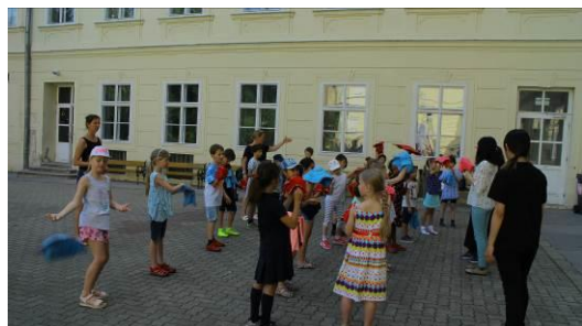
6/11(二)分組課程-八角巾