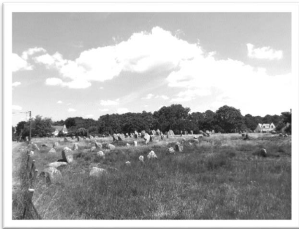
圖一：遍佈的巨石林陣

「卡納克巨石林陣（Les Alignements de Carnac），由數千塊大大小小的石頭規律排列的神秘史前遺跡。」那天在法文課 TV5 影片主題中，認識了這個獨特的景點後，就對它充滿好奇！因此在規劃暑假的環法自由行行程時，我便毫不猶豫地將這個法國隱藏版巨石陣景點納入待訪名單中（圖一）。