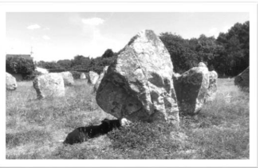
圖三： 在石頭 陰影底 下乘涼 的羊

例外，我利用了最後一小時搭乘了這輛車環繞 Carnac。小火車上有著專屬講解耳機，且乘客還可在整趟車程中選擇不同語言的導覽聆聽，十分方便。小火車從遊客中心出發，首先先朝著海邊方向駛去（圖四），經過了海水浴場時，我看見了布列塔尼的沙灘與藍得發光的海水，岸邊的一大排帆船顯示了此區的興盛度假潮，我也才知道原來來這裡不僅能看石頭，還可以玩水。比起聲望極高的南法蔚藍海岸，這片海多了一分悠閒與道地，無意間發現這片自由氣息的我，多麼希望下次造訪布列塔尼時，能夠開車來這片海度假。而後火車又駛過 Kermario 區域較高處的巨石陣群，讓乘客們以不同的視角和速度將這片遺跡盡收眼底。Carnac 的巨石陣由於尺寸較小，第一眼完全比不上英國版的雄偉，但多看幾次後，這些整齊遍佈各地的中型石頭們也很讓人回味無窮。