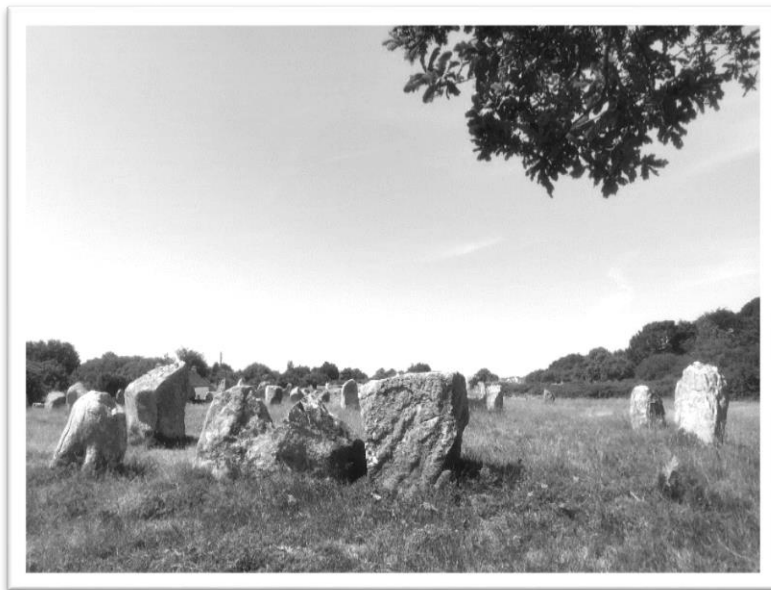
圖五：巨石林陣一景