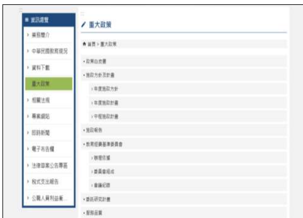
圖 2 教育部重大政策項目

我國家庭教育政策的主管機關為教育部，所以政策資料的選取以教育部公布的教育政策資料為分析文本，參照教育部網站資料將教育政策分為當前教育重大政策、政策白皮書、年度施政方針、年度施政計畫、中程施政計畫及施政報告，如下圖 2 所示。