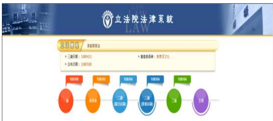
表 4 立法院法律系統表

而性別議題從原始到歷次修法，其多元文化圖像為何？內容如何表現？本文從立法院法律系統之家庭教育法法條沿革及立法紀錄，如附錄整理如下表 5。