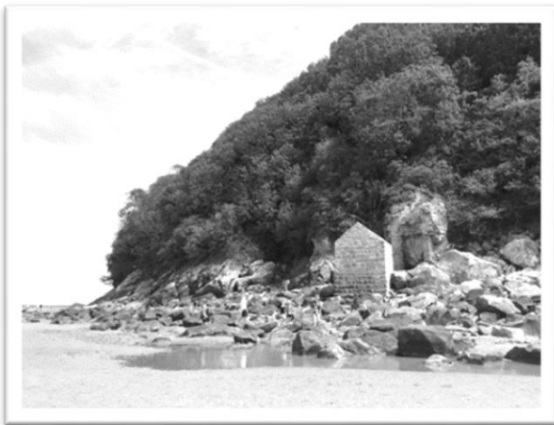
圖四：山後頭，長著青苔的斷垣殘壁

粒分明的沙子上，就像踩在一般的濱海沙灘上。漸漸地，觸感越來越冰涼柔軟，像是踩在黏土軟墊上，十分舒服怡人。吹著淡淡海水鹹味的海風，一手拎著鞋子、一手瘋狂撥開被吹亂的頭髮，狼狽卻享受。我和領隊姊姊在這片沙洲上短暫冒險，繞到聖米歇爾山的後頭，我們看見長著青苔的斷垣殘壁（圖四）。不清楚這區的來歷與故事，但馬上被這意外的景色吸引，我不自覺地朝著它走去，並攀上一座像是小屋子的建築裡一窺究竟，滿足好奇心。我們停留在沙洲上的時間不多，看著遠方的幾個小黑點，估計是另一群旅客結伴冒險去，若是有更多的時間，我也希望能往遠方小島的方向前行探險。