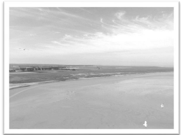
圖三：在廣場上瞭望的沙洲景色

能看見一望無際又平靜的潮間帶風景，也可以看見遠方的綠草原。周圍的景觀比建築本身更讓人值得留戀，隨著時辰的變化，潮汐與天色替修道院換上各式各樣迷人的衣裳。吹著海風，任頭髮飛揚，看著遠方並放空著腦袋，站在廣場上悠閒地看著這片靜謐的景色，聽著海鷗的叫聲發呆片刻是這個白天最幸福的時光（圖三）。