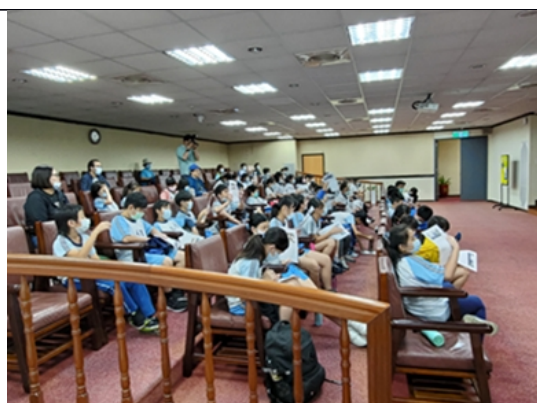
「2020 臺灣女孩日影片欣賞及座談」活動於逸仙放映室辦理