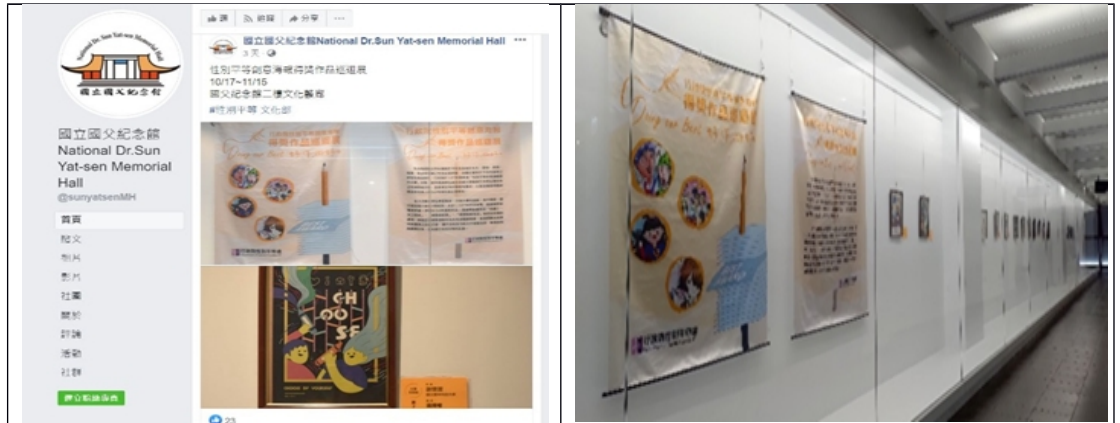
109年10月17日至11月15日「行政院性別平等創意海報徵件比賽得獎作品巡迴展覽」

109年10月17日至11月15日與行政院性別平等處跨機關合辦「行政院性別平等創意海報徵件比賽得獎作品巡迴展覽」。