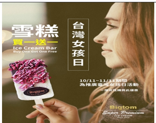
109 年臺灣女孩日 Bigtom 「雪糕買一送一」活動