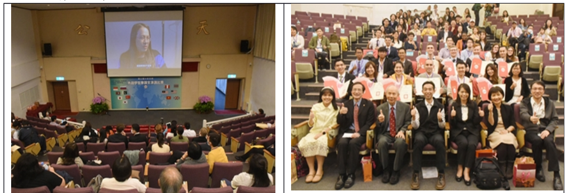
109年11月24日第48屆「外籍學生華語文演講比賽」播映「XX的房間」

109年11月24日第48屆「外籍學生華語文演講比賽」特別在賽後成績統計時段，播映行政院性別平等宣導影片「XX的房間」，於活動中注入多元文化價值，使外籍學生能認識、尊重及平等對待多元的社會族群。