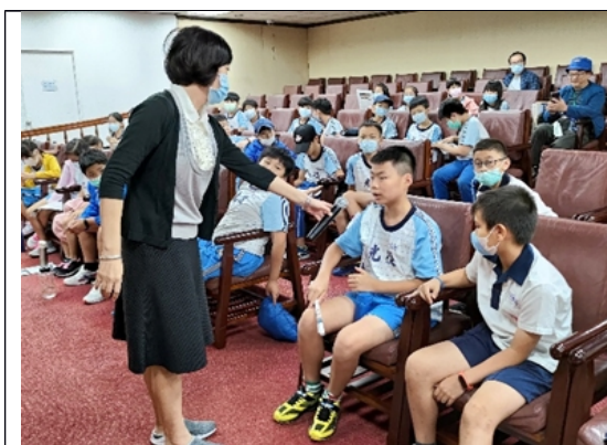
光復國小 5 年級學生於「2020 臺灣女孩日影片欣賞及座談」有獎徵答時段踴躍發言

參訓人數共 123 人，女性 69 人(56.1%)、男性 54 人(43.9%)，包括光復國小師生 58 人(女 44.8%、男 55.2%)、私部門人員 4 人(女 25%、男 75%)、本館志工 10 人(女 90%、男 10%)及員工 51 人(含前、後測，女 64.7%、男 35.3%)。