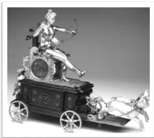
凱旋戰車時鐘

日心說，但尚未普及，因此這座十六世紀的渾天儀仍是彰顯「地心說」，最中央的圓球代表地球，外圈的圓環分別代表著子午線、太陽月亮和其他星體運行的軌道，相當有趣。但丁工作室則是博物館中的迷你博物館，兩旁的玻璃展示櫃放著主人吉安·賈科莫最精緻喜愛的小型藏品、母親的半身雕像、曾經使用的家具等等，整個空間被鮮豔的壁畫、鍍金雕塑覆蓋，以但丁故事為主題的彩繪玻璃窗顯示當時的工藝技術已精良到足以用大片玻璃直接構圖取代多片細小碎玻璃拼貼，由外透入的光線讓整個空間明亮不至於因多彩及數量眾多的物件而顯得壓迫，整個空間本身就是一個不可多得的藝術品。