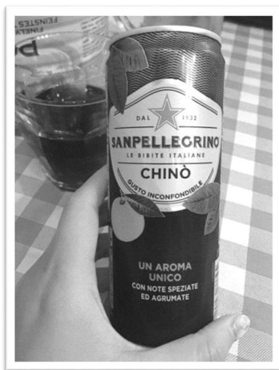
義大利特有的飲料