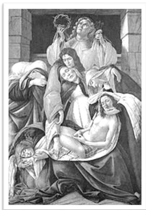
哀悼死去的基督