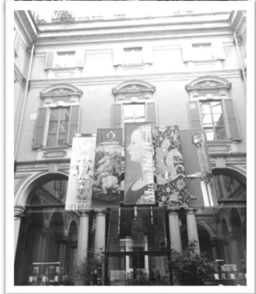
波爾蒂佩佐利博物館入口

作，甚至是修道院與教會中精緻無比的宗教雕塑、金飾與繪畫。他於 1879 年逝世，並於遺囑中交代將宅邸本身及所收藏的藝術品全數捐給政府。當我手持導覽地圖在展間中漫步欣賞展覽品時，一邊幻想著吉安·賈科莫彼時被美麗的藏品圍繞該是何等心滿意足，而