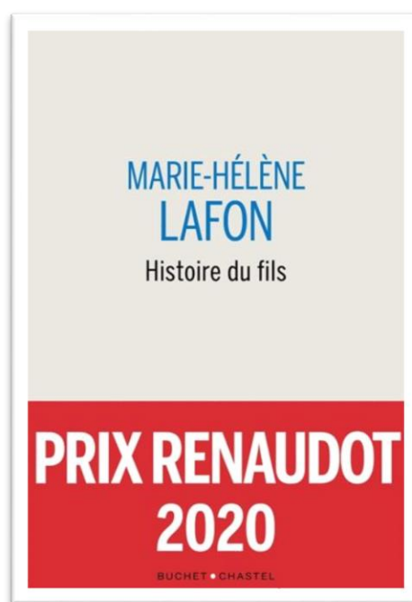
《兒子的故事》(Histoire du fils)