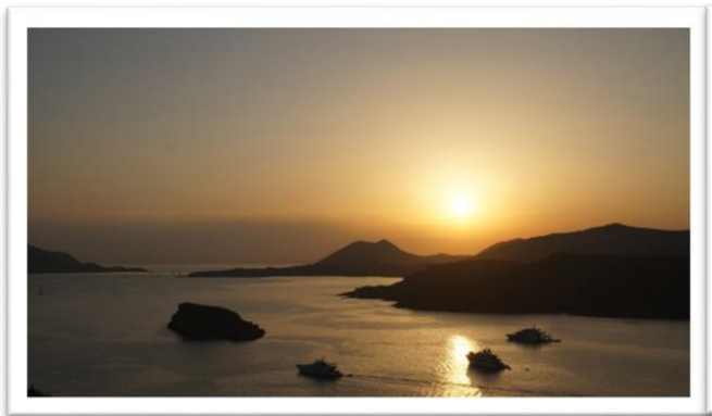
索尼恩岬角夕陽