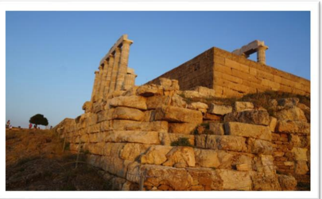
海神殿一隅，建築在一座要塞上