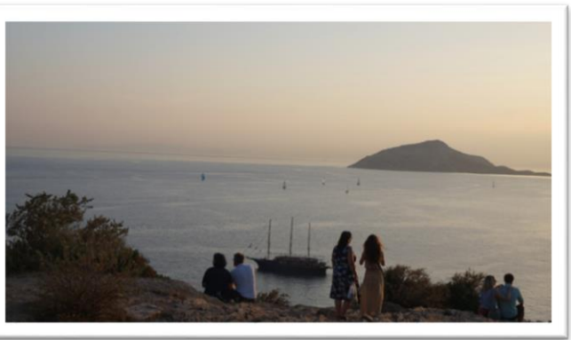
索尼恩岬角懸崖