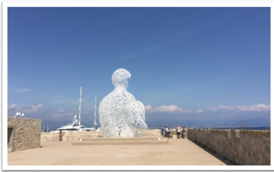
圖三：位於安提布（Antibes），Jaume Plensa 的雕像 Le Nomade。

安提布是蔚藍海岸區一座夾在兩大知名城市坎城（Cannes）與尼斯（Nice）中間的小城，也是這次旅行中意外發現的世外桃源。起先規劃走訪這個城市只是為了畢卡索博物館以及西班牙藝術家 Jaume Plensa 立在卡雷堡（Le Fort Carré）的雕像（Le Nomade）（圖三），後來意外發現這裡還有難得的沙岸以及野生的海岸 Bay of Antibes Billionaires。