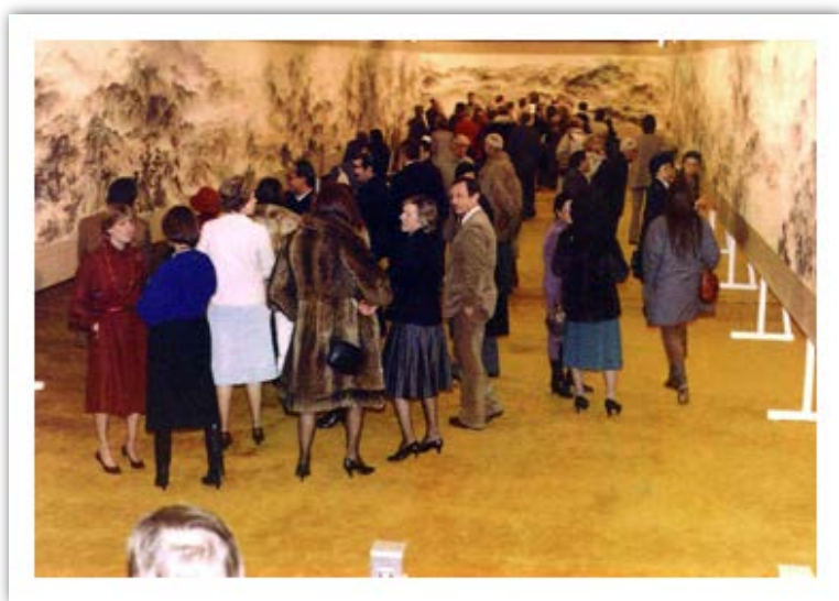
《寶島長春圖卷》於 1983 年 11 月至 1984 年 1 月在北京市府大廈展覽廳、北京魯汶大學展覽廳、烈日市國際會議中心等處展出。