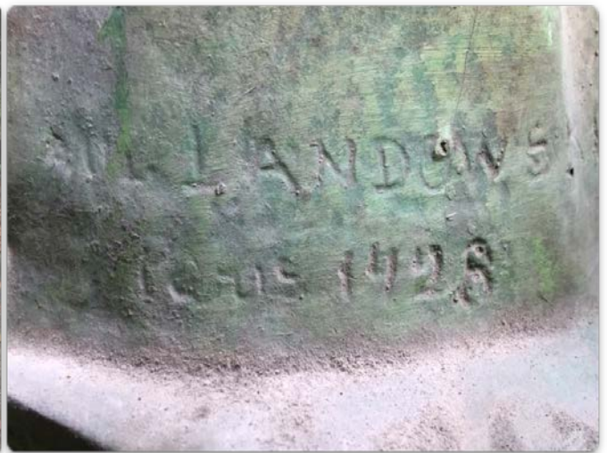
左圖為國父半身像，翻模自法國雕塑家保羅·朗多夫斯基 (Paul Landowski) 親手製作之銅像。 右圖為朗多夫斯基 (Paul Landowski) 作品簽名，國父半身像背面。