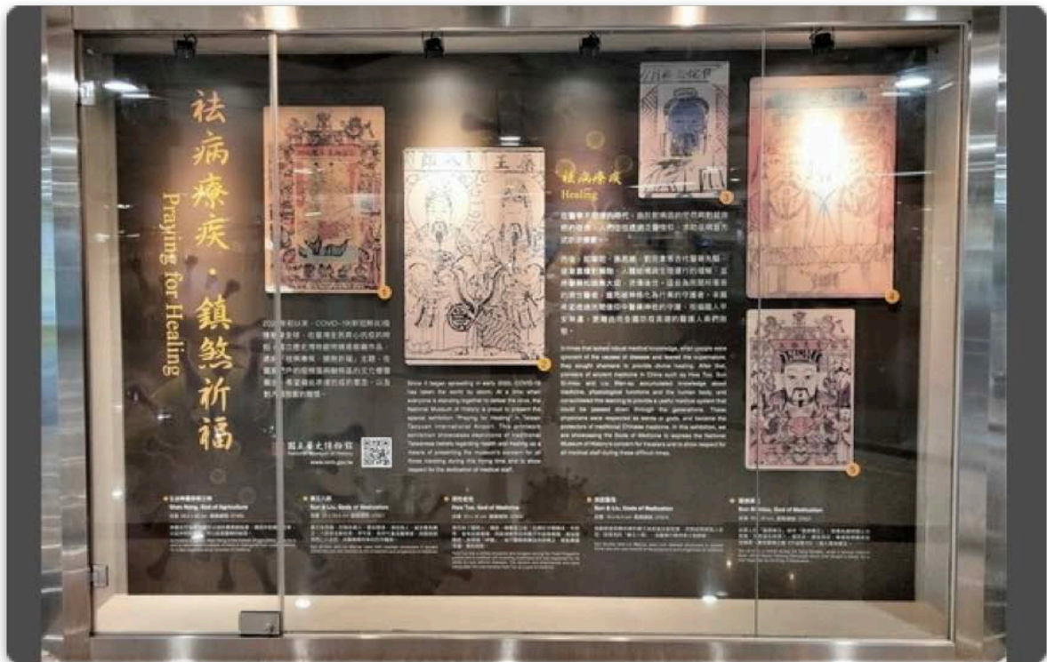
《祛病鎮煞》於桃園國際機場文化櫥窗展出，藉此祈祝新冠肺炎疫情期間，國內外旅客能平安無虞並向防疫英雄們致敬。透過櫥窗設計可以觀察到藉由神明形象鎮住背景的「病毒」。