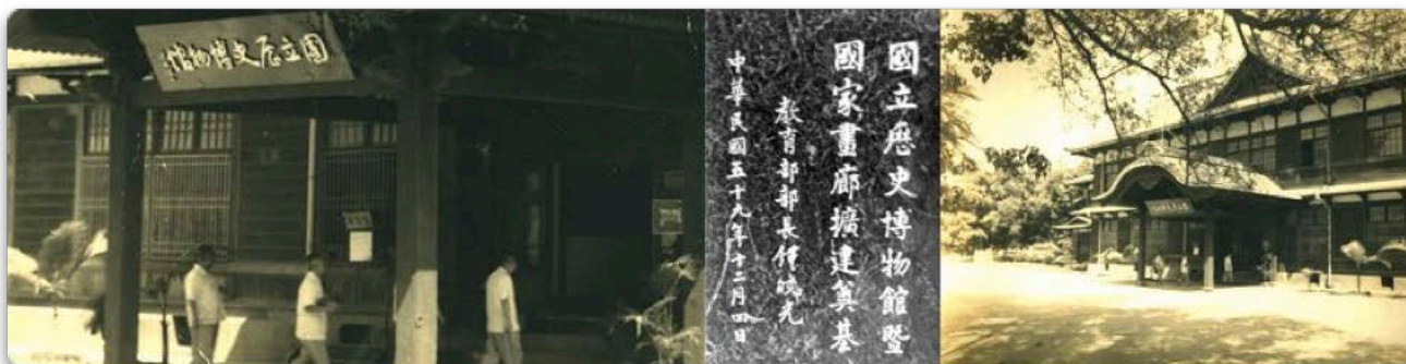
國立歷史博物館建於 1955 年 12 月 4 日。建館館址選定於植物園內的一棟日式木造建築，這棟建築在日治時期是作為當時總督府殖產局的商品陳列館。

談到史博館的 6 個故事，要從地下 1 樓「遵彭廳」說起。這是為了紀念臺灣第一位博物館館長包遵彭先生，他是奠定臺灣博物館與圖書館的第一人、更是所有博物館人的典範。往上層看去，是「大千廳」—張大千先生是臺灣重要的藝術家，另一項含義則是佛教裡面的「大千世界」，意謂著宇宙。史博館畫廊的第一個展，也是展出張大千先生的一百張水墨畫，正因為大千世界，希望讓民眾一進到史博館，彷彿踏進了「浩瀚的藝術宇宙」。