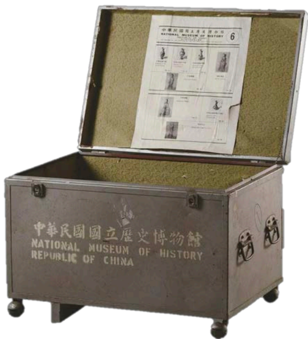
1970年代史博製造之中華文物箱

史博館於 1955 年開館，當時有個有趣的別稱，叫做「真空館」—裡頭什麼都沒有。恰巧，1960 年代初，史博館接到外交部的委託，發想出「中華文物箱」這個概念作為國際交流的資源，館方於是邀請專家製作文物複製品，並將它們放進標有「中華文物箱」字樣的鐵箱，至國外巡迴展出。由此可以看見，當年史博館在物資缺乏的情況下仍發揮創意，將這些文物分享出去。現今大家可能會覺得複製品稀鬆平常，但是，當年正因為這些「複製品」充分出演它們專屬的角色，臺灣的國際文化交流於是能慢慢建立起來，而這種交流，就是所謂「文化外交」的雛形。