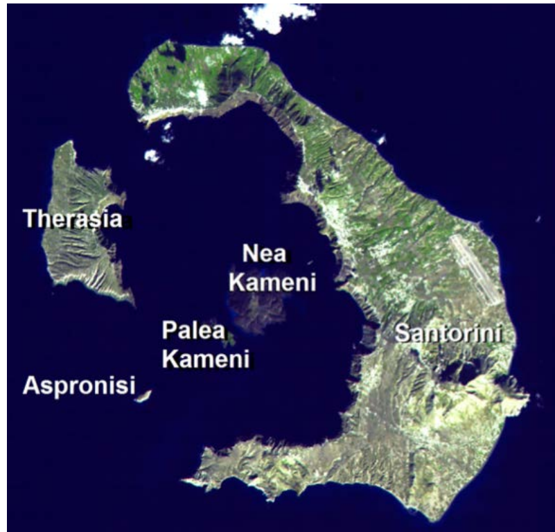
聖托里尼島衛星圖

去年春天早早預訂好的五月希臘愛琴海島群旅遊，由於新冠肺炎來勢洶洶，封城禁足令之下，所有旅行皆硬生生取消延期。原本以為直接延期一年，疫情過去，便可恢復旅行，誰知疫情一波未平一波又起，今年春天儘管已有疫苗接種，然而在覆蓋率仍低的情況下，第三波疫情仍使得大部分的歐洲國家封城直至五月。隨著疫苗的大幅施打，歐盟國紛紛漸進解禁，今年夏天七、八月，歐洲境內的跨國旅行才稍稍鬆綁。以觀光為國民收入大宗的希臘，五月中之後，便有條件地開放旅遊，已經取消兩次的希臘行，終於在今夏見到一絲希望。我們決定把一半難以延期的行程，包括旅館及機票，趁這個小解禁的夏天，趕快實現。重新規劃後的行程，不再是愛琴海島群，只選了 Santorini 聖托里尼島及 Naxos 納克索斯兩個島嶼。近年來由於國際觀光客大量湧入聖托里尼島，夏天旺季人潮洶湧，根本不適合來此旅行，不過今年因為疫情的限制，會來希臘的旅客幾乎只剩下歐洲人，加上入境希臘需要出示疫苗接種證明或 PCR 檢驗陰性，算是多了一層保障，才放心規劃了這次的雙島行。Delta 變種病毒威脅下，誰都不能預知秋天是否會面臨第四波