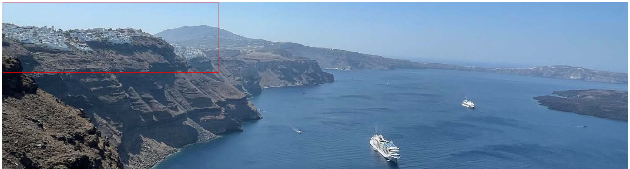
聖托里尼島 Fira 市建於兩百公尺高處的懸崖峭壁之上。