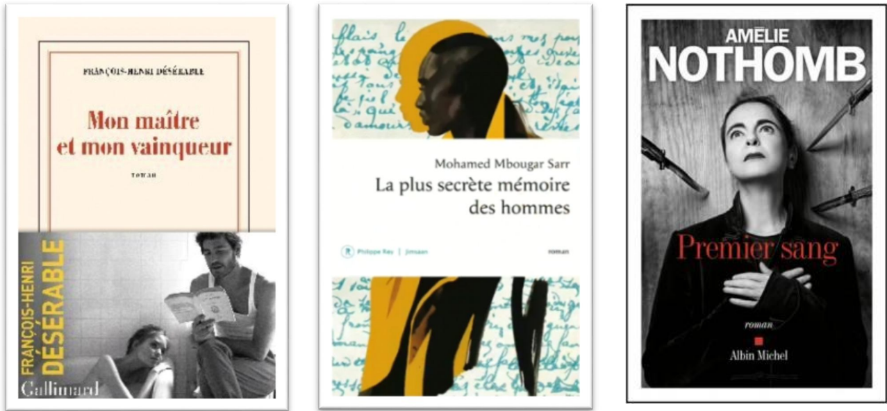
圖三至五(左起)：François-Henri Désérable 的《我的主人，我的征服者》、Mohamed Mbougar Sarr 的《人類最隱祕的記憶》、Amélie Nothomb 的《第一滴血》

法蘭西學院的創作獎助金 Prix Amic，在 2013 年時便已頒給 François-Henri Désérable 的《將我的頭顱展示在人民眼前》(Tu montreras ma tête au peuple, Gallimard 出版)，今年的小說大獎似乎像是再次確認授獎選擇，也再度肯定作者的聞風及努力。《我的主人，我的征服者》的題材十分「古典」，兩男一女的情感糾纏，故事從法官傳喚敘述者展開，敘述者的好友 Vasco 被捕時身上只有一把手槍和題為「我的主人，我的征服者」的筆記本。筆記中 Vasco 為 Tina 寫了許多情詩，敘述者將兩個戀人的關係對法官娓娓道出，對細節知之甚詳的敘述者其實也愛上了 Tina...。明明是帶有悲劇意味的三角關係，在 François-Henri Désérable 慧黠的筆下，充滿了幽默的亮點，深刻、細緻卻不憤世刻板。