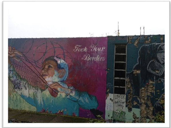
圖二：魔鬼山的塗鴉作品。