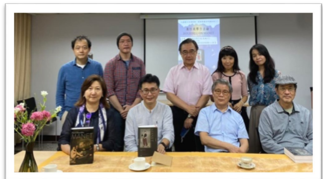
《稟性美學方法論－Bourdieu on Manet》講座側拍及與會者合影。

學界關於 Bourdieu 的討論眾多，台灣藝術與社會學學會 2016 年也曾在紫藤廬舉辦以 Bourdieu 為題的暑期大型讀書會，Bourdieu 新書《馬內的象徵革命》就是第三