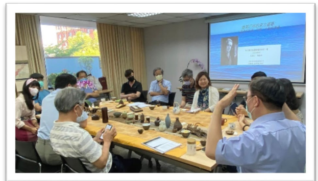
《羅蘭巴特的東方遲暮—如何共同生活、中性、小說的準備》與會狀況及以俳句書法藝術與茶席點題的布置。