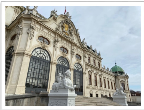
圖一：維也納美景宮。

大部分的旅客來到美景宮都是為了欣賞克林姆(Gustav Klimt, 1862-1918)《吻》(Der Kuss, 1908)真跡。至於為什麼這件畫作會展覽