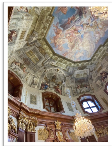
圖二：維也納上美景宮內部。