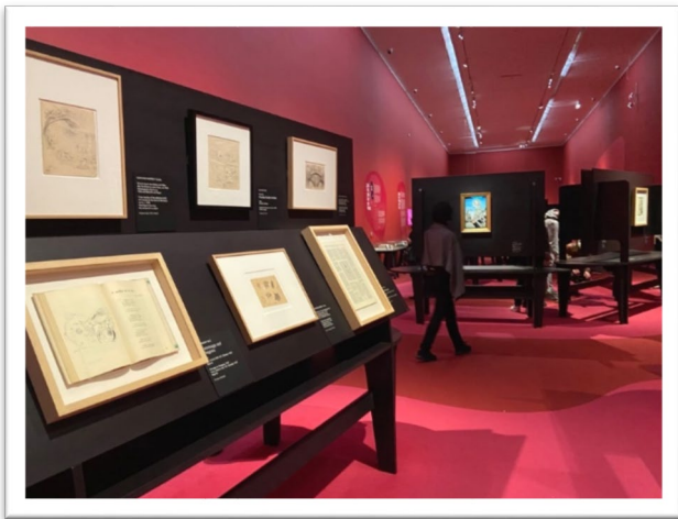
圖五：「達利與佛洛伊德--An Obsession」特展。

2022 年的春天，台灣的中正紀念堂展出了超現實主義畫家達利的作品，無獨有偶，下美景宮也於 2022 上半年展出達利相關展覽：達利 (Salvador Dalí) 與佛洛伊德 (Sigmund Freud) — An Obsession (圖五)。此次展覽展出一百多件畫作與相關文件，包括超現實主義物品、照片、電影、書籍、期刊、信件等等。展覽主軸為關注達利的家庭與成長背景，從心理與精神分析角度剖析這些背景是如何塑造出往後的創作風格，開創出獨特的視覺語言。