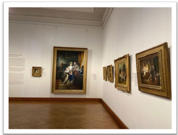
圖四：「Biedermeier Better Times?」特展。