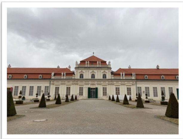
圖三：維也納下美景宮。

此次光臨的上美景宮，陳列了19世紀德意志邦聯的畢德麥爾(Biedermeier)展覽(圖四)。源自1850年代的畢德麥爾，曾被兩位詩人當作筆名，可理解為「賢惠的、普通的家」，直到十九世紀末，Biedermeier才有了明確的代表時期：1815年至1848年。由於時代背景與政治因素，人民開始將重心與期望放在自己身上，中產階級的自我意識逐漸提升，開始注重生活品味與情趣，田園詩歌的愜意成為了理想情境，也因此注入越來越多藝術活動，沙龍文化也開始蓬勃發展。畢德麥爾以其繪畫、裝飾和建築聞名，繪畫內容又分為許多類型主題，如人物肖像畫、家族繪畫、靜物畫、風景畫、風俗畫等等。其中，畢德麥爾的風俗畫不僅關注市民的日常生活，也描繪了社會不同階層的樣貌，從貴族、中產階級到農村家庭生活都可以成為畫中角色。風格則是融合了荷蘭十七世紀繪畫、法國新古典主義以及浪漫主義技法，