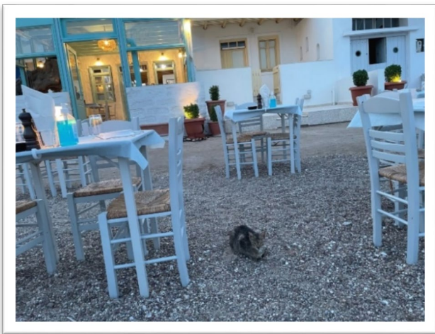
圖七：在桌邊等待食物的貓咪。

悠閒消磨了一整天，連船員都有時間下水暢游。到了接近六點才駛進港口停靠，這個小港灣沒什麼遊艇停靠，不必搶位子。沒想到船