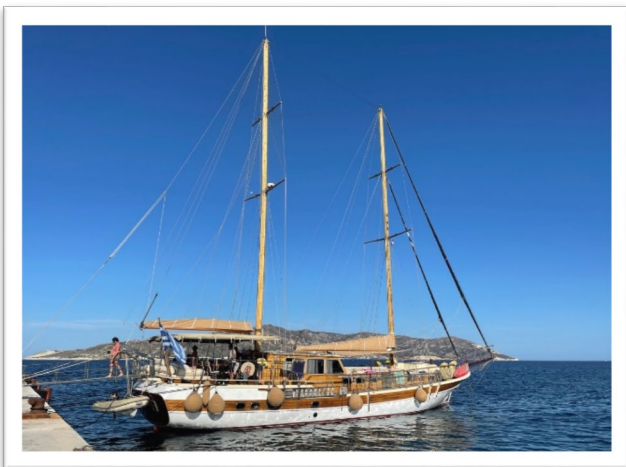
圖二：Le Kapetan-Kosmas 號遊艇。

首日出航抵達的小島 Serifos(圖四)。一整日在海上飄搖，雖然悠閒，但也渴望陸地的穩定感，船一停妥，背包水壺拿了，馬上鎖定登高望遠的小徑前行。從港口走到山頂的小城堡船教堂，大約需要一個多小時。路不難走，穿涼鞋也能爬，一連串的階梯，時不時停下來喘口氣。遇見一隻可愛小貓咪，跟著我們爬了一段路，可惜身上沒帶貓食，牠一直對著我喵喵叫。登到山頂教堂旁可俯瞰整個港灣，視野極佳，遊客也零零落落，一路上經過的屋子感覺一半以上沒人住，安靜得令人發慌，非旺季的希臘小島出人意料地清幽。經過大馬路時迎面走來一對英國老夫婦，大概爬坡累了，問我們前方是否有咖啡館或賣飲料的地方，非