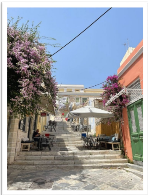
圖九：Syros 島的大城 Ermoupolis。

下船後在 Syros 島停留四天。這個島雖不吸引觀光客，也不知名，卻是愛琴海諸島群的首府。光是城區有大教堂並設有醫院便說明其重要性。港區城市 Ermoupolis (圖九)非常大，店家面對的客人以當地居民為主，解釋文字也常常只有希臘文，並不標注英文。很多創意店家，看起來精緻又獨特，充滿精巧的生活感，與 Mykonos 、 Santorini 那種觀光客泛濫的島嶼氣氛，完全不同。整座城市依山傍海，從港口開始，往山頂教堂的方向走，便是一直上升的階梯，不爬到氣喘吁吁，幾乎無法抵達。一星期的海上生活後，只想努力爬階梯，登高望遠，逛商店、市集，接近陸地接近人，海灘什麼的，暫停一日。