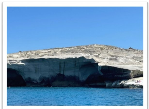
圖五：Milos 島美麗豪氣的白色大岩塊。

第二站停泊美麗的 Milos 島。約莫中午時停靠在船長口中的祕境海灣 Sarakiniko 海灘的外圍。溪流的出海口，美麗豪氣的白色大岩塊(圖五)，的確引人入勝。船停泊點離岸邊有點遠，讓我有些害怕。聽別人的評價不錯，想換船上配備的 Décathlon 的全罩式新型面罩下水試試，卻換了三個才稍合臉形。不知怎麼游到了岸邊大岩石，才發現臉型超不合，從下巴處會進水。這下開始慌張，游不回船上怎麼辦，眼前美景根本無心好好享受。先生一下水就說看到水母，我也根本沒時間理會。無法可施，只好跟先生交換，我戴他的普通面鏡和呼吸管回去，他戴 Décathlon 面鏡，幸好他臉形完全符合，毫無進水問題，我才驚覺也許這好東西不適合亞洲人臉形。在河海交界處時其實覺得腿很痛，因為心慌，一直以為是靠岸邊岩石調整面鏡時皮膚刮到岩石，不以為意，忍著痛拼命游回船邊，才發現上船階梯在另一