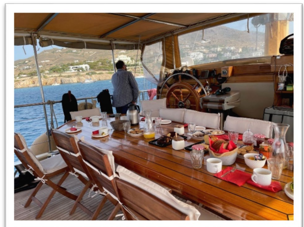
圖三：乘客每日一起享用早餐、午餐。