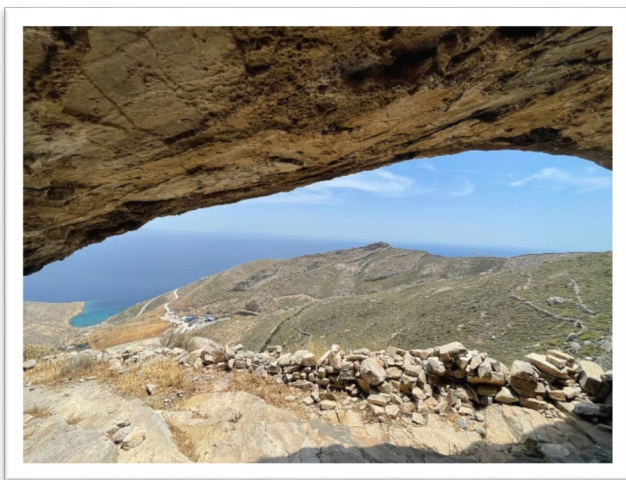
圖十二：Ferekydi cave 的景色。

走，幸好一路上小徑看起來都還算清楚，只不過佈滿小岩石，到處是尖刺的植物，即使穿長褲走起來也很痛苦。除了爬坡很喘之外，並不特別困難。太陽熾烈，氣溫 30 度左右，不算什麼，若夏季前來，則可能面臨 36 度以上高溫，大概就不太適合健行了。走到 Richopo 那兒，眼前幾棟民宅，一位老先生看到我們一身健行裝，馬上明白我們的目的地，往前方小徑一指，就說出 Ferekydi cave 的關鍵字。接下來的山徑很清楚好走，卻一路看到越來越多的垃圾，塑膠袋、塑膠瓶，夾在樹叢間，卡在岩石上，明明美好的山景，怎麼突然變成垃圾之路了？越過山頭才看清楚，原來山腳下竟然是垃圾堆置掩埋場，就在一個顏色漂亮的海灣裡面，Ferekydi cave 的正下方！難怪所有裸露的垃圾，隨著海風，不受控制地亂飛亂竄，最後沾附整個山頁，景象驚人。網路上已有人留言批評，導致這條編號 1 號的 Syros 健行路線，如今行人稀罕，我們一路上完全沒有遇到任何其他的健走人。不明白為何垃圾場