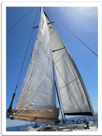
圖六：船長下指令揚帆。

下午下船後想去小健行，只能乖乖一身長褲，我可不想在紅腫之上還曬傷！兩條腿已面目全非，遮蔽一下別嚇人總是好的。