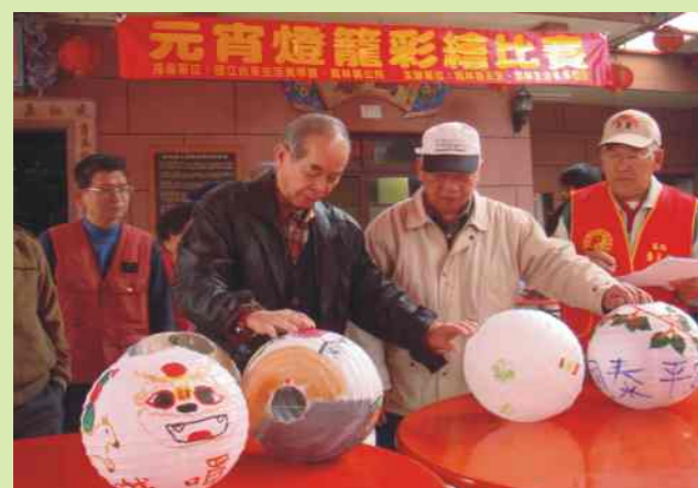
燈籠彩繪比賽活動中評審認真評作品

大家對過年共同的印象是一年不如一年，今年感受似乎更甚以往。除了回鄉的遊子，觀光旅遊人潮較近幾年少了很多，從台九線的順暢程度可以明顯的反應實情。民間年節的活動從吃尾牙開始，接下來送神、大掃除、貼春聯、吃年夜飯、發紅包、回娘家...等習俗，一直到元宵節各地方民俗活動不盡相同，也因為人們生活型態的改變，漸漸的簡化許多年節習俗，或由商業行為取而代之。像提燈籠過元宵節即是最明顯的例子。