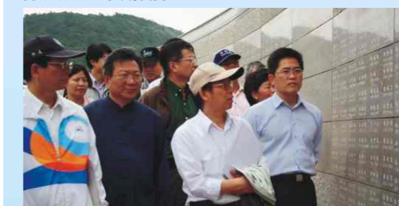
中央部會首長參觀人權紀念碑