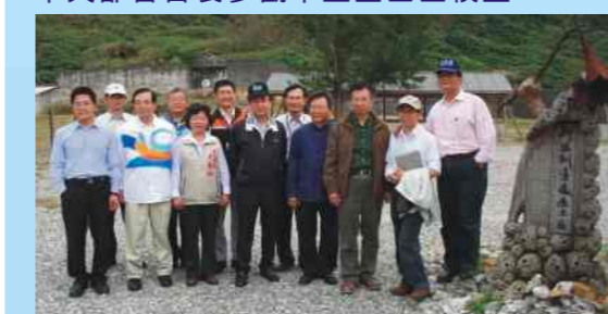
來訪部會首長大合照