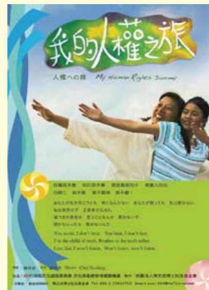
「我的人權之路」是一部為年輕世代介紹台灣人權歷史的紀錄片。