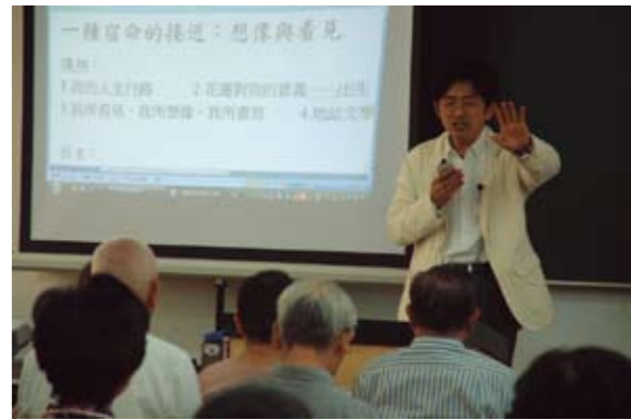
陳義芝教授演講一種宿命的接近

我們是一群在花蓮縣婦女會學習英語、日文的資深婆婆媽媽，平日除了上學就是燒茶煮飯、侍候老公、照顧公婆和孩子們，這都是我們熟悉而瞭解的事和人，所以都能無怨無悔的做家事愛家人。如果能透過文學的著作，讓我們對自己居住的地方，有深一層的了解，對周邊的人文故事，知道得更詳細，對自然保育由瞭解而付出更多