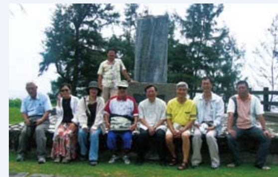
文化景點之一成功鎮石雨傘東台灣傳教百年紀念碑