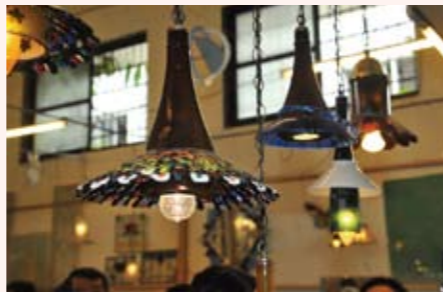
藝文產業創新育成中心玻璃瓶製造的創意燈飾