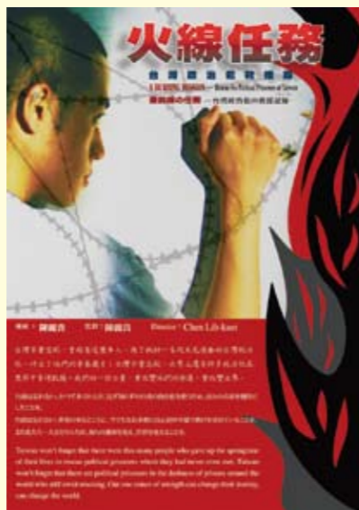
「火線任務」是紀錄戒嚴時期救援「政治犯」的紀錄片。