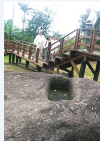
文化景點之一長濱鄉長光部落內的史前岩棺