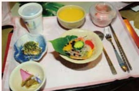
蓮花套餐成功創造了商機