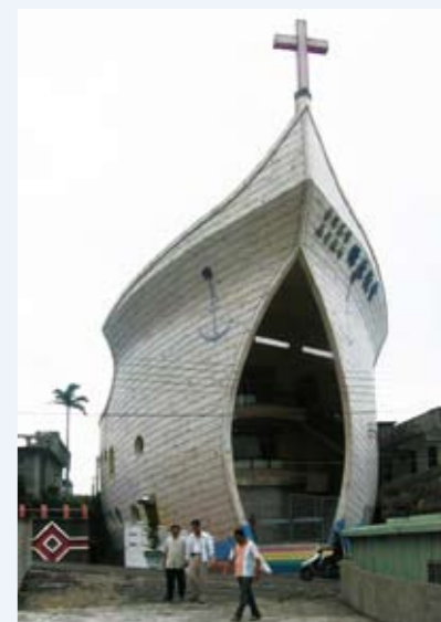
長濱鄉樟原的長老教會諾亞方舟教堂

推動台東特色文化景點導覽計畫，再透過導覽解說研習及推廣，讓遊客驚嘆後山之美，讓地方鄉親懂得珍惜後山自然景觀和在地文化，進而體驗台東文化之美，以達到由介紹文化旅遊帶動台東觀光發展的目的