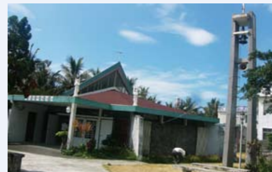
小馬天主堂的小巧典雅是台東縣的歷史建築之一