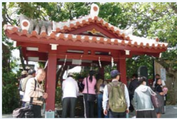
波上宮之手水：參拜神社前需先淨手、淨口、淨心再進行祈福祈願。

件也很多元，因此，導遊的知識學習與經驗累積可以說是沒有停滯的時候。琉球的每一處觀光景點，均可以看出其用心的地方，配合景點特色設計出符合的空間氛圍與景觀，大至建築主體小至垃圾桶的形狀設置，都表現出其整體性，服務人員的服裝呈現更是遊客爭相拍照的對象。除此之外，對於環保的重視也是他們給人的深刻印象，許多設施與配置均為了尊重自然、尊重環境，我想對他們來說永續經營是努力的目標。 此行陪同我們參觀並為我們解說的導遊，是琉球當地人，對於琉球的一切十分清楚了解，能給予我們正確且最符合現狀的資訊，這是在地導覽人員的優勢，我們從他身上學習到許多可以應用於解說方