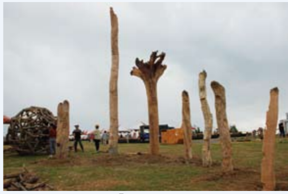
東華大學師生創作「跨過界」

入，超越本來界線，整合不同領域的一種創新的精神和勇氣，意謂著，透過藝術人文創作，從二種領域涵跨整合發展歷程的成就。然而，「跨過界」是將88水災錯綜 因緣的因果關係闡述，不在歸咎強調省思與加強重視，對大自然的敬畏與尊重，更需要以愛護的心重新面對，這次參加台東「2009東海岸漂流木國際藝術活動」是將事件以很沉重心情記錄，希望未來不再有土石流與漂流木，讓台灣良好的氣候更適合人居住。 「跨過界」觀念的表現除了前述創作動機，並以8根長短不一的樹幹作為象徵，這些樹幹有檜木、