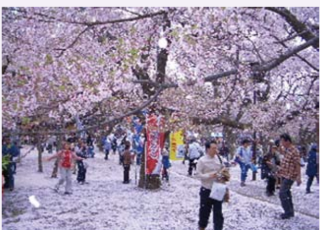
氣候不穩定的春天，讓櫻花的浪漫短暫而淒美....

所謂的「花見」（はなみ）是指藉著欣賞櫻花等，祝賀春天來訪的習俗。但現在不僅賞花，還指在群櫻怒放的樹下舉行宴會飲酒作樂。