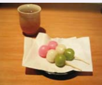
三種顏色代表三個季節的花見糰子

從江戶時代開始庶民在觀賞櫻花時當然要搭配「花見団子」（はなみだんご），使用了櫻花色（淡紅色）、白色、綠色等華麗的色彩。這3色的組合中綠色以艾草代表夏天的前兆，白色意指冬天的殘雪，櫻花色表示春天的氣息。日本有句諺語說「花より団子」，揶揄了賞花這種抽象的行為倒不如選擇糰子還比較實際。