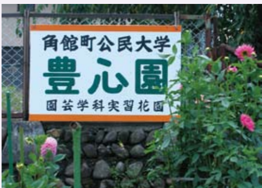
秋田縣角館町公民大學的豊心園，讓四季的花信成為生活與心靈的美學。

地形的垂直溫差所造成的美景，及北回歸線上下均溫的平穩，所帶來的溫暖氣候連日本都難以望項，可惜我們並未見整體有效規劃。若我國能善用日本規劃四季的名花勝景，而且處處皆有特色，即使是種櫻花，台灣的氣候也是在日本之前盛開，我們可以吸引到的觀光客一定不少，再結合文人墨客，長期的經營，必能創造文化厚度。寶島將是不虛此名，生活於此的人才能真的感受到幸福。營造永續的美景是需要許多條件，如尊重優良政策的規劃、愛護自然環境的修養、高素質的守法精神、審美感的覺察等，這些都是成為優雅國民的條件。上天給我們最好的土地，我們應該永世珍視來保護。