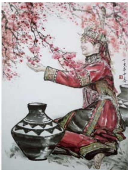
徒要教郎比併看，排灣族少女問：「春花與我，誰美啊？」

在這百花爭鳴的季節裡，清新脫俗而帶有詩意。我愛台東，這裡有我熱愛的人、事、物，這裡有優美的景色讓人心曠神怡，彷彿置身在世外桃源，也有著包含六族的台灣原住民族，二月即展開達悟族飛魚前祭，以及五月的布農族打耳祭，皆是在春天舉行。看那熱情小夥子青春的張力，幼兒無邪的笑容，純情少女含蓄的酒窩，以及立者的高大挺