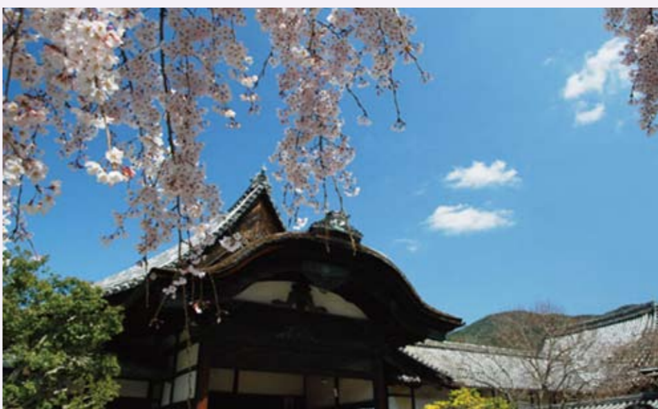
醍醐寺的三寶院，豐臣秀吉曾在此賞花

賞花與庶民平民化賞花的差異做了最好的說明。最大規模的賞櫻時期是從豐臣秀吉在京都醍醐寺觀賞櫻花開始，到了江戶時代，德川吉宗在江戶的各地獎勵種植櫻花的緣故，民間也跟著流行賞櫻。