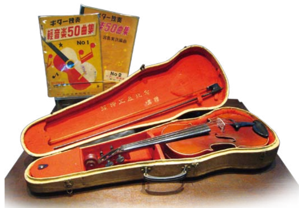
緘默的小提琴，隱藏了多少被扭曲的生命樂章。

新生訓導處展示區分為五個部份，『勞動·改造』以擬真塑像展出新生訓導的受難者在白天勞動、上課思想改造的生活情形。此展區的臘製作品，由國際知名的林建成美術工作室製作，具有國際水準，也是亞洲密度最高的臘製展覽區。『教室區』模擬呈現新生訓導處上課情形，並有留言區、服務區、資訊站、人權群像及園