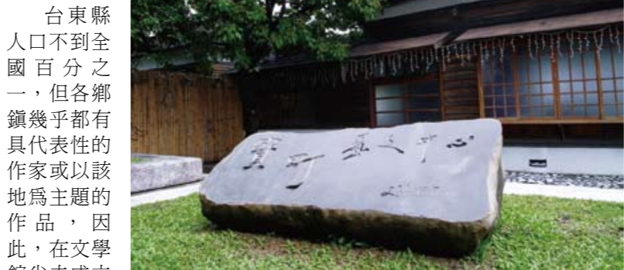
寶町藝文中心，是歷史時空中的一篇日式建築的書寫，歷久而芬芳。

台東文學書寫最大特色即是多族群文化展現，既有原住民各族的口傳採集、詩文歌詞創作，還有移民作家的書寫、兒童文學研創等，再加上日治時代的俳句短歌、寶桑吟社的古典漢詩，如卑南溪容納眾源，這樣豐美多姿的文學內涵，是台灣其他地區不曾有的現象。