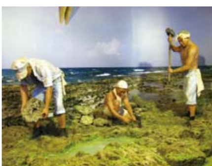
無盡的勞動改造，卻永遠也改造不了澎湃熱血與頂天脊梁。