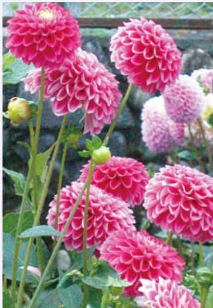
秋田縣當地公民大學老人種植的大理花，宛似青春不朽的美麗傳說。

生長在亞熱帶的人是幸運的，特別是台灣人更幸福。這一點可以從氣溫方面來應證，自去年年底至今年二月大約三個月，多少新聞報導如美國、中國、日本等四季分明的國家，因冬季大雪而造成部分地區停電斷訊，甚至暖氣不足而成災。良好的氣候是我們最大的資產，也是四季如春的好條件，兩岸開放大陸遊客來台避冬，即將成為新旅遊方式，生活於此的我們是否感覺幸運與幸福呢？