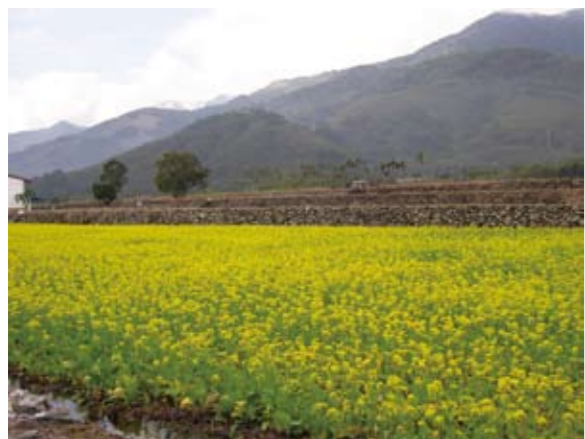
台東的四季，讓你在春天徜徉、在夏天暢懷、在秋天悠閒和在冬天盡興。

曾經在天尚未明的清晨四點起床，漱洗之後即提著前一夜準備好的錄音器材上車，奔馳在台九線上，因為和受訪對象約好六點前一定要趕到，不然會誤了他下田插秧的時間。