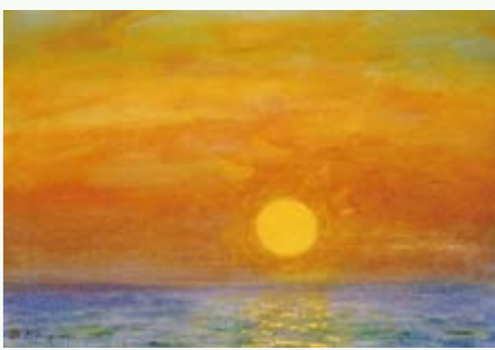
洪瑞麟晚年陽光時期，光燦斑斕的陽光給了他溫暖