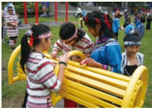
我們深信藝術可以帶來和平，藝術交流可以化解彼此的心結

接著由金洋國小表演傳統舞蹈「尋根之旅」。表演結束後兩校學生離情依依，爭相留下聯絡方式，希望未來還能保持聯絡。 布農族與泰雅族同屬高山原住民族，在以前靠打獵維生的時代裡，常常因活動範圍重疊而發生流血事件。今日在這場族群交流中，可以看到過往的衝突已被歡笑聲取代。所以我們深信藝術可以帶來和平，藝術交流可以化解彼此的心結。