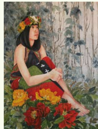
罔美頌即是，就美頌以認真創作做為歌頌美學的媒介

國立台東大學美術產業學系99級畢業生，於5月22日起到5月31號在國立台東生活美學館一樓展覽室及國立台灣史前文化博物館館史室分別展出『罔美頌』畢業展。台東大學美產系表示，「罔」古意為光明的意思，99級的單數9諧音為「罔」，『罔美頌』代表「就美頌」！並非不爽謾罵，他們認真創作歌頌美學，以嘔心瀝血代替發聲。