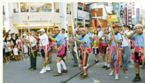
原住民部落團隊，一路上聲勢浩大，展現出青春活力，熱情銳不可擋

7月24日下午五點，有一場千人踩街的創意競賽，是由台東生活美學館、台東市公所和救國團台東縣委員會等單位聯合主辦。這場千人踩街創意競賽以台東市族群文化多元的特色，集結台東市原住民部落，並以報信的方式，由阿美族祭師祈福，宣傳馬卡巴嗨系列活動正式展開。由於各界踴躍報名參加，讓馬卡巴嗨國際觀光節慶典，更具深度和內涵。這次踩街嘉年華的活動主題名稱，為「原味新花樣」，主要的是在推廣生活美學，形塑節慶特色，提升觀光經濟的文化交流。參與的活動隊伍，將沿著鐵道藝術村的鐵花路，經過中華路一段，再沿著中正路，最後抵達活動的終點—台東市海濱公園大草原。