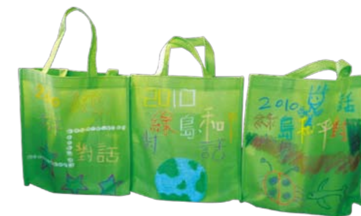
環保袋彩繪藝術季特別獎：綠島鄉公館國小