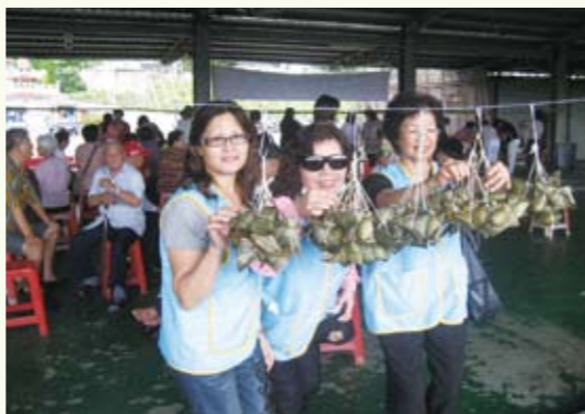
每顆粽子都包了滿滿的愛心，吃起來特別溫馨

都在粽子上，心裡想著大家一定是迫不及待想嚐嚐看了。過了一會，志工們就把一顆一顆的粽子，發給現場的每一位民眾，當他們吃了第一口，滿意的笑容說著「很好吃！」時，就是給予參與包粽子的每一個人最好的回饋！ 隨著時間的流逝，活動也即將結束。送著老人離開活動現場同時，也讓他們帶著一份不怎麼起眼的禮物。那是每一個人用了許多的愛心所包的粽子。希望失智老人能感受到我們的關懷，提前過一個不一樣的端午佳節。