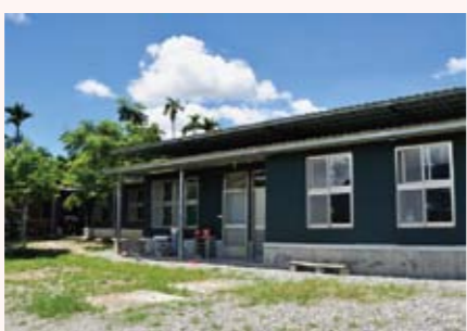
林志堅老師設計的農舍，表現簡約樸素的風格

極簡是靜謐、沉穩、樸素、簡單的美學觀，林館長舉了台東山線和海線住家及民宿的例子，整體看來這些佳作都充分運用植物來做空間美化佈置，人終究還是要跟大自然為伍，在冷硬的建築中，利用植物的綠化美化來平衡視覺空間，更能為我們的心靈更添幾許的生機。生活的自主性來自於平常中去體會樂趣，漸漸的成為自我生命中的主人，而不是受命運來支配。物質的生活充斥其中，藉以保持適度置之感才能更懂得珍惜目前所擁有的幸福，聖嚴法師曾經說道：「需要的不多，想要的太多。」生活不是理論，而是用心實踐，才會發現生活美學中的道理。