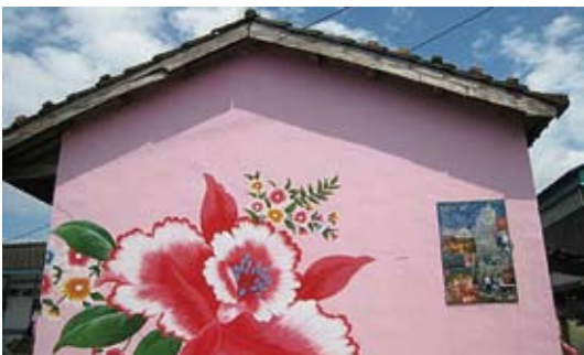
原來阿嬤ㄟ被單也能這麼的美！一種溫暖而又貼近的感覺正在這村莊悄悄的蔓延

房子，花費一番心力終於蓋了一間傳統的牛棚，而附近居民看到剩下的水泥，覺得可惜，就隨手用水泥做了幾隻牛放在旁邊。接著又有居民心血來潮，把穀倉的稻草也編成牛、豬等造型。漸漸的，這間牛棚加上水泥的牛和稻草的牛，形成極具創意的景點，慢慢的有不少遊客到此一遊，人多熱鬧了，社