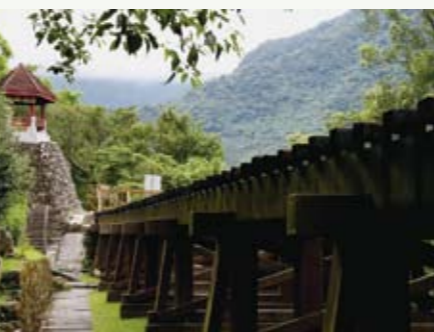
林田山用來運材的森林鐵道，依舊洋溢古樸情懷

位於鳳林鄉的林田山林業文化園區，行車時間從花蓮市區到林田山約1小時。地理位置在萬里溪以南馬太鞍溪以北的河谷地，日據時期在萬里溪發現溫泉，將泉水引出修建旅社經營管理，到民國28年開始採探紙漿原料，開啓了林業之始；屬於台灣