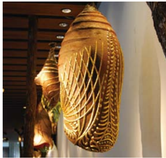
石門水庫的淤泥，化身為繽紛「蝶蛹」陶藝創作

執團隊的巧思包裝下，獲得由「經濟部中小企業處」所舉辦的2010年「台灣OTOP (One Town One Product) 設計大賞獎」。並由馬總統與行政院長吳敦義等人在八月七日「八八風災」週年紀念活動中，共同將唐鴉捏製的大型祈福陶偶自淤泥中取出。