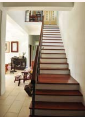
白色、褐色和簡單的造型搭配營造乾淨清爽的風格

「極簡主義」是第二次世界大戰之後60年代紐約所興起的一個藝術運動，以最原始的物，自身或形式展示於觀者面前的表現方式，意圖消弭作者藉著作品對觀者意識的壓迫性，簡單來說也就是一種奢華與繁複造型之後反思性的追求。極簡美學強調理性、直線、幾何、對比等形式，與東方禪學及南島民族的原民藝術不謀而合，在東方也能被接受，並廣泛的應用於藝術、文學、建築、及生活實用上，因此無論在任何地方都有極簡主義的身影。