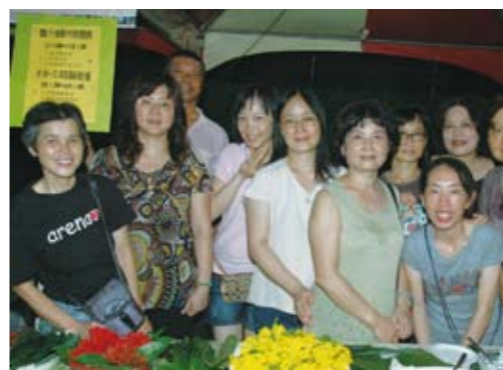
醬汁班分享時的快樂容顏，萬花叢中一點綠囉

八月二十一日，是台東生活美學研習班的成果發表，集結手創工藝、美展、佳餚與音樂晚會。之前還擔慮熱帶低氣壓將形成輕颱，干擾活動進行，我們「生活就要醬汁」這一班，面對青蔬魚肉的採買，憑添了一層猶豫。