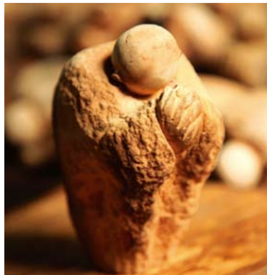
300件「祈福小沙彌」泥偶

唐鴉從去年十一月起至今年八月底，花了將近十個月的時間，總共捏塑了888件祈福泥偶，此作品經由名設計師彭喜