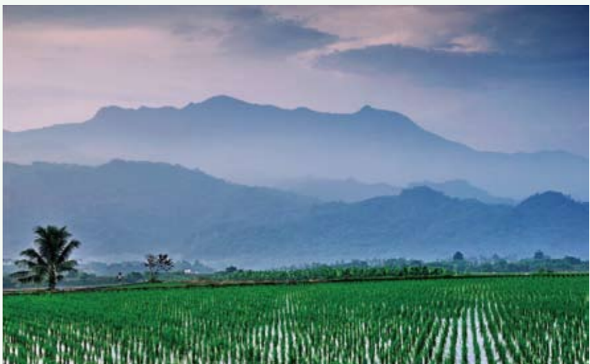
都蘭山遠遠蒙在藍紫色的霧靄裡，底下的平原恢弘遼闊

最後，吳炫三期勉大家，在旅行中，必須虛心接受不同的文化，懂得欣賞與品嚐世間的一切，才能真正得到學習跟快樂，心靈生活也會變得豐富，當然除了要享受心靈的成長之外，更要顧好自己的護照、錢、機票等物品避免遺失，免得影響了自己的行程，旅行的成果也會大打折扣。