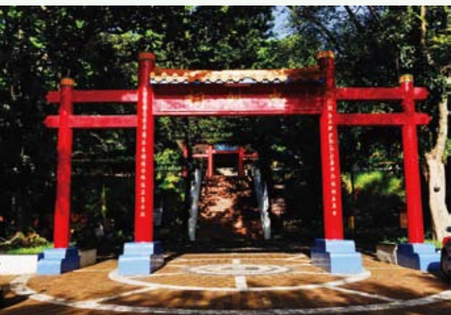
鯉魚山，像個讓人隨意走走散心的公園