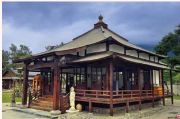
慶修院，古樸素雅的佛寺建築，還融合日本神社的建築語彙，氣氛靜謐，禪意十足 攝影/楊安生

以台灣檜木為主結構的大坂式建築。四面牆壁以「竹筋」或土磚外塗穀殼混凝土糊成，雖然使用的建材簡單卻十分堅固，歷經無數颱風、地震、豪雨的侵襲，仍然屹立不移。菸樓後方還有一段石牆，是以生態工法砌築，與菸樓共存共榮，展現客家文化的特色。