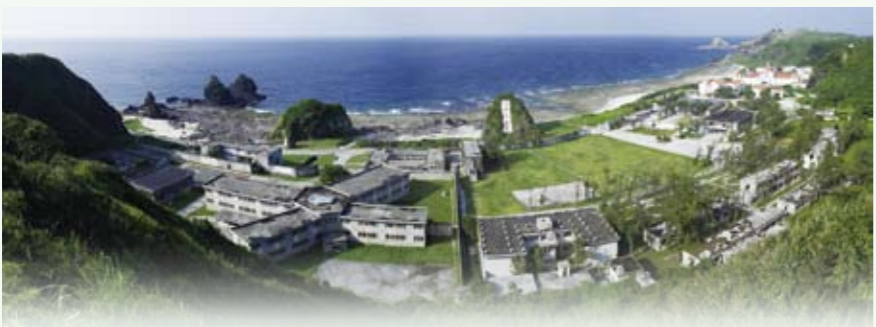
綠島人權文化園區鳥瞰全景

來自沖繩3位和平相關博物館館長，於8月30日參訪綠島人權文化園區，與園區第二梯次工作坊學員座談，溝通歷史經驗傳遞給觀衆的課題。自5月以來展開 2010 人權園區藝術季，國際交流是最後的重要活動，雙方以人權、和平為主題對話，展開博物館有關觀衆溝通的議題。黑潮文化是連結沖繩與綠島的自然、歷史、人文連帶關係的樞紐，帶來彼此親近的情感和激發互相關懷的心意。