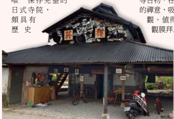
蕭家菸樓，被定名為「菸樓文化館」，成為當地文化及重要人文古蹟據點之一

特色的人文空間。於日治時期為吉野移民布教及心靈療養之所，台灣光復後被閒置了二十餘年，殘破不堪，迄民國六十八年獲列為國家三級古蹟，於九十一年進行修復工程，重現當年風華。庭院內尚保存既有的手水舍、百度石、光明真言百萬遍石碑、八十八所石佛廊道、不動明王石雕像等古物，在清幽的環境中散發著悠遠的禪意，吸引國內外許多遊客前來參觀。值得一提的是，遊客入寺參觀膜拜之前，須先到手水舍以木杓取水淨手、潔臉、淨身，雖然只是表象的動作，但從「回到內在」的觀點觀察，這是一項使心情轉折的極佳關鍵。我們的心若能在適當的時機轉折改變，很多事情會變得不一樣。