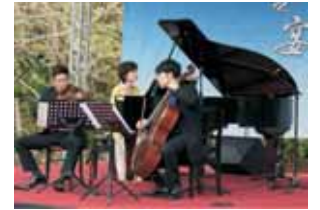
小提琴、大提琴、鋼琴三重奏的悠揚樂音飄盪在利嘉國小校園內。