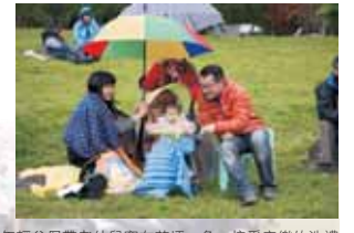
年輕父母帶著幼兒窩在草坪一角，接受音樂的洗禮。卡「夢」，我們要一直做下去！