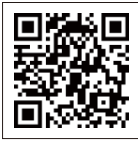
FB Messenger 語音導覽