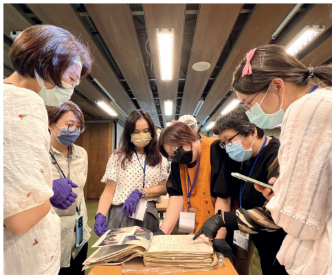
圖7 與會高中老師對芥菜種會收藏的資料深感興趣。