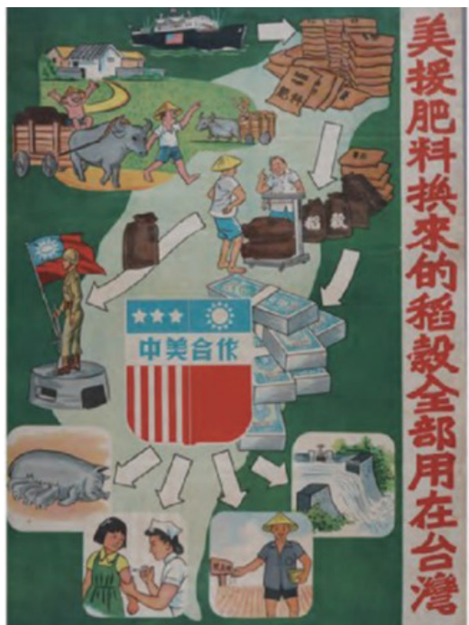
圖5 農復會新聞處編印「美援肥料換來的稻穀全部用在臺灣」海報。

臺灣於1951-1965年間接受美國經濟援助，美援絕大部分比例用在軍事援助，一部分投注於基礎建設，旨在穩定臺灣社會經濟情勢，並有小部分用於人道的物資救濟。此外，美國為解決國內農產品過剩問題，1954年通過480公法法案進行國際性的貧民救濟工作，特別跨過政府的行政系統，指定要由基督教組織來發送救濟物資，發放重要營養補充品脫脂奶粉的牛奶站也因應設立，並由教會發送麵粉；在美援及480公法法案的支持下，屬基督教組織的芥菜種會得以將資源轉運至臺灣偏遠、交通不能及的困頓之處。