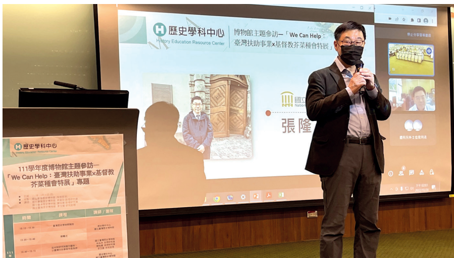
圖1 國立臺灣歷史博物館張隆志館長向與會的老師介紹臺史博新計畫內容。

張館長接著介紹扶助事業特展的特別之處。臺史博在過去策劃各式各樣的展覽已超過70檔以上，但這個特展的內容性質以及準備的難度是一個新挑戰，藉此機會邀請老師們跟策展團隊面對面交流，進而瞭解策展甘苦談跟心