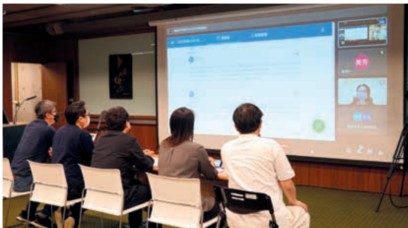
圖6 「典藏·典常—典藏管理論壇」場次一討論現場。