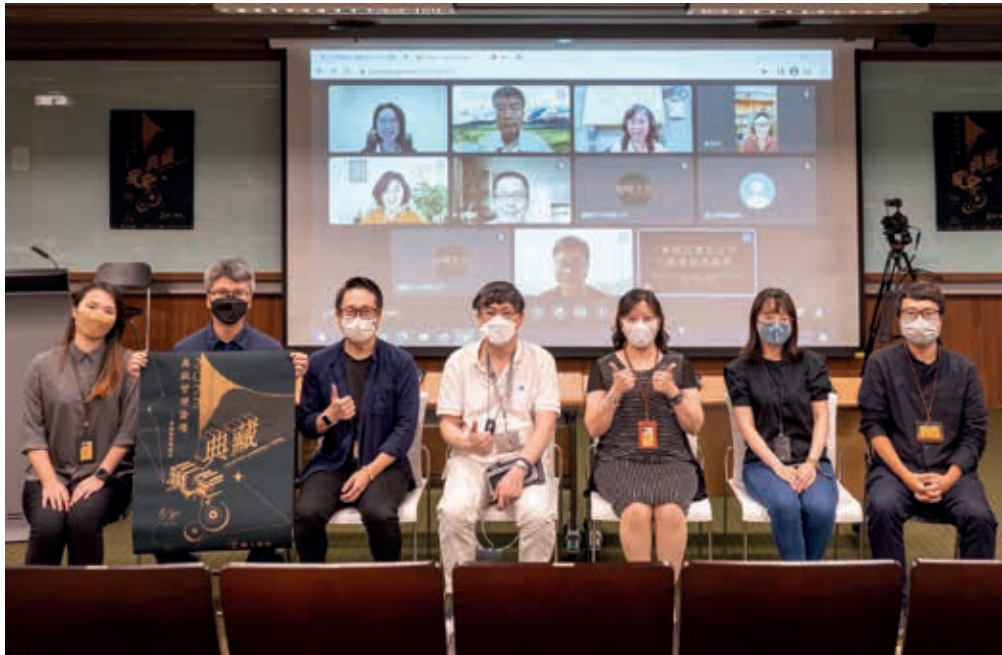
圖12 論壇承辦單位與參與成員於線上線下合影。