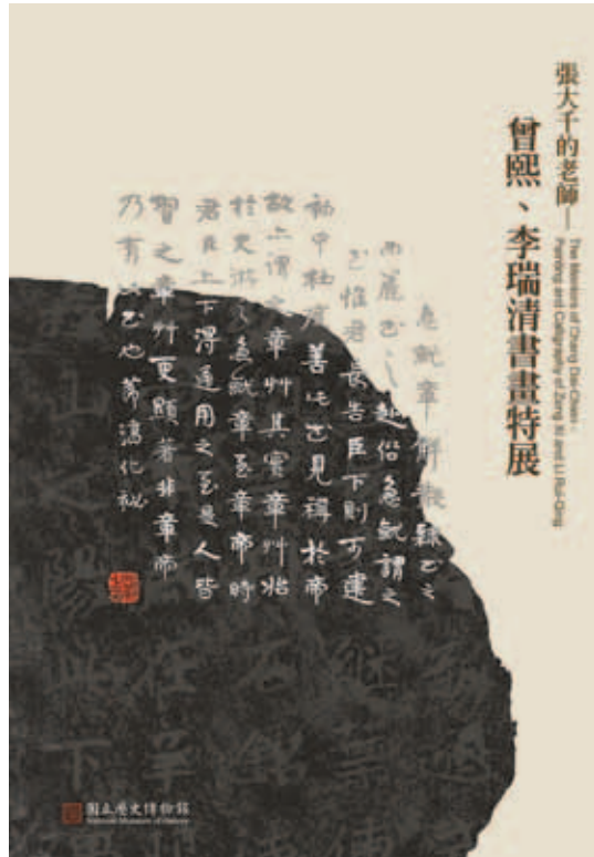
張大千的老師——曾熙、李瑞清書畫特展圖錄封面