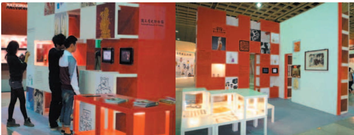
本館「臺灣國際文化創意產業博覽會」會場攤位

本館參與由文建會於99年11月11日至14日在世貿南港展覽館舉辦之第一屆「台灣國際文化創意產業博覽會」，本館以「館藏資源」、「讓歷史活起來」、「產業加值」及「行銷推廣」等四單元，展現史博館有利推動文化創意產業的豐沛資源，並推廣本館的品牌形象。