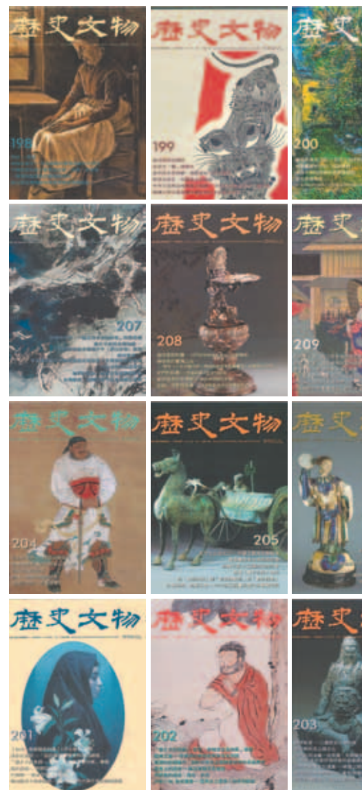
九十九年度《歷史文物》月刊封面