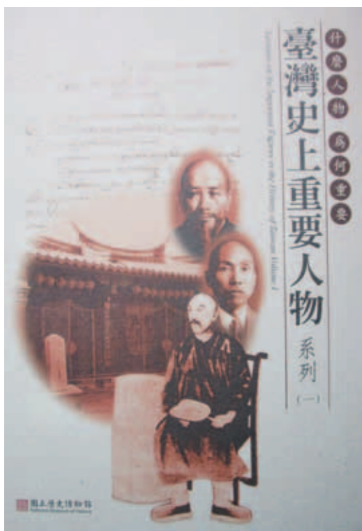
臺灣史上重要人物論文集