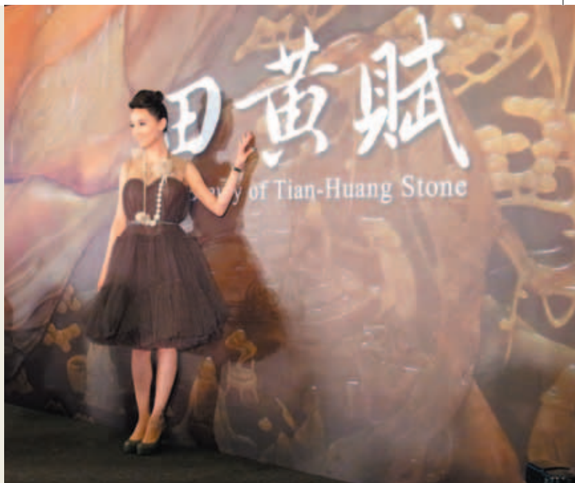
「田黃賦—百方田黃珍藏展」開幕