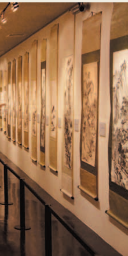
「朱龍鑫 105 歲書畫紀念展」展場一隅

「海報」於台灣的發展自日治時期即開始，一直發展至今，欣逢中華民國建國百年並適逢 2011 台北世界設計大會的舉行，本展特別邀請全球設計名家提供經典海報以共襄盛舉。此展在台灣不論是規模及水準均為難得一見之海報設計特展，藉由本館國家畫廊之展出，相信對推動台灣海報設計之發展，將會有相當大之助益。本展覽將包含三個子題，從「歷史／百年台灣海報文獻展」，介紹台灣海報發展史及台灣經典海報；到國內外設計大師以文化、藝術、博物館為主題所策劃之「文化／全球名家文化主題海報展」、加上集結 IDA 設計大會海報徵選作品所規劃之「交鋒／2011 IDA 台北世界設計大會主題海報展」。意在從這三個部份完整呈現台灣海報設計的過去與現況，及與世界接軌的事實，期望藉由設計大師的作品，來增進社會大眾對海報設計藝術的了解。