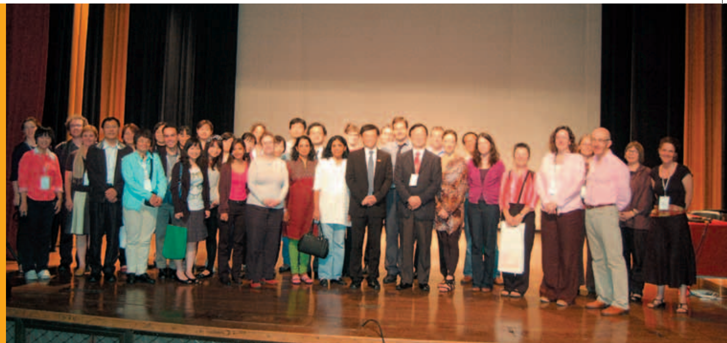
來自 25 個國家的博物館學專家、學者及資深人員共同參與「博物館 2011 認同建構：國家博物館與認同政治」國際學術研討會