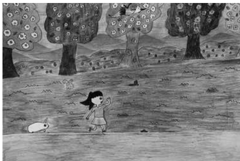
圖13 《沉沒的村落》內頁