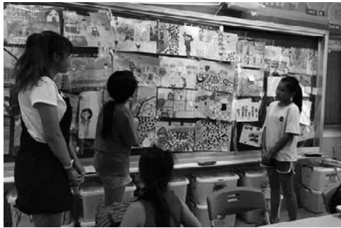
圖11 學生介紹繪本內容