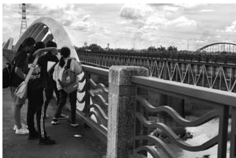
圖8 走讀曾文溪渡槽橋，瞭解新舊之間的差異，與舊渡槽橋成為文化資產的關鍵要素。