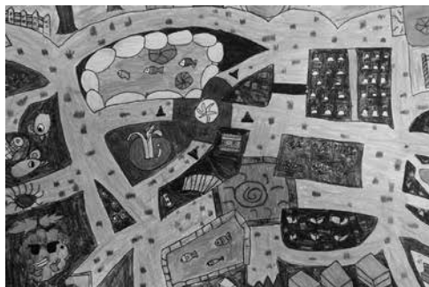
圖14 《搶水大作戰》內頁