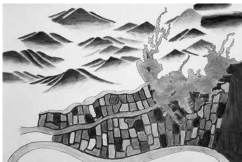
圖15 《我玩，故我在——官田之美大發現》底圖