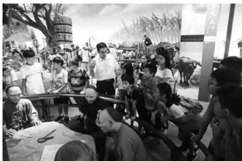
圖2 國立臺灣歷史博物館二樓常設展