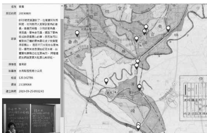
圖9 「惜水敬地愛人：尋找水圳人文生活印記」GIS地圖

學生透過地圖敘述地方與水圳相關的故事，同時藉由故事協作平臺學習科技運用，透過疊圖穿越古今，在不同時空中進行知識交流，與當下生活情境對話產生意義，讓地圖更爲生動立體。在歷史人文與科技應用並進下，在生活中獲得應用與實踐，所採集的故事素材陸續擴增GIS地圖標的，期盼能呈現出嘉南大圳全域人文歷史。