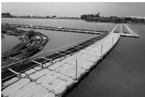
圖7 瓦寮埤增設太陽能板種電