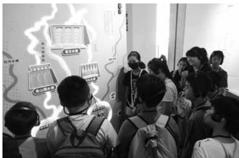
圖1 「誰主沉浮——水文化在臺灣」特展

通，同時學會如何看展，試著理解一張紙、一個展示品背後想傳遞的故事，慢慢培養出解讀展覽及親近展覽的能力。