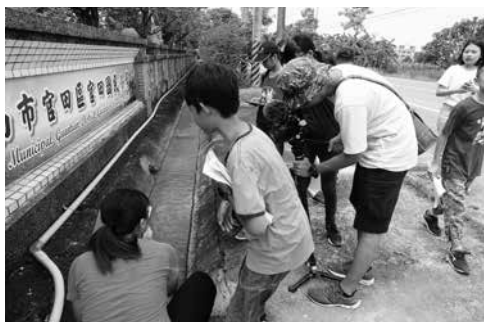
圖3 學生觀察記錄官田國小旁的嘉南大圳水路

官田區水圳埤塘居臺南市之冠，透過田調採集掌水工和偷水賊搶水的案例，菱農口述和水雉共好的故事，走讀踏查承載水圳歷史的渡槽橋、蘊含水文化的埤塘、拜訪在地守護神，瞭解因嘉南大圳議題延伸出的祭典活動與遷村經過。在室內針對五大議題進行授課，建構學生基本認知。思考五大議題設定的核心內容，擬定訪題採訪專業人士解惑，走出教室實地踏查，訓練觀察力與學習如何記錄。