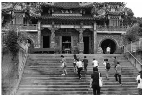
圖4 拜訪因建造烏山頭水庫而遷廟的雙鳳宮