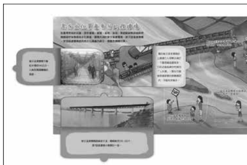
圖16 《翻閱，渡槽橋》內頁