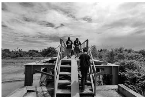
圖6 踏查鋼構龜重溪渡槽橋