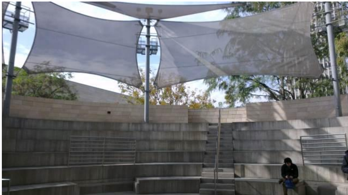
音樂廳戶外劇場，國內真快樂掌中劇團與廖文和布袋戲團均曾受邀於此場地演出，可容納 700 餘位觀眾，適合辦理親子節目與教育推廣活動。