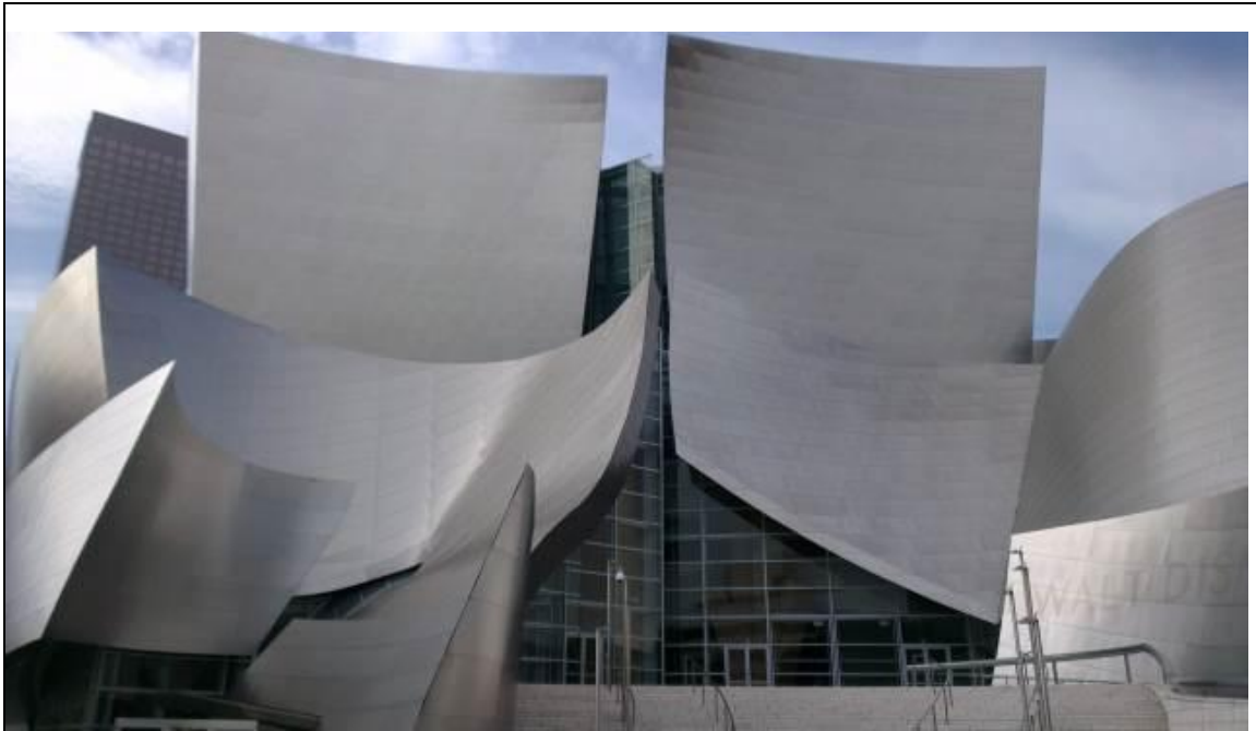
音樂廳外牆凹凸曲線之不鏽鋼牆面