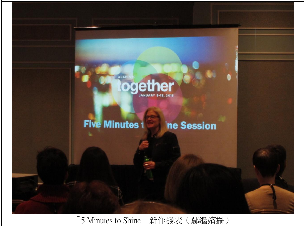
「5 Minutes to Shine」新作發表