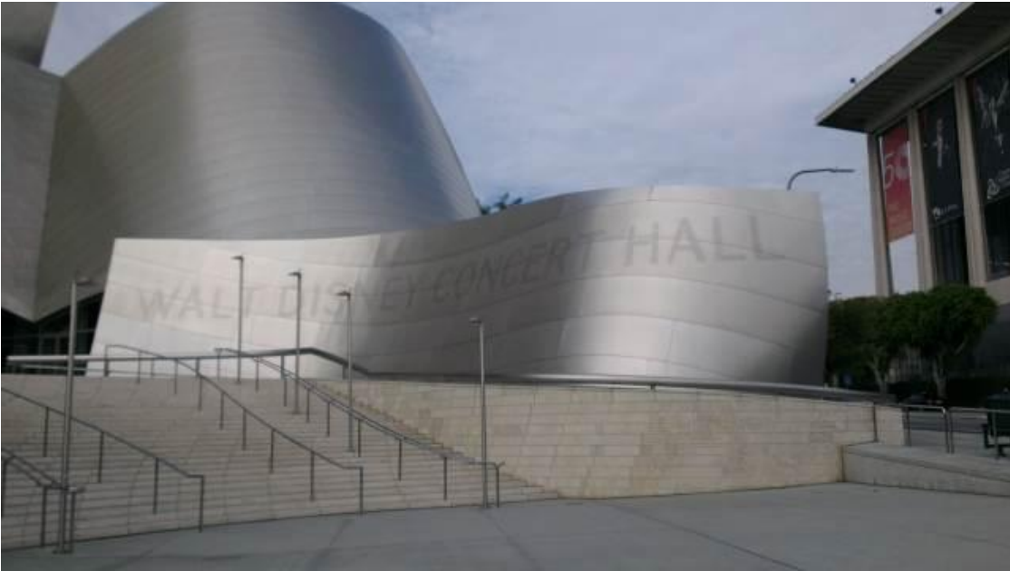
華特·迪士尼音樂廳