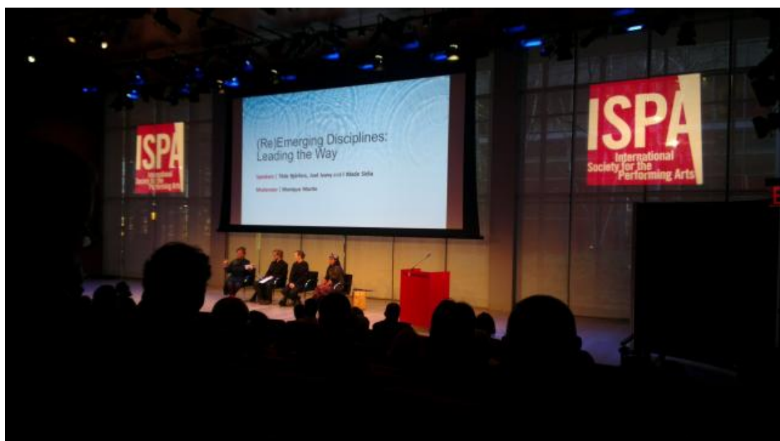
於時代中心舉辦的第 6 場座談