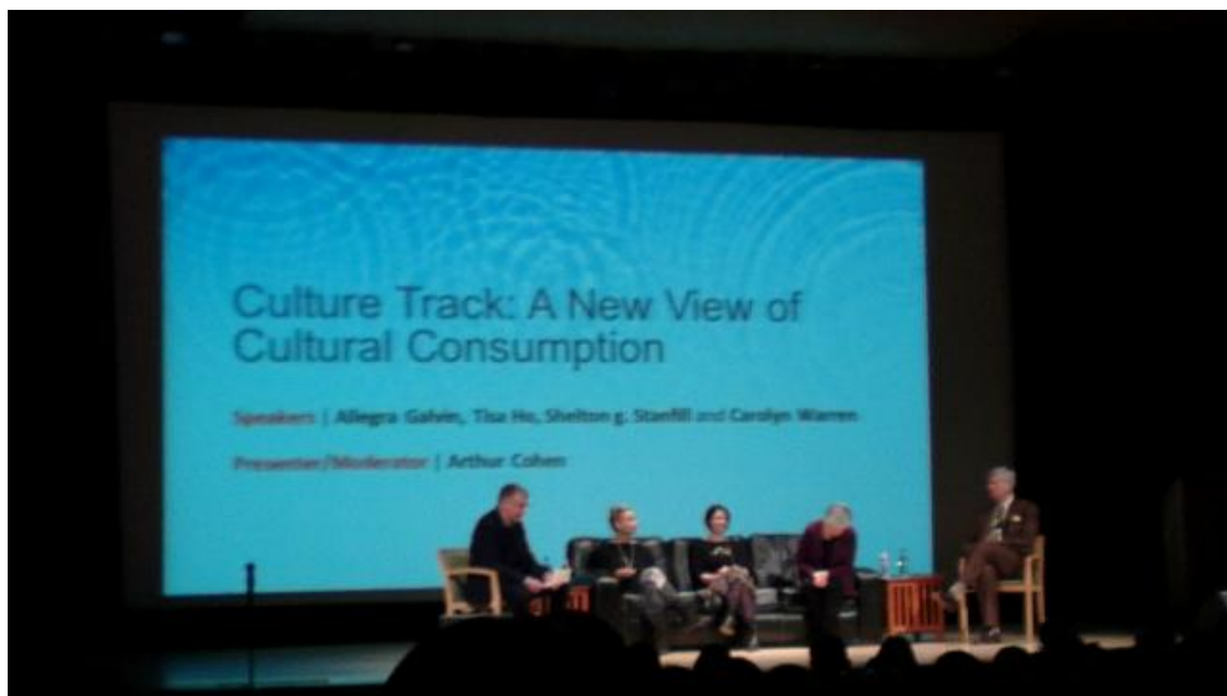
於大都會博物館舉辦的第 2 場座談