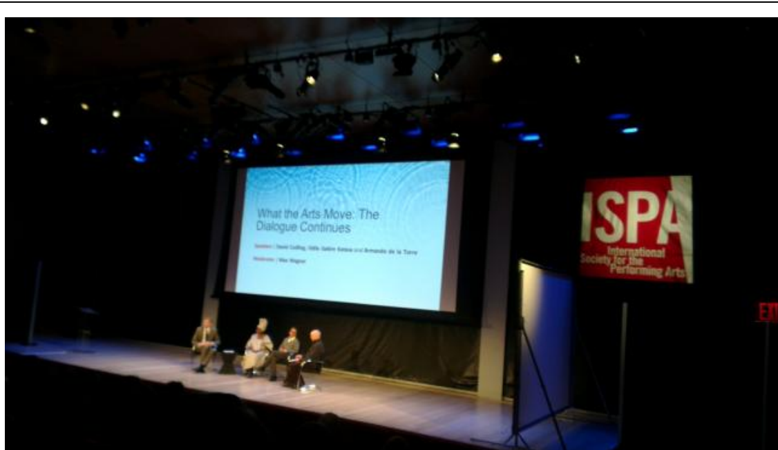
於時代中心舉辦的第 5 場座談