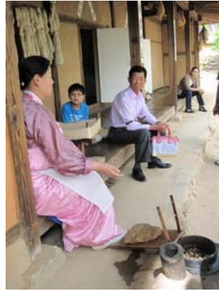
傳統婚禮及抽蠶絲示範