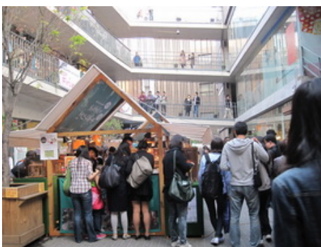
包袱街與中庭個性小鋪