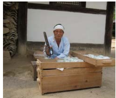
電視劇「大長今」場景供合影留念、賣糖炒栗子大嬸及拿大剪刀叫賣米飴的大伯