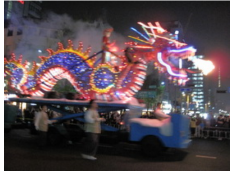
大型燈具「佛祖與象」及「龍燈」