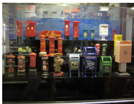
朝鮮時期郵差暨韓國各時期郵筒演進