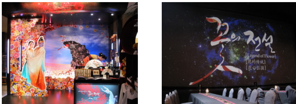
「花的傳說」紀念品小鋪及劇場一隅

目內容結合韓國傳統舞蹈（如：農家樂）、音樂、打擊樂，以及傳統慶典（如：婚禮、豐年祭）外，同時更納入韓國跆拳道與街舞的精彩對決、傳統走繩特技，在硬體設施方面，劇院裏設置發散香味的電子裝置，使劇場內瀰漫著濃郁花香，並運用清晰生動栩栩如生的 3D 立體畫面，打造震撼人心的感官世界。因此在 120 分鐘的演出觀賞中，即可將韓國傳統慶典、樂舞雜技、及電子科技技術讓觀眾一覽無遺。