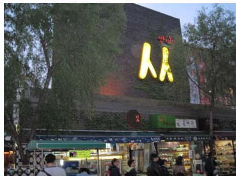
仁寺洞街景及古董書畫店