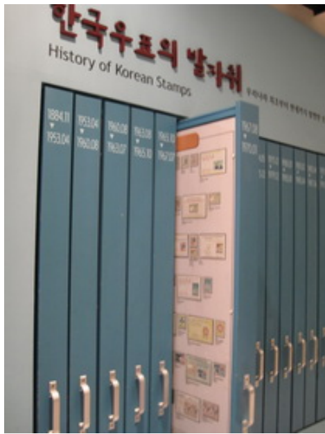
韓國郵票歷史展示櫃