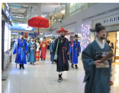
「王室散步」傳統表演

專為傳承和普及韓國傳統文化、促進世界非物質遺產發展的韓國文化財保護財團，於仁川國際機場 3 樓出境區提供待機或轉乘的外國人士，除可觀賞定時於 3 樓有韓國傳統宮廷隊伍遊行外，並於該樓層四個傳統文化體驗館提供外國人士韓紙拓印吉祥畫、草編福筴籬（幸運物）、韓國傳統服飾及傳統遊戲等免費體驗活動。