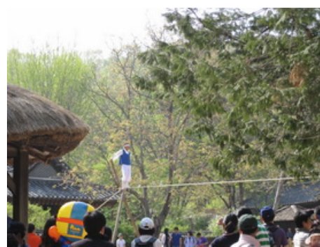
農村樂及走繩表演