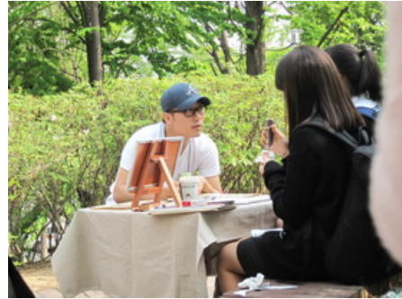
藝術市集一隅與現場人體素描