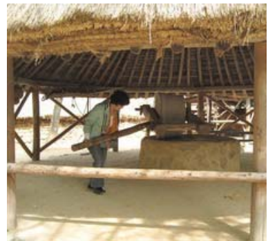
植物染、磨豆漿及推碾白體驗