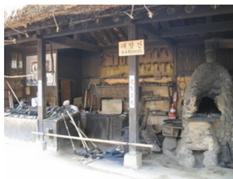
韓國民俗村大門驗票口及冶匠間(鐵工坊)