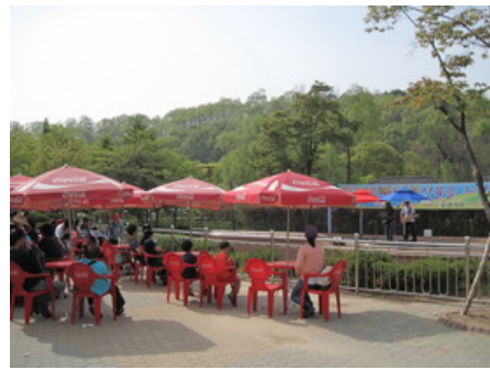
世界文化館及外國人駐唱西洋歌曲