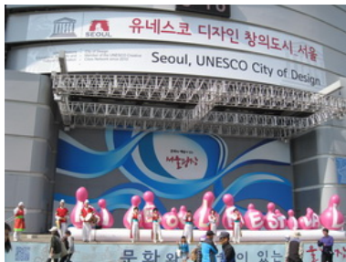
首爾文化節開幕活動