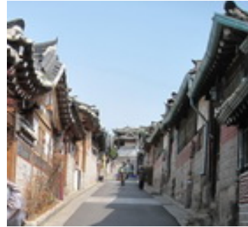
北村韓屋村建築與巷弄

三清洞緊臨北村，該區域主要是將傳統韓屋改建成畫廊、或裝潢為時尚咖啡廳、個性小鋪、特色精品店，或為一充滿鄉土味的傳統料理店等，該區域更曾被美國旅遊雜誌介紹為一條充滿藝術氣息的街道。此街區坐擁西藏博物館、世界飾品博物館、TOYKINO 博物館等三座特色博物館，顯見此區域多元文化的融合。