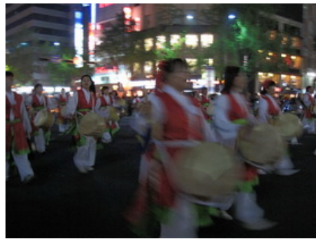
信眾遊行與傳統表演