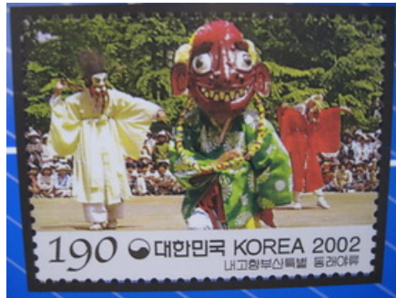
韓國傳統民俗郵票