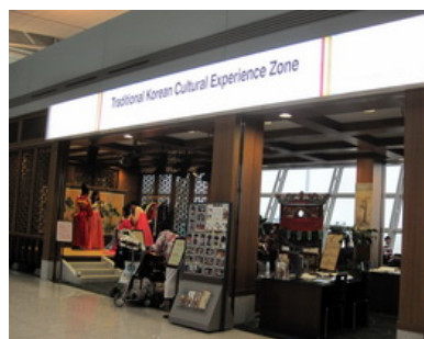
韓國文化體驗館－韓服體驗、拋球體驗