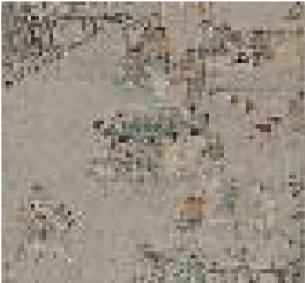
圖為平埔族先民在鹿港開墾的田寮，現已成為鹿港的觀光景點。

展件包括意象濃烈的「采風圖」風俗圖繪、重現清代平埔族群與漢族接觸之社會歷史情境的各地古文書、展現服飾文化之美的傳統服飾、風格獨特兼具線條與寫實之趣的木雕壁板等，都是頗能反映平埔族群文化風情與歷史滄桑的珍貴文物。