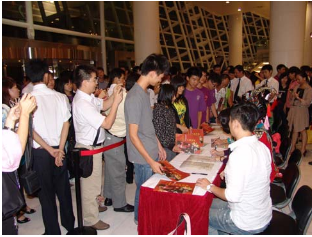
《美人尖》演出後舉行簽名會