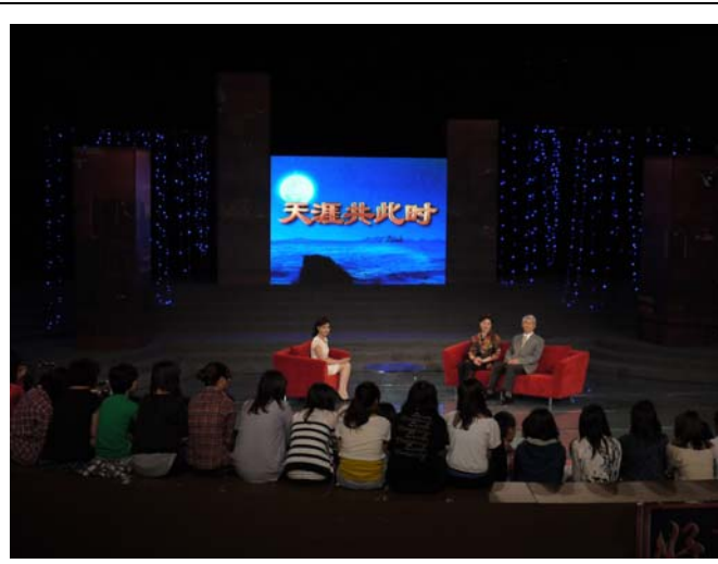
中央電視台邀請借用重慶電視台攝影棚錄影