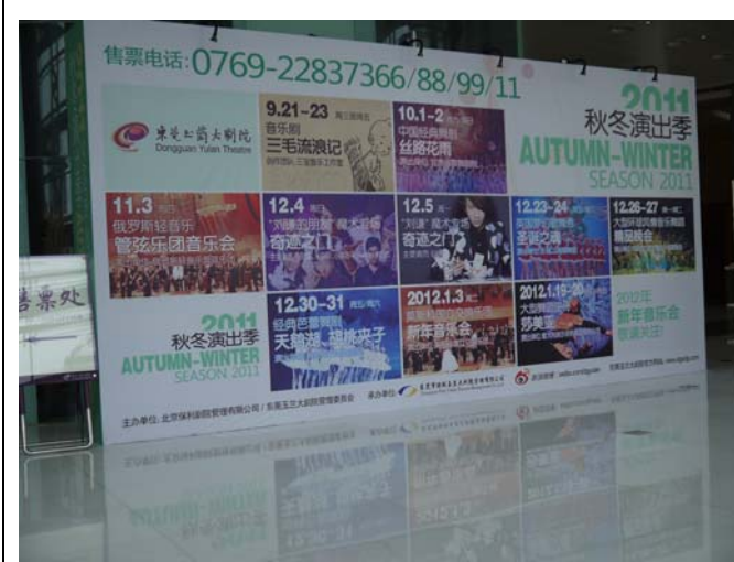
東莞玉蘭大劇院前台寬敞舒適