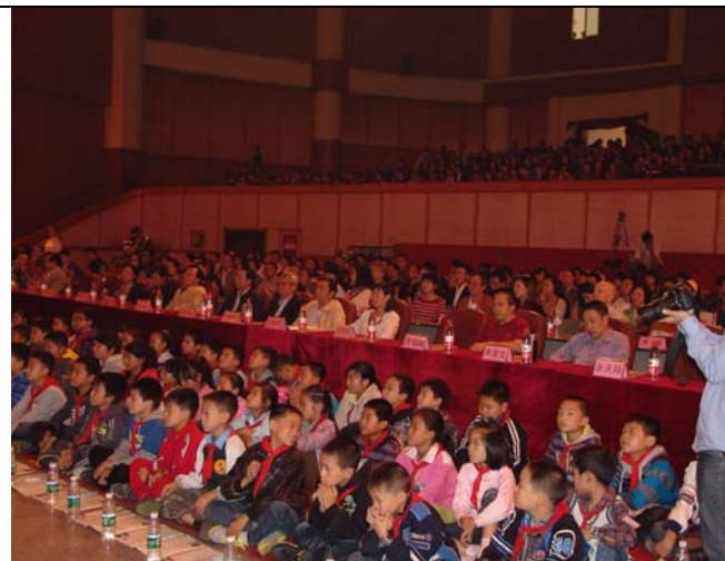
小朋友們聚精會神的觀賞臺灣豫劇