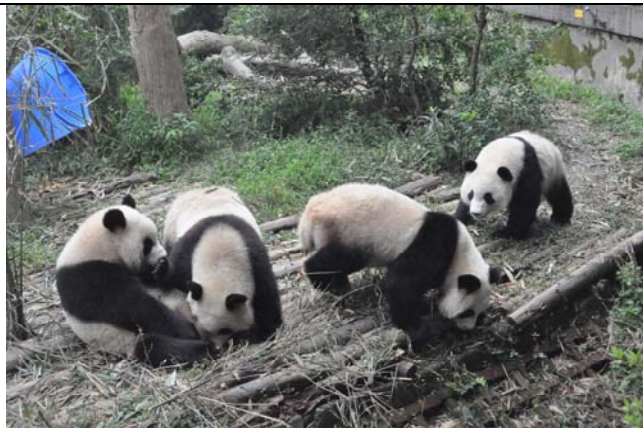
熊貓寶寶逗趣的模樣令人喜愛