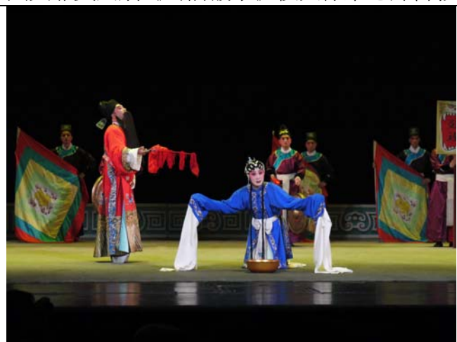
國家一級演員陳巧茹主演川劇《馬前潑水》