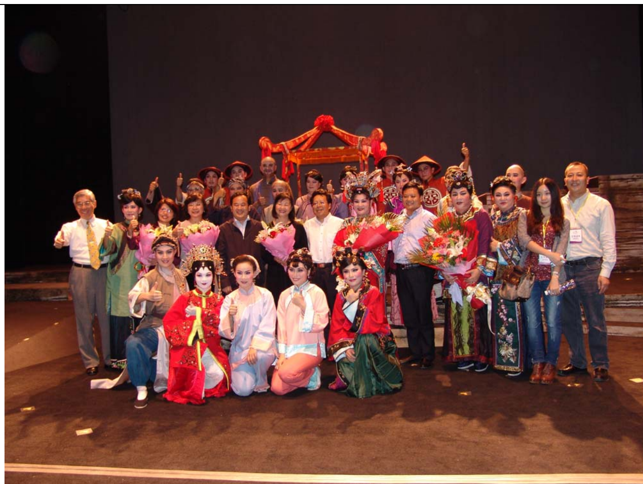
2011 大陸巡演最後一場演出於 10 月 12 日演出《美人尖》畫下美麗的句點