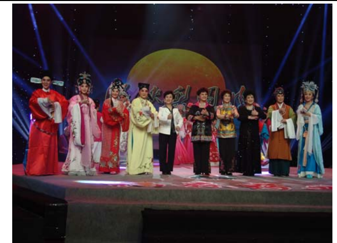
河南電視台梨園春節目收視極佳