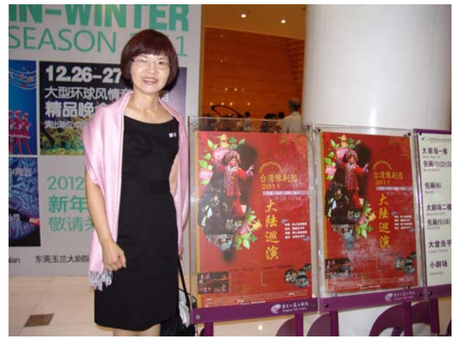
前台海報設計精美