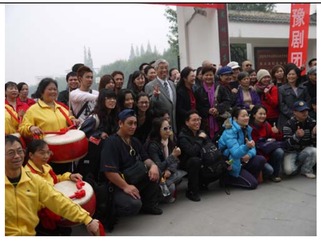
臺灣豫劇團與當地熱情民眾合影