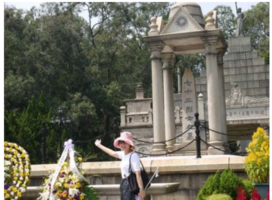
廣州市黃花崗 72 烈士之墓景點