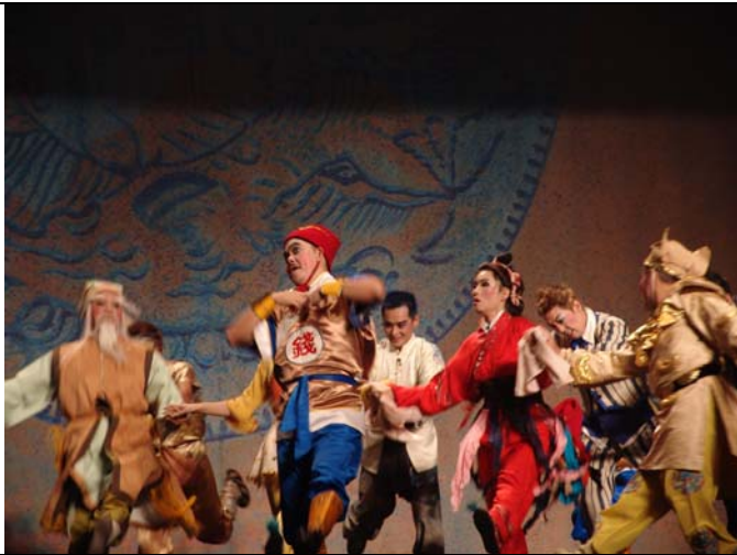
兒童豫劇《錢要搬家啦！？》演出實況