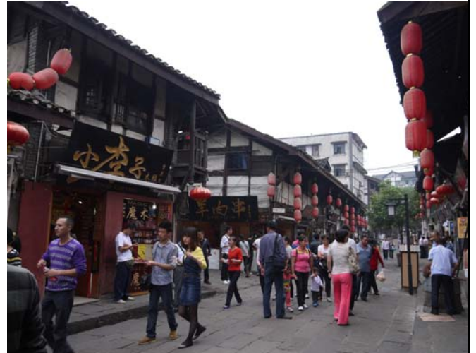
磁器口是重慶有名的觀光景點