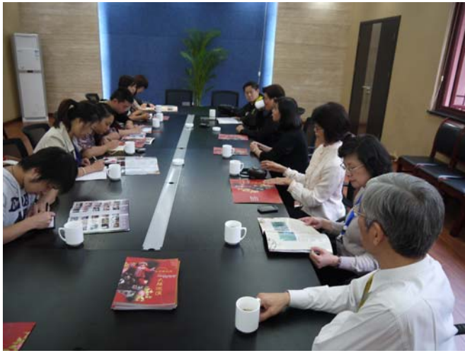
亞洲藝術節執委會安排演出前記者會