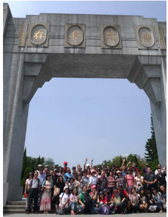
到黃花崗參觀合影留念