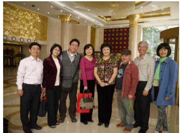
河南省文化廳張處長前來歡送臺灣豫劇團