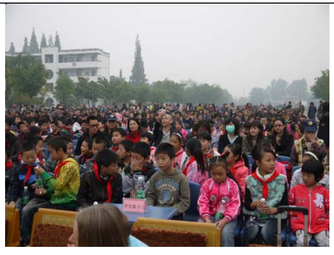
最盛大的戶外戲曲推廣講座示範演出