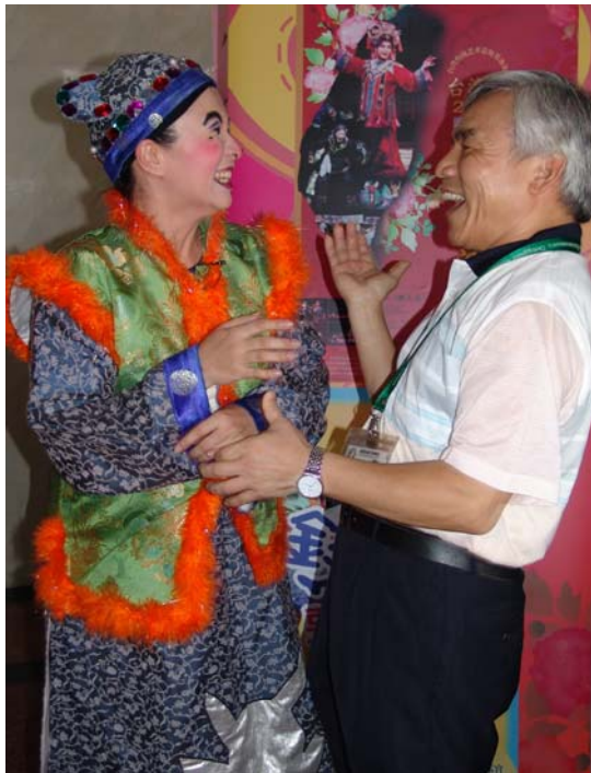
豫劇明星不止吸引小朋友連大朋友都喜歡