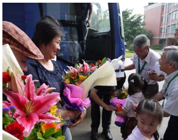
東莞台商子弟學校師生至校門口迎接豫劇團