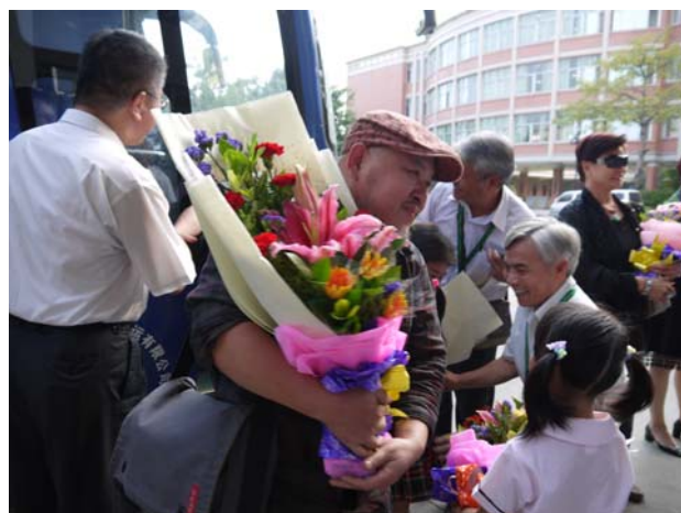
初抵東莞台商子弟學校小朋友熱烈獻花