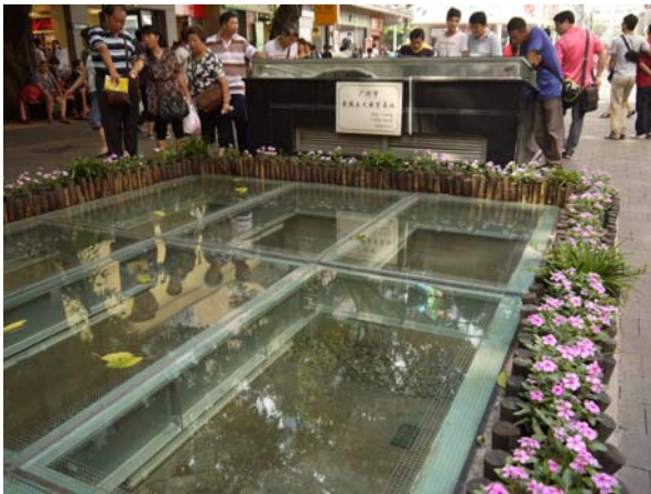
廣州市北平街著名的步行街