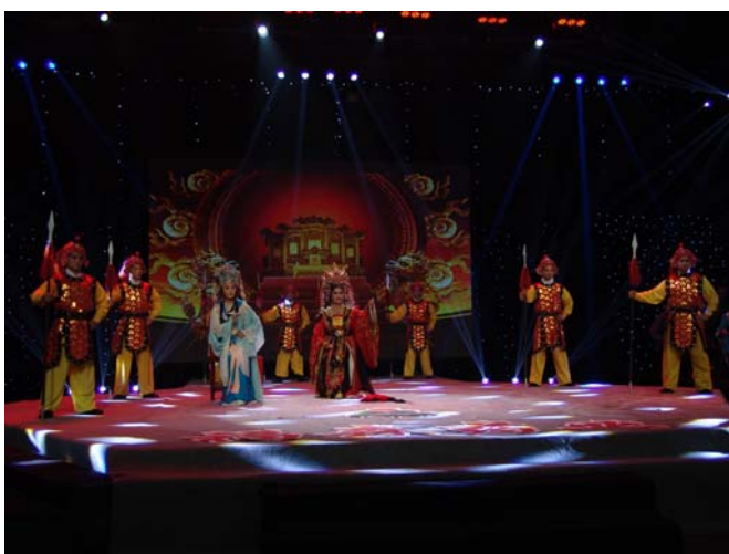
錄製梨園春電視節目-武后與婉兒