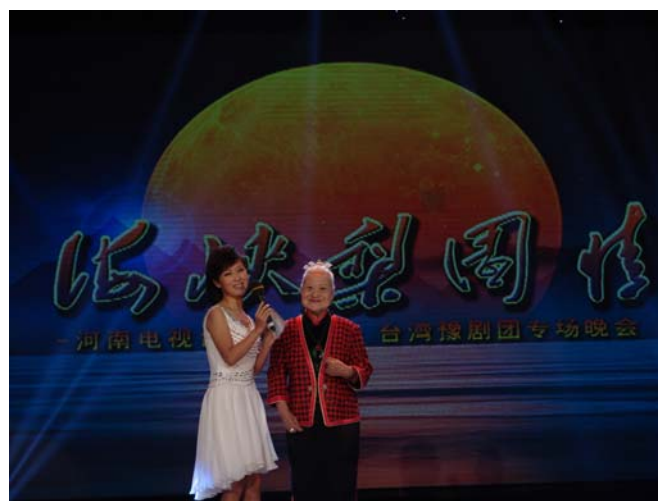
梨園春電視節目訪問豫劇皇太后張岫雲