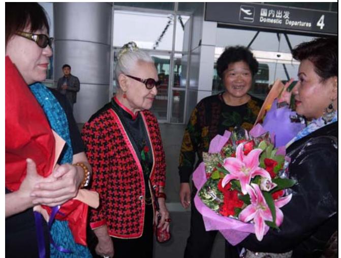
河南省接機陣仗令臺灣豫劇團團員至今難忘