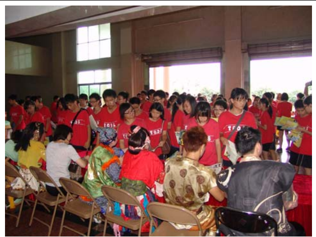
東莞台商子弟學校同學爭相參加簽名會