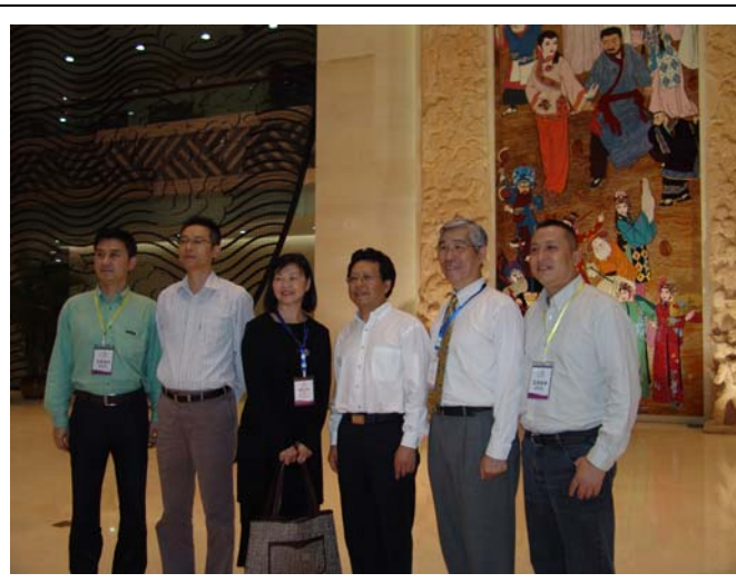
重慶川劇藝術中心前廳氣派寬敞