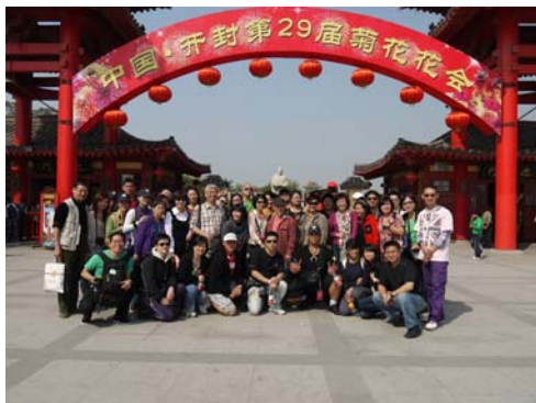
河南省開封清明上河園參訪合影