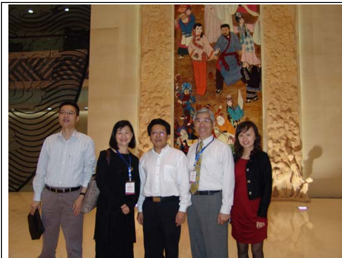
亞洲藝術節執委會成員與蘇團長韋總監合影