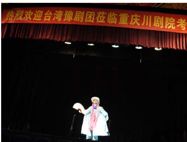
重慶川劇院青年演員交流示範「變臉」絕活