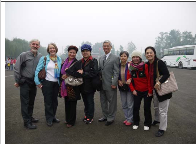
連興義小鎮的外國朋友們也慕名而來參與盛會