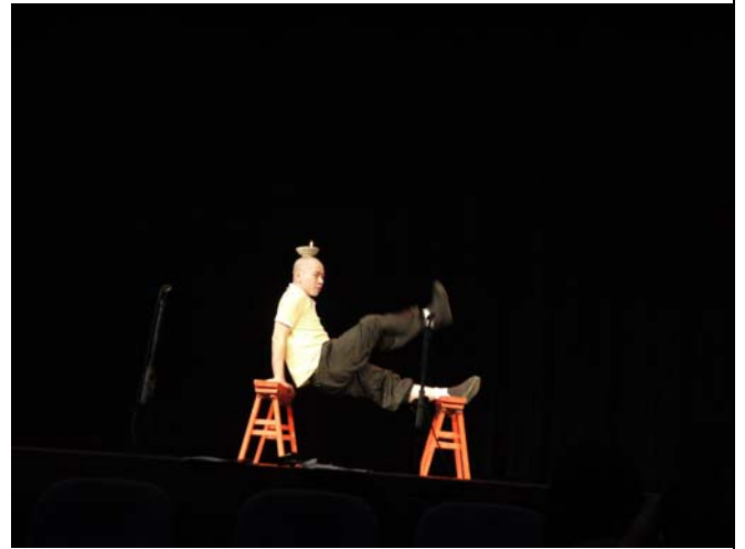
重慶川劇院青年演員交流示範「頂燈」絕活