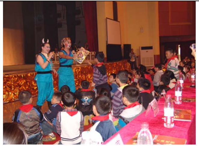
成都小朋友們對於豫劇演出十分感興趣