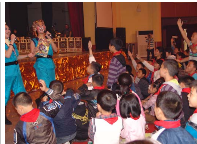
演員們與小觀眾互動場面熱烈