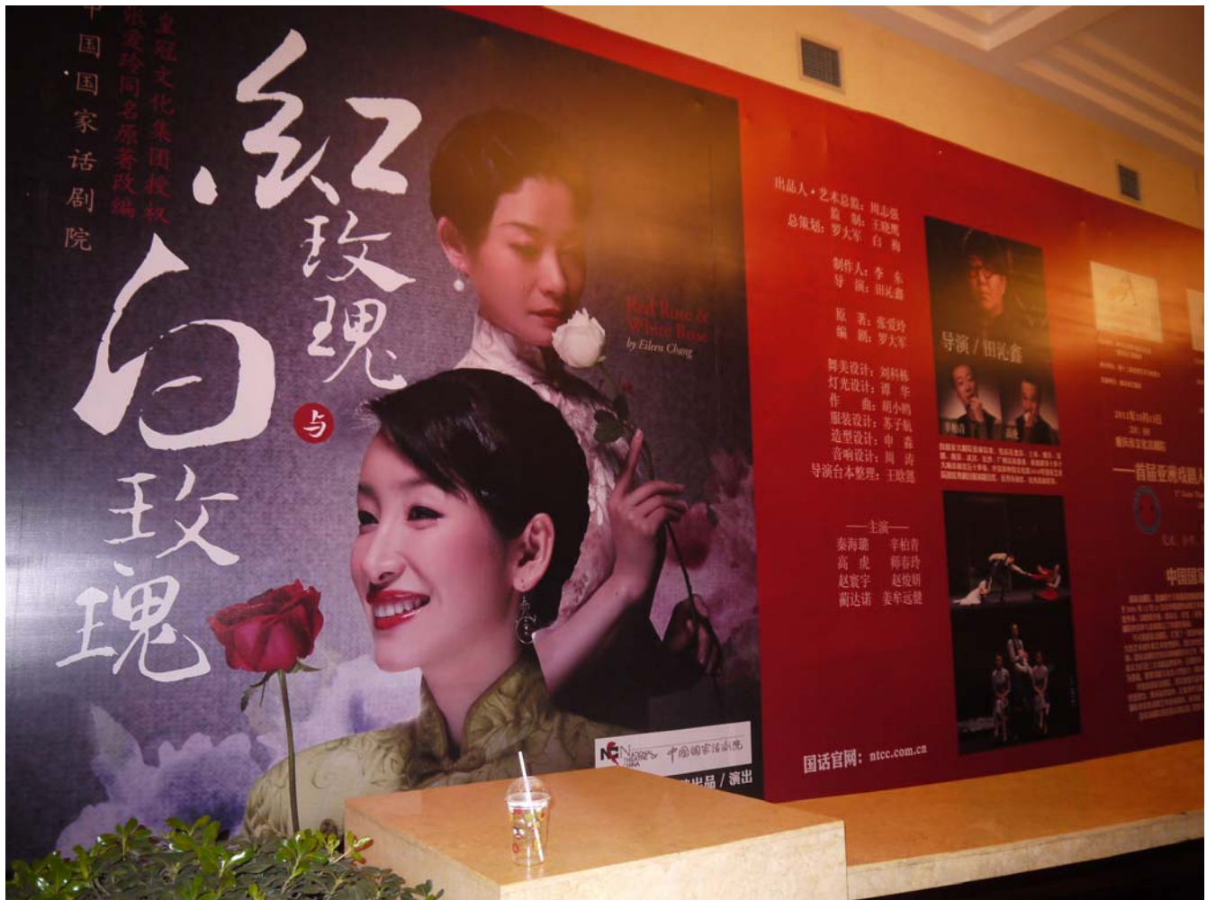
觀摩北京話劇院《紅玫瑰與白玫瑰》精彩演出