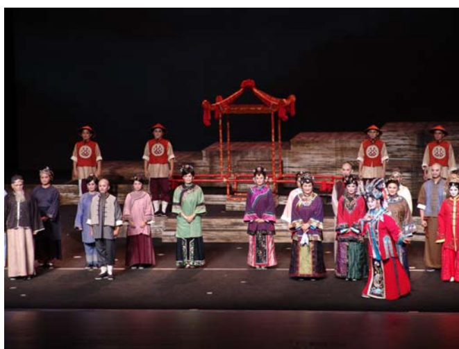
亞洲藝術節《美人尖》演出謝幕