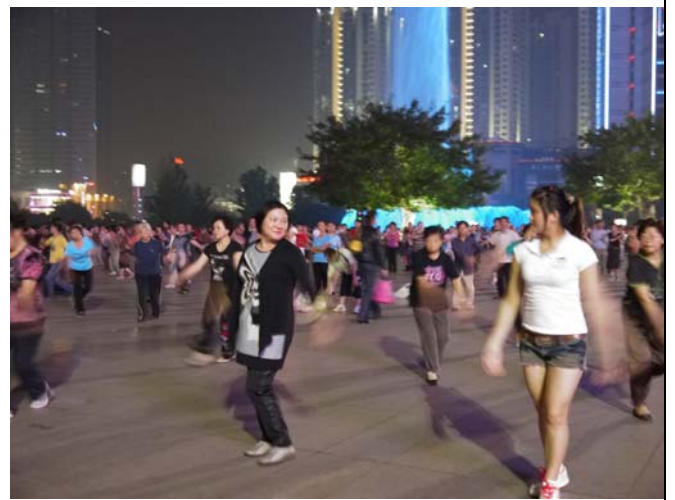
重慶觀音橋前廣場夜晚群眾聚集跳「大壩舞」