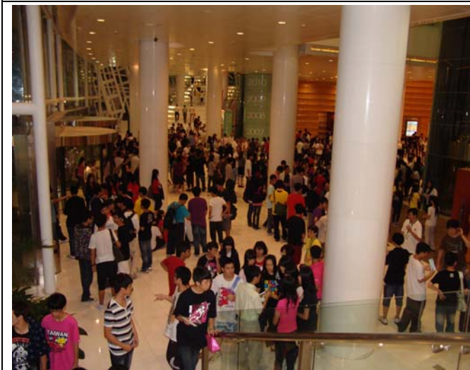
《美人尖》開演前觀眾已將前台擠得水洩不通