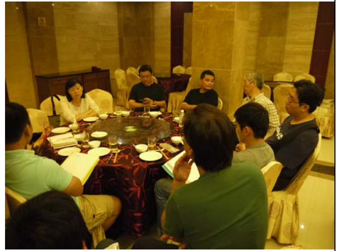
蘇團長召集各部門開會力求演出完美