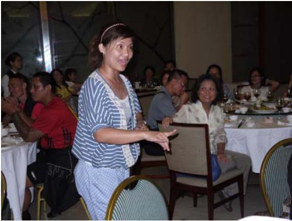
演員張瑄演唱豫劇與東莞朋友們聯誼