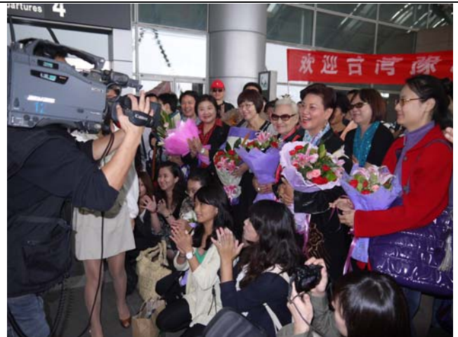
河南電視台出動採訪組熱情訪問