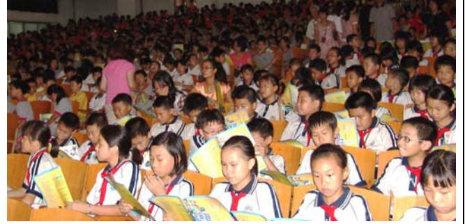
《錢要搬家啦?!》開演前觀眾閱讀節目書