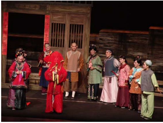
臺灣豫劇團《美人尖》極受好評