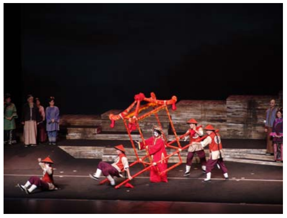
《美人尖》精彩的謝幕演出博得如雷掌聲