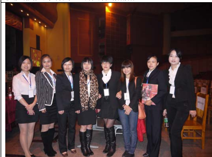
成都翔生公司接待單位美麗的工作團隊