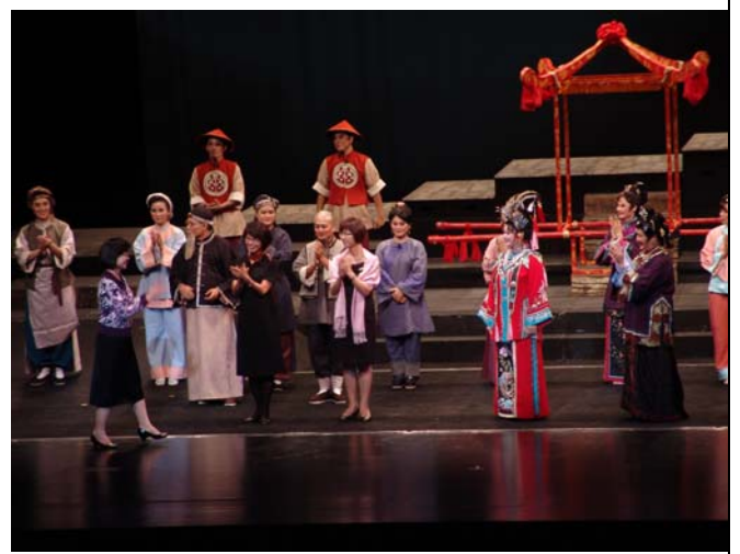
《美人尖》謝幕後介紹主創群