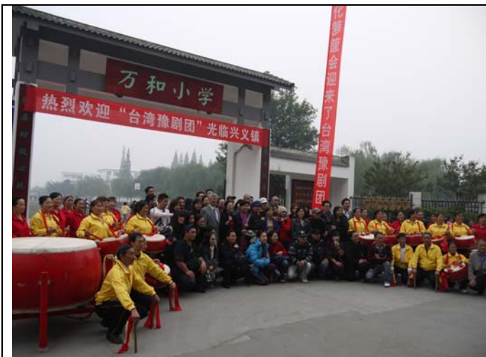
成都萬和國小熱烈歡迎臺灣豫劇團蒞校