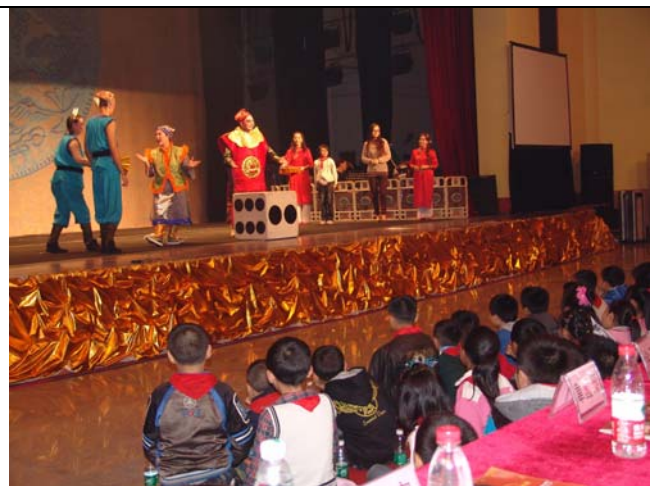
小朋友們愛極了精彩的兒童豫劇