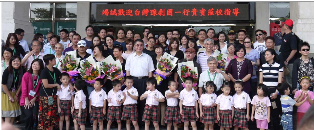
東莞台商子弟學校師生以熱情的歌聲與掌聲熱烈歡迎臺灣豫劇團蒞臨公演