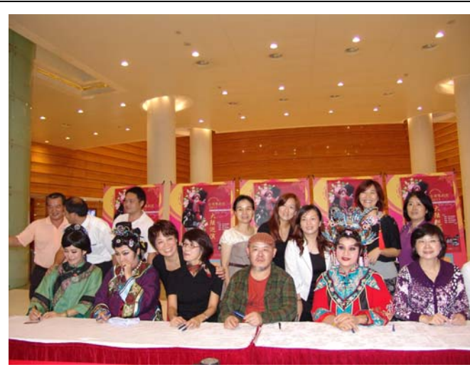
演出後的簽名會吸引眾多觀眾追星