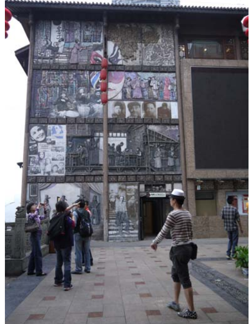
洪涯洞吊腳樓麻辣鍋極為出色生意興隆