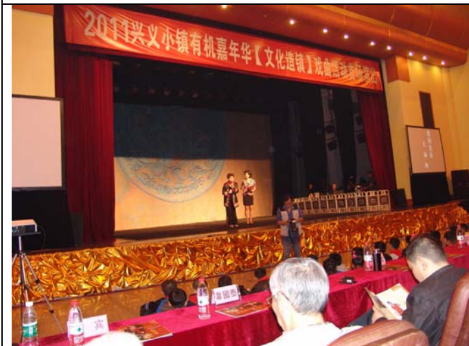
在成都演出兒童豫劇大人小孩都熱烈捧場