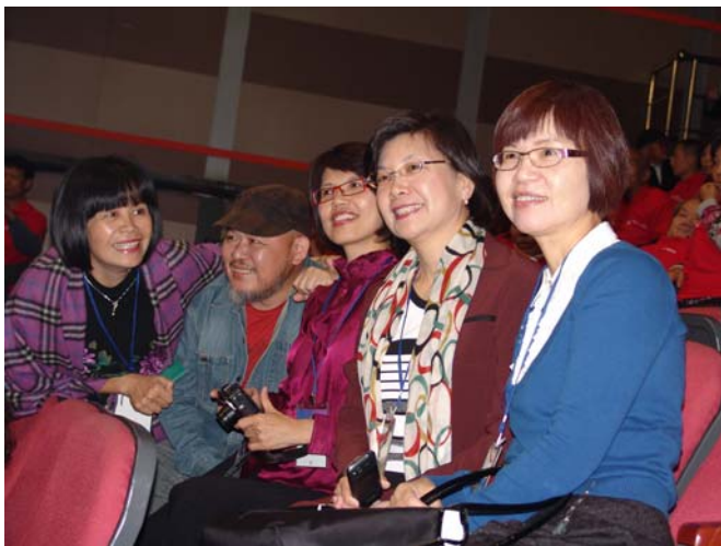
《美人尖》製作群參加梨園春電視節目錄影