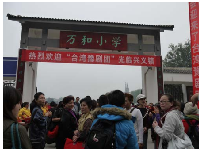
臺灣豫劇團到成都興義鎮辦理大型戲曲講座