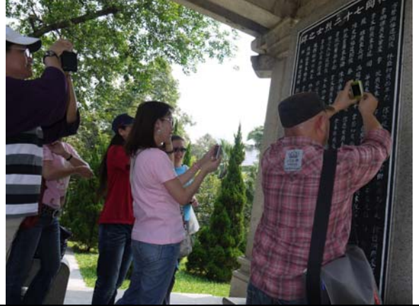
悼念黃花崗 72 烈士