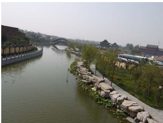
河南開封清明上河園景觀秀麗景觀秀麗