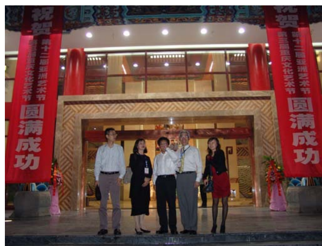
亞洲藝術節演出場地氣派輝煌