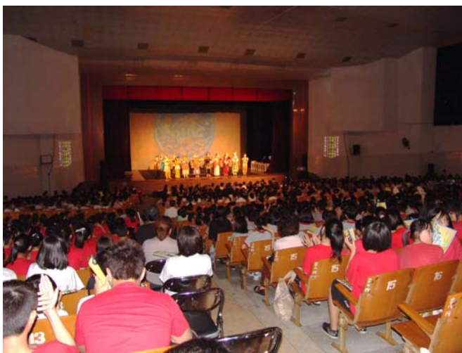
兒童劇《錢要搬家啦?!》在東莞大受歡迎