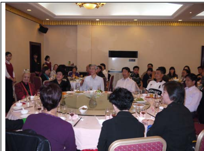
河南電視台歡迎晚宴隆重溫馨