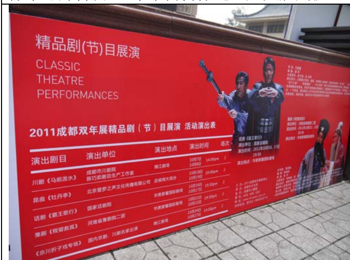
川劇《馬前潑水》在成都演出相當受歡迎