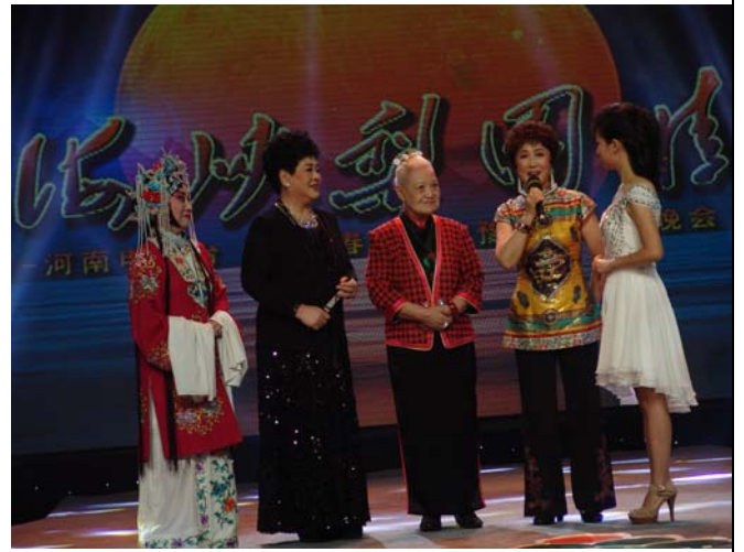
梨園春電視節目訪問當今兩岸豫劇大師