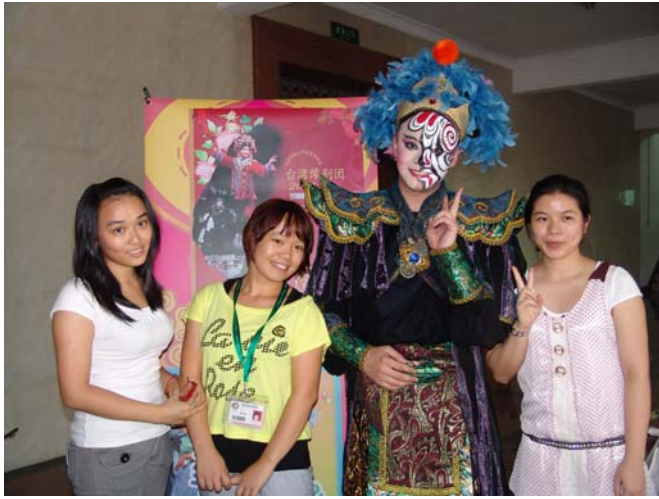
《錢要搬家啦?!》演員演出後與觀眾合影