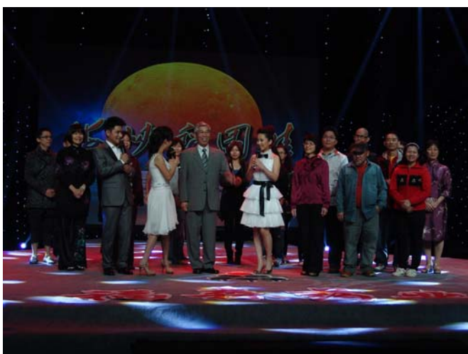
梨園春電視節目訪問臺灣豫劇團