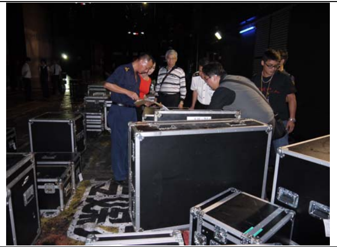
貨櫃運送道具器材正進行驗關手續