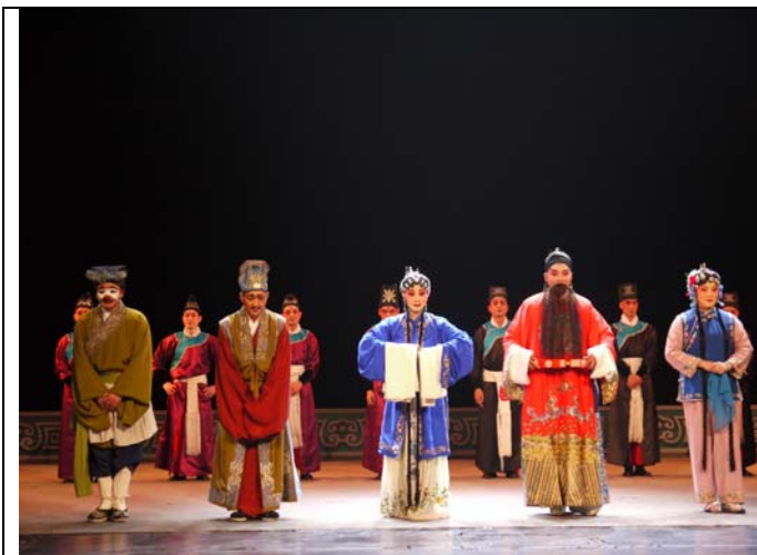
川劇《馬前潑水》演出後謝幕