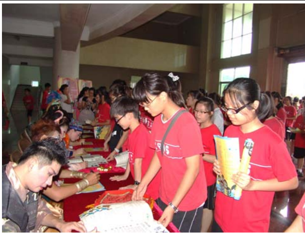
《錢要搬家啦?!》簽名會熱鬧非凡