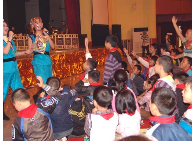
《錢要搬家啦?!》與小朋友互動十分有趣