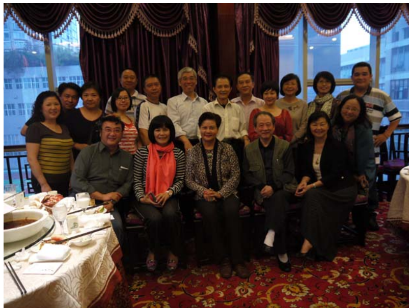
2011 大陸巡演最終行程是與重慶川劇院交流座談並觀摩演出