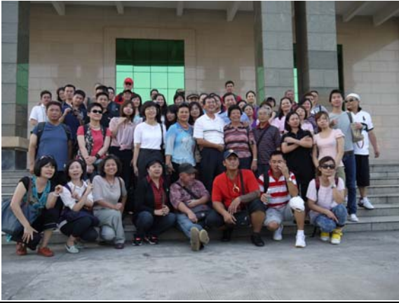
參觀台商百一電子公司與許董事長一家人合影