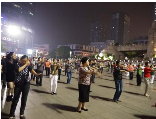
「大壩舞」是由民眾自發相約同樂的健身活動