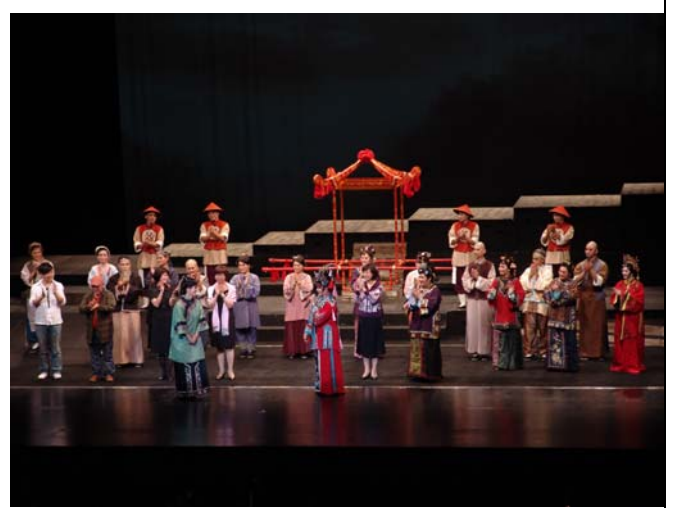
《美人尖》演出後謝幕