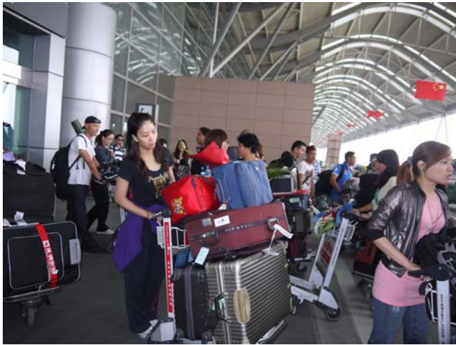
10月1日自深圳飛抵鄭州新鄭機場