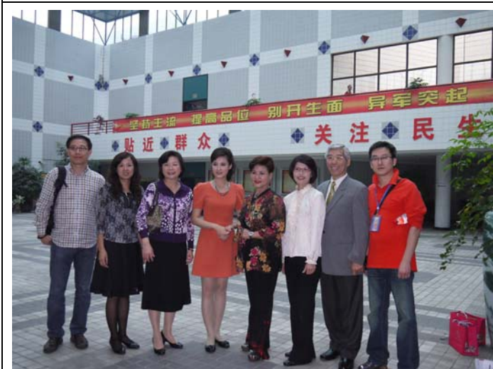
《美人尖》製作群接受採訪後於重慶電視台合影