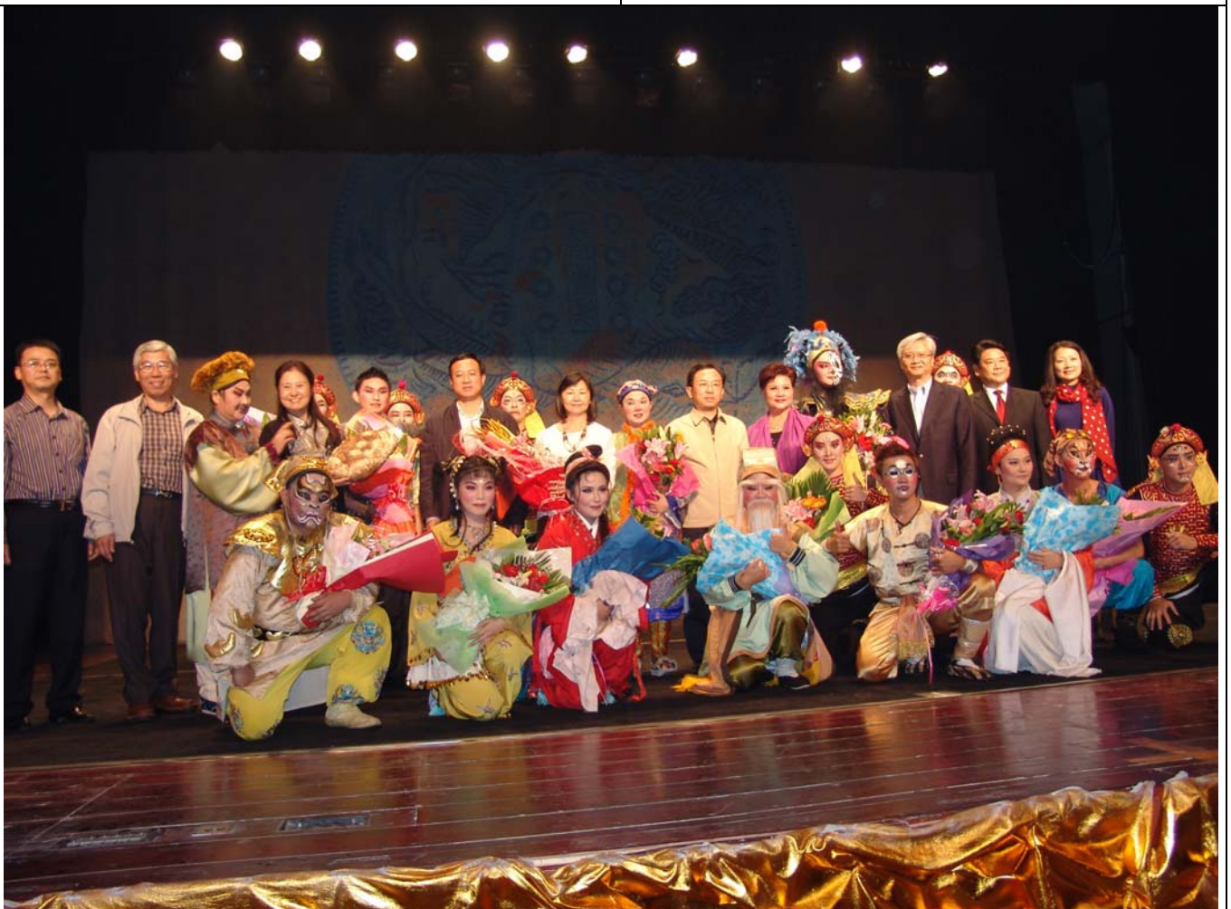
成都新津縣臺灣同胞海萬僑胞聯誼會邀請臺灣豫劇團前往興義小鎮演出獲當地居民熱情歡迎