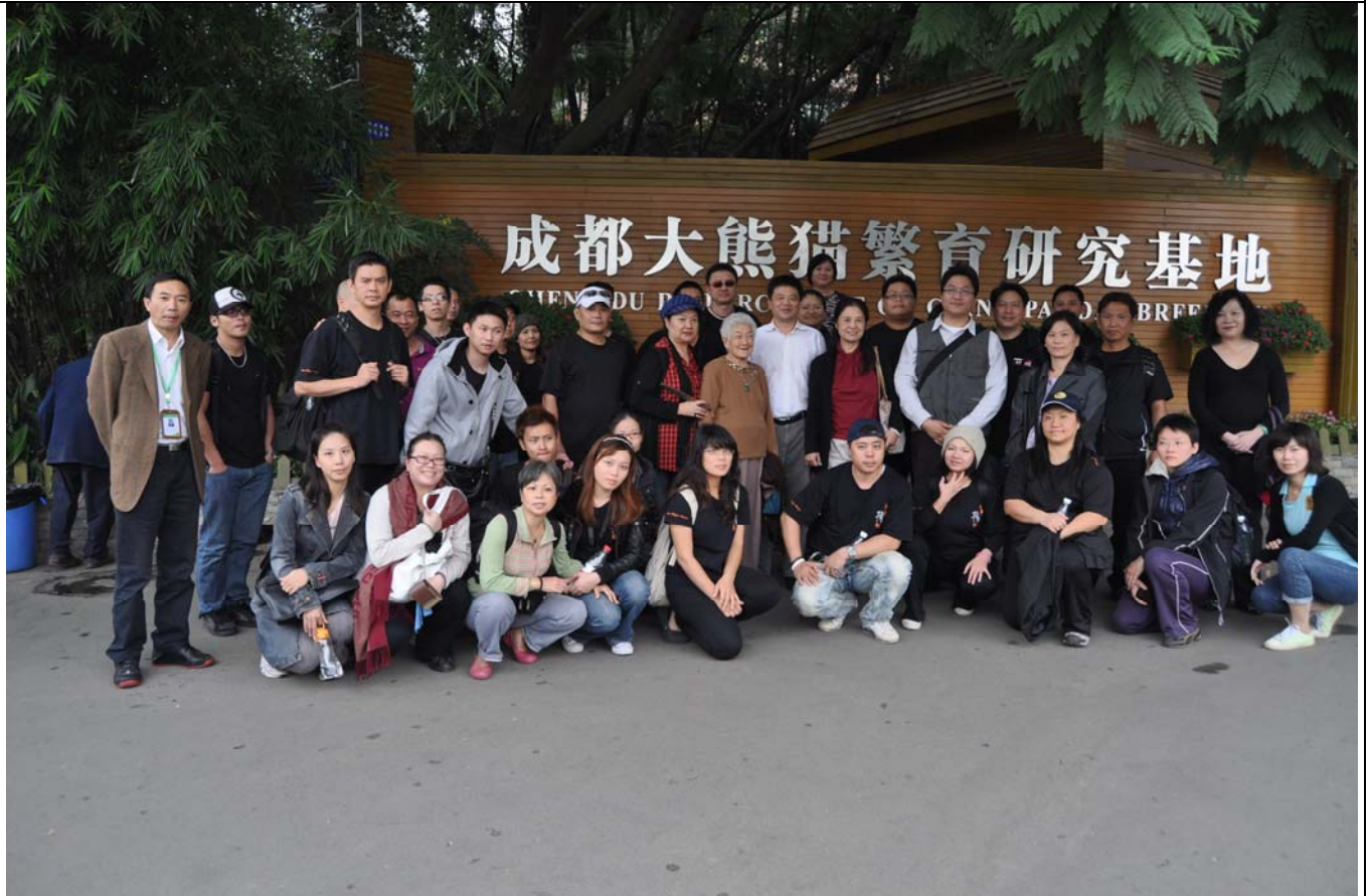
參觀成都大熊貓繁育研究基地