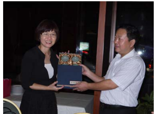
東莞首演行程就在歡送晚宴後圓滿完成任務