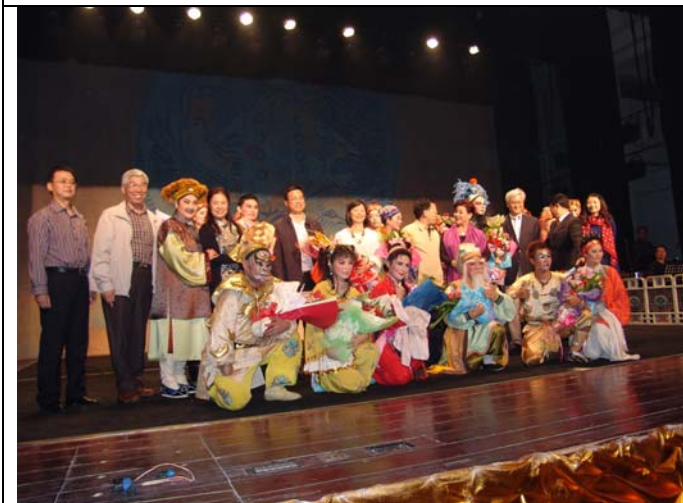
兒童豫劇《錢要搬家啦！？》演出成功