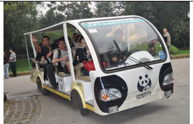
搭乘可愛的遊園車參觀熊貓繁殖基地