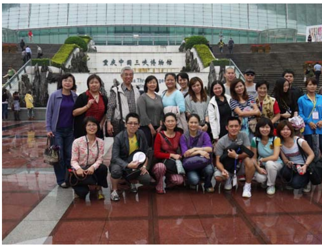
參觀重慶三峽博物館