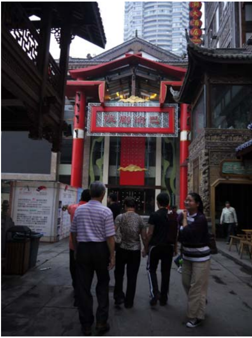
重慶吊腳樓別具特色吸引許多觀光客