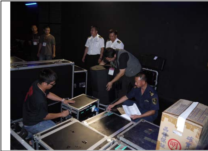
演出器材道具送抵東莞玉蘭劇院後台