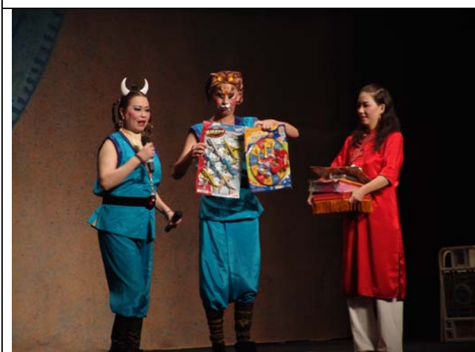
兒童豫劇《錢要搬家啦！？》演出實況