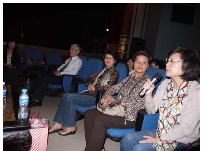
臺灣豫劇團與重慶川劇院交流座談