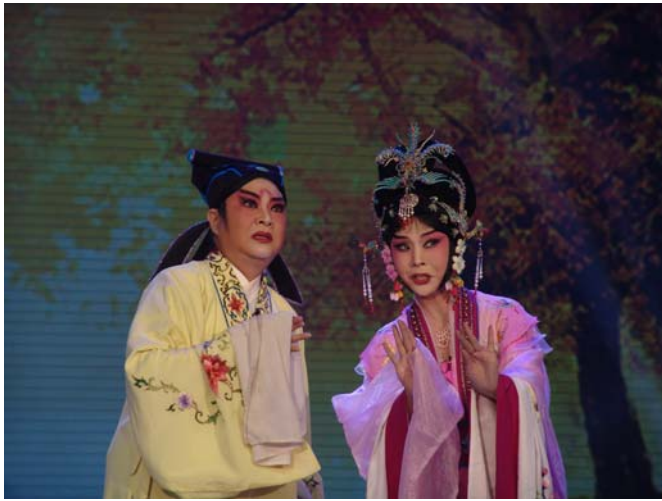
臺灣豫劇團第一小生朱海珊梨園春節目中演出