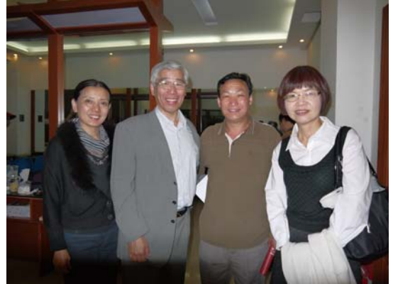
三門峽市文廣新局副局長開 4 小時車來賞戲