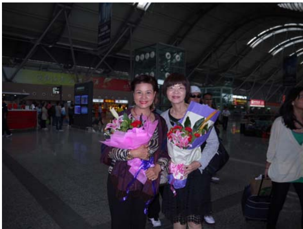
黃素貞主秘與臺灣豫劇皇后王海玲合影