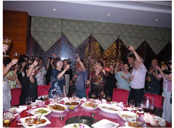
東莞歡送晚宴大家舉杯慶祝演出成功