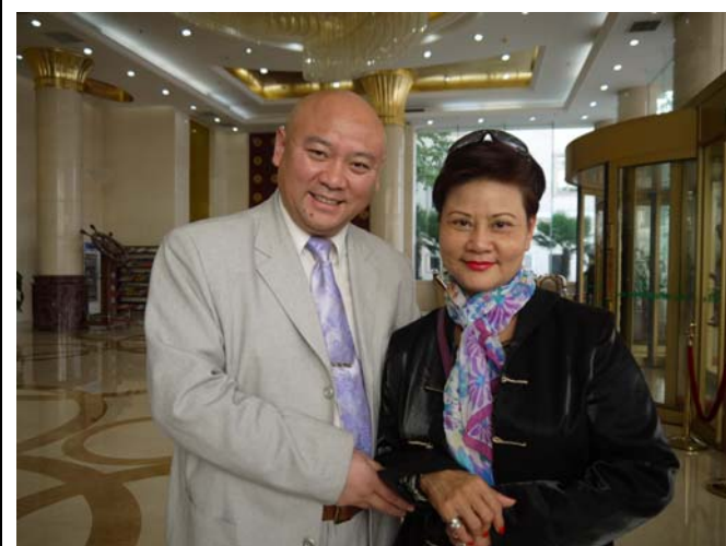
金不換團長與臺灣豫劇皇后王海玲合影