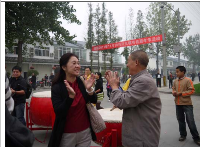
翔生公司田月皎總經理積極促進兩岸文化交流