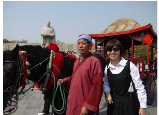
清明上河園提供花轎與結婚花車讓遊客留影