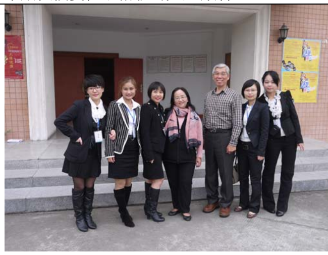
開演前與翔生公司服務團隊合影留念