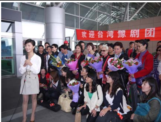
梨園春節目主持人親自到機場採訪