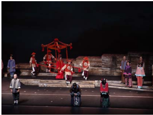
臺灣豫劇團《美人尖》演出後謝幕