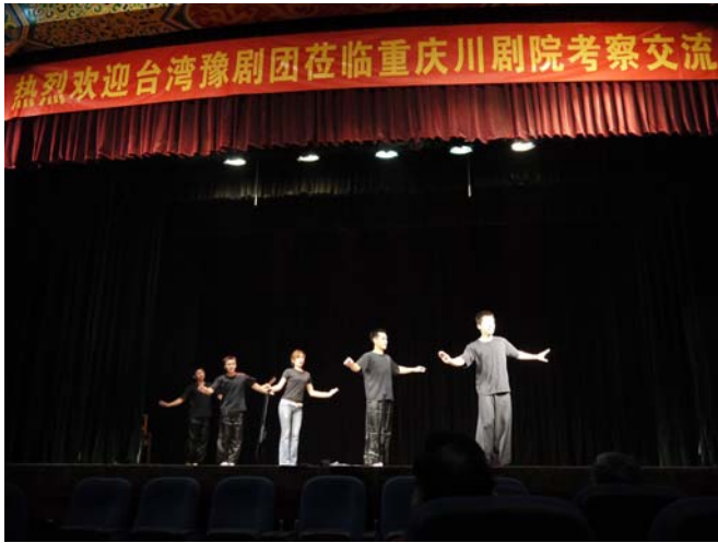
與重慶川劇院交流座談並展演抬花轎