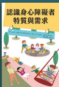
認識身心障礙者 特質與需求