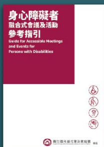
身心障礙者 融合式會議參考指引