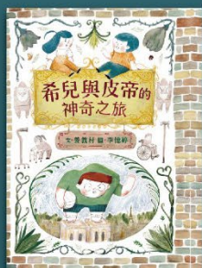
希兒與皮帝的神奇之旅 臺灣手語繪本