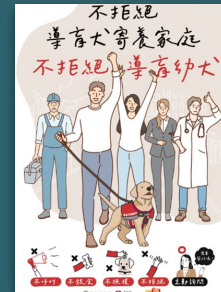
不拒絕導盲犬寄養家庭 不拒絕導盲幼犬