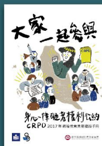
2017年CRPD 結論性意見易讀版手冊