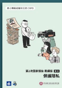
CRPD第2次國家報告 易讀版(1套共4本)