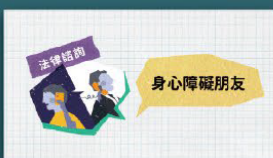
身心障礙者法律扶助專案