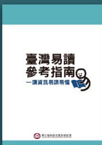
臺灣易讀參考指南 一讓資訊易讀易懂