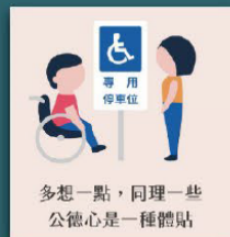
不占用身心障礙者 專用停車位