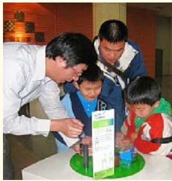
「兩極追蹤」利用電磁的原理，帶領觀眾體驗發電、電與磁的同性相斥異性相吸等遊戲

Gallery G02 Science Alive 下雨天的馬路上經常可以看見油膜造成的彩光，就像「肥皂泡」薄膜上幻變的色彩，你知道「肥皂泡」薄膜的厚度大約就是可見光的一個波長嗎？還有，虹膜是一個圍著眼睛中央黑色瞳孔的圓環。全世界沒有任何人的虹膜圖形是與你一模一樣的，但是你知道自己虹膜上的紋理是什麼樣子嗎？這些聽起來玄奧，其實卻與我們生活息息相關的科學原理，都可以在國立臺灣博物館即日起推出的「活的科學 2008」特展中找到謎底。