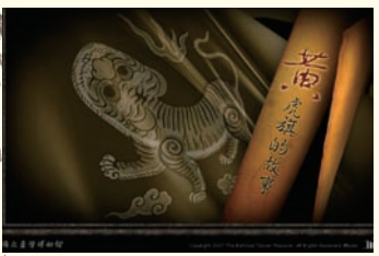
◎ 第七屆網路金手指獎教育學習類銀手拍獎