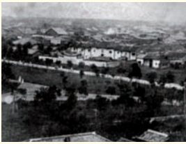
清末臺北城內的天后宮

Gallery G301/302 The Eloquent of National Taiwan Museum—A Centennial Splendor on its Architecture 今年適逢臺灣博物館建館百週年紀念，其作為社會文化層面的啟蒙地，常年持續舉辦多采多姿的展覽，肩負傳遞新知、教育民眾之重任，有著諸多悠久深遠的影響。在這意義非凡的時刻，著手為臺灣博物館建築舉辦特展，為幫助大眾瞭解這座百年博物館變遷發展之軌跡，尤其著重於建物之設計、建造、風格、特色，以及針對百年來重要之展覽進行深入而完整的介紹，呈現給國人一同分享體驗，以彰顯其價值。