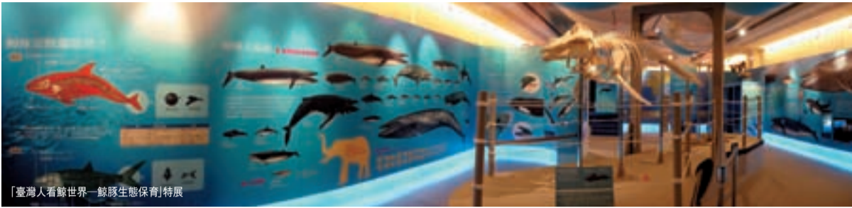
「臺灣人看鯨世界—鯨豚生態保育」特展