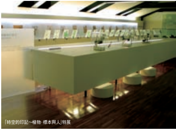
「時空的印記—植物、標本與人」特展