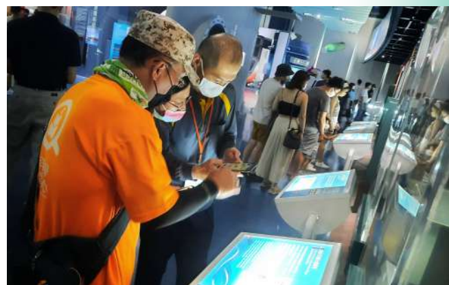
上：「珊瑚很有事」數位繪本 下：正在專心體驗ARG遊戲的學員