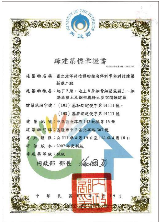
|| 海科館主題館銀級綠建築標章

依「綠建築9大評估指標系統(EEWH)」評估原則，海科館轄管場域實地之「綠化量」、「基地保水」、「水資源」、「日常節能」、「二氧化碳減量」、「污水垃圾改善」、「生物多樣性」及「室內環境」等8項均獲達標準以上，取得內政部頒發綠建築銀級標章證書。此外，海科館於建館後繼續運則採用3低(D)永續政策，包含，1D低排放：提升雨水回收再利用之機制，降低地表逕流及排水系統之負荷；2D低使用：降低廁所及澆灌系統之自來水使用量，減少水資源之消耗；3D低消耗：改善建築物熱島效應，降低建物夏季溫度，減少空調能量消耗。