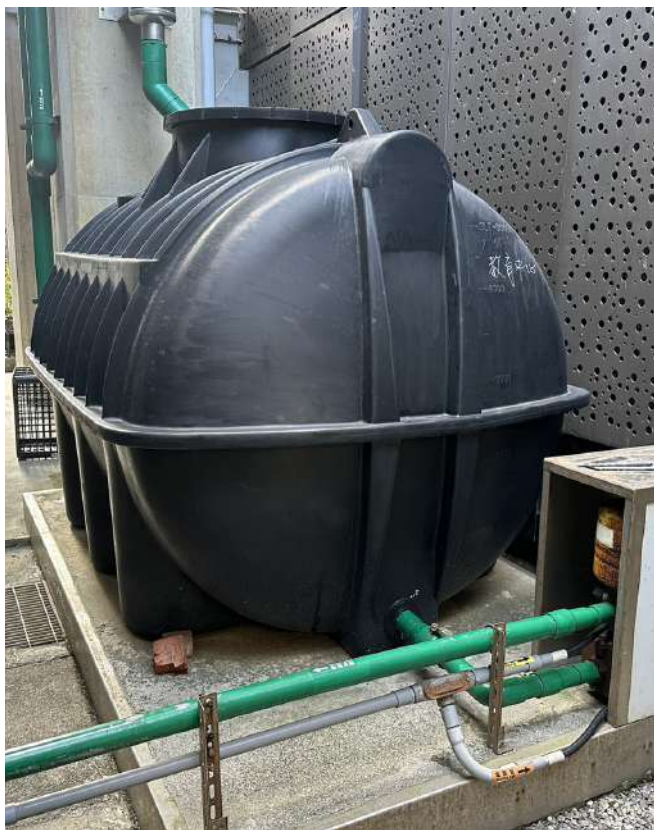
|| 海科館雨水貯流系統

海科館目前雨水貯留系統共建置4處，含括潮境海洋中心、教育中心、容軒園區、典藏館，總集水區為24,000m 2 ，計算每年降雨量3,517.5mm，總雨水貯留系統以20%計算總水量為1.68（萬噸／年），主要用於博物館之廁所馬桶沖水及花卉澆灌需求，對於館區節水已有顯著成效。