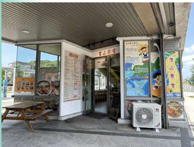
甫於2023年春節期間開幕營運之「里山食堂」已獲得環保餐廳標章

輔導委外廠商取得綠色餐廳認證的工作包含廠商須作好源頭減量、使用在地食材及推行惜食點餐等，鼓勵餐廳減少使用一次性容器，推出自備飲料杯、餐具折價等活動，提升海科館餐廳友善環境之形象。截至目前，已輔導3家廠商取得「綠色餐廳」標章。