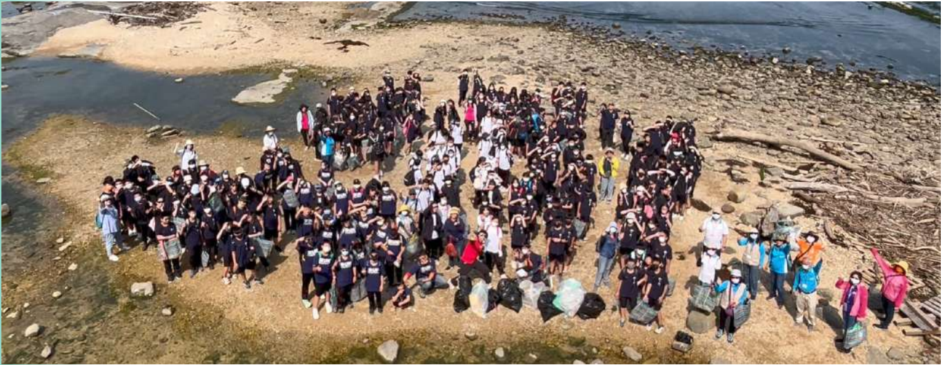
|| 海科館「ICC淨灘」課程吸引很多企業團體及學校報名