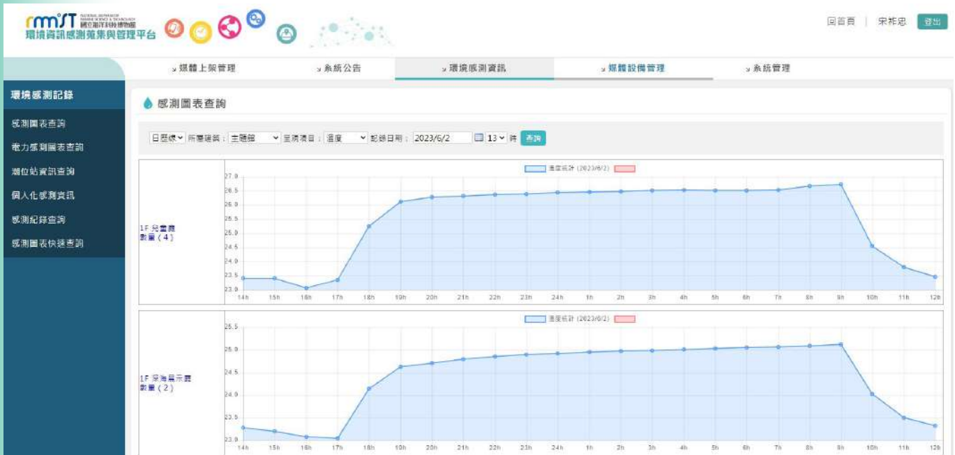
|| 主題館溫度變化歷程