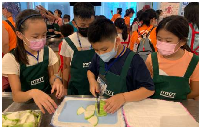
|| 生態廚房環境教育課程(海科館 提供)