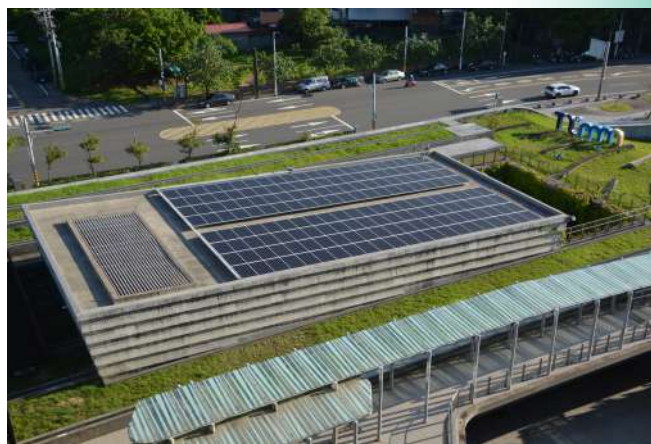
|| 海科館目前已完成之綠屋頂及太陽能發電系統

除取得綠建築標章、建置中水系統之外，海科館並同時也在植栽隔熱及光電綠能議題上有所實踐。主題館區4棟主要建築物樓頂可綠化總面積約為14,600m 2 ，依經驗，屋頂綠化後室內平均可降溫3°C，降溫1°C約可節省空調用電約6%，故共可節省空調用電約18%。另截至2022年度止，海科館已建置太陽光電系統之綠能容量／額定功率總和約為280kWp（峰瓦）。