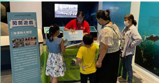
|| 不定期在主題館辦理「海漂物大解密」闖關活動