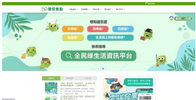
行政院環境部「全民綠生活資訊平台」官網

海科館為呼應行政院環境部所推動之淨零綠生活，配合我國2050淨零轉型／零碳排政策執行，將於2023年第4季開始與環境部合作辦理「環保集點」兌換活動，鼓勵民眾積極投入氣候行動，透過全民綠生活行動之作為減緩氣候變遷(全民綠生活資訊平台，2023)。