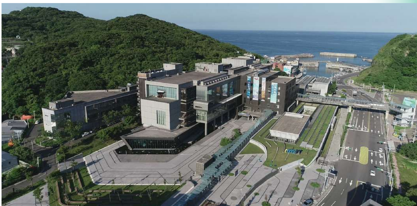
|| 海科館主題館區全景

基本上，博物館可朝擬定適用於各該場域之永續計畫以落實減少碳排，達成永續目標。也可透過辦理展覽、活動以及進行自身內部改革等措施，吸引民眾持續關注環境永續議題，並願意訴諸氣候行動(Climate Actions)，共同為永續發展而努力(王惇蕙，2022)。在降低碳排部分，英國倫敦自然史博物館(The Natural History Museum)自2012年起推出永續報告，公開該館的碳排放減量行動方案，範圍包含運用永續設計建築工法、提升設備能源使用效率、安裝太陽能板及購買綠電等(林冠吟，2022)。美國芝加哥菲爾德博物館(Field Museum of Natural History)除了在2015年獲得美國綠建築LEED的金級認證之外，並同時在運用節能燈具、太陽能、購買綠色能源等面向做出努力。此外，菲爾德博物館同時也在餐飲減碳持續努力，從廚餘堆肥、資源回收和社區菜園等三大面向，均可看見成效(劉曉樺，2023)。在透過展覽、活動及內部改革作為部分，王惇蕙(2022)曾提及當永續性已成為當代普世認同價值時，博物館於提供各式服務時，需將永續性納入必須實踐的價值。巴黎博物館協會(Paris Musées Institution)藉由重複使用展示結構材、展牆等在不同的展示中以延續材料的使用期間。國立臺灣史前文化博物館南科考古館已使用「蜂巢紙」作為展示臺，並可配合不同展間展示需求彈性調整，卸展後也可快速收納以達重複使用目的。佛教慈濟基金會香港分會於2021年在香港成立了慈濟環保願行館，除了該館建築本體採用環保材料及設計外，並致力於將永續環保概念帶入民眾生活與社區中，影響其思維及行為，進而促使民眾了解永續發展的重要性，並身體力行綠色生活(黃漢鋒，2022)。在內部工作改革部分，德國博物館協會(Deutscher Museums Bund)在2023年年會則強調應立即採取跳脫框架式的永續性實踐行動，且在有限資源限制下，重新思考博物館的內部工作，例如典藏物件、展覽規劃、空調用電管理等，以降低碳排放(黃鈺娟，2023)。