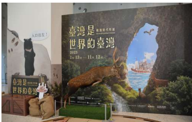
上：2023年「地球·脈動中—生態藝術特展」(陳建宏 提供) 下：2023年「臺灣是世界的臺灣—航海時代特展」(陳建宏 提供)