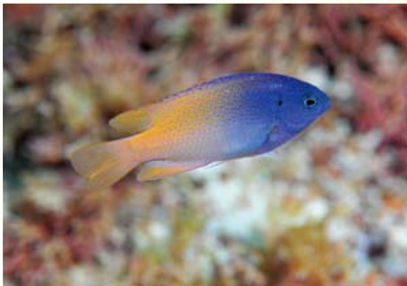
作者2011年7月終於在東沙外環礁北區發現1尾雷克斯刻齒雀鯛

東沙環礁位於臺灣、海南島之間，但在位置上較為靠近香港。魚類相經多年調查資料累計，已達73科685種，其中大多屬西太平洋黑潮體系的熱帶珊瑚礁魚類，與臺灣南部及蘭嶼綠島海域的魚種組成相似。目前只發現1種南中國海出現的特有魚種——黃頭刻齒雀鯛 Chrysiptera chrysocephala (圖1) 及20種以上廣泛分布於西太平洋或印度—西太平洋之尚未在臺灣被發現的魚類。