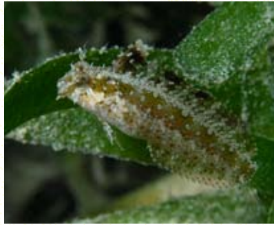
圖14 高鰭跳岩鯛成魚。