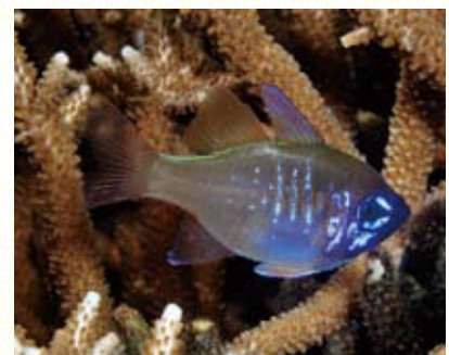
圖18 弱棘天竺鯛成群棲息於淺水域帶泥質底的枝狀珊瑚叢中，為臺灣新紀錄種。