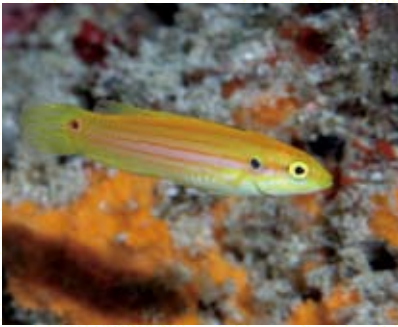
圖2 雙斑狐鯛棲息於礁斜坡下方。