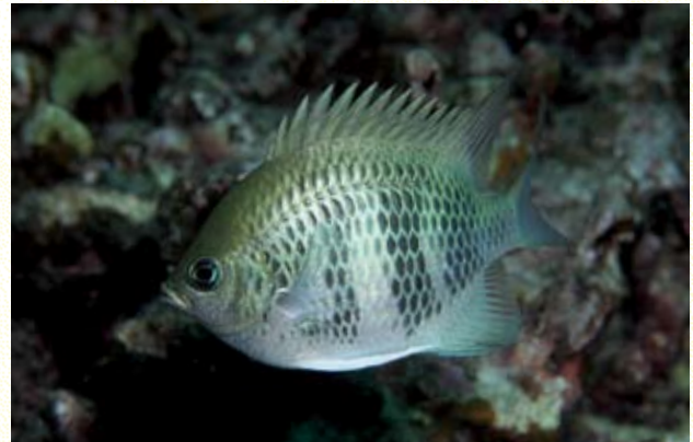
圖11 橘鈍寬刻齒雀鯛，成魚近照。

瀉湖群 ，棲息於環礁內的珊瑚礁區，淺水處的細砂地上則常有海草繁生。代表魚種有：橘鈍寬刻齒雀鯛 Amblyglyphidodon curacao (圖11) 會成群於礁體上方覓食浮游生物，為瀉湖內的最優勢種；棲息於活的波紋珊瑚或片棘孔珊瑚上的稀氏磯塘鱧 Eviota sebreei 數量明顯高於臺灣；黑腹磯塘鱧 Eviota nigriventris 則是在珊瑚骨骼碎片上活動。密鰓魚 Hemiglyphidodon plagiometopon 、黑背盤雀鯛 Dischistodus prosopotaenia (圖12) 和藍點雀鯛 Pomacentrus grammorhynchus (圖13) 是典型瀉湖內珊瑚碎片區的魚種，臺灣極少，其中的藍點雀鯛並未在臺灣出現。