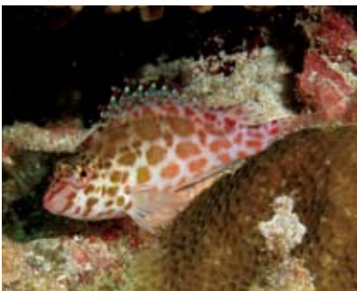
圖5 尖鰭金鯨停棲於靠近珊瑚基部的礁盤

1998年海表水溫異常升高，全球許多珊瑚礁區皆傳出大量珊瑚白化事件。此次事件也讓東沙環礁內淺水域的珊瑚礁生態受到嚴重的傷害。目前環礁內的珊瑚群聚，多由耐受環境壓迫的珊瑚組成，包括：游離型的草珊瑚、像葉片般層層疊疊的棘孔珊瑚，以及像小山丘般的微孔珊瑚。此處珊瑚礁復原的速度緩慢，主因是環礁內海水交換不佳，造成沈積物過多、水質較混濁及水溫容易升高等不利因素。