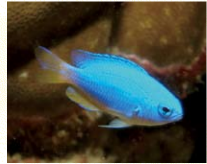
圖4 霓虹雀鯛俗稱變色雀鯛。

外環礁坪群 ，為環礁外緣水深約5-25米之平緩礁盤至斜坡陡降坡上半部。較淺處間隔數條彼此平行之沙溝，較深處大多屬平礁地形，珊瑚生長狀況普遍良好。較具代表性的魚種有兩色光鰓雀鯛 Chromis margaritifer 、金花鮨 Pseudanthias squamipinnis 、鈍頭錦魚 Thalassoma amblycephalus 及縱帶彎線鰨 Helcogramma striatum 。而定棲性的霓虹雀鯛 Pomacentrus coelestis (圖4) 會在貼近礁盤處覓食浮游生物；尖鰭金鯨 Cirrhichthys oxycephalus (圖5) 多停棲於靠近珊瑚基部的礁盤上，副鰨 Paracirrhites arcatus 和福氏副鰨 P. forsteri (圖6) 偏好停於珊瑚叢邊緣；鼓氣鱗魷 Sufflamen bursa 、黑點棘鱗魚 Sargocentron melanospilos 和常周游於礁區的星點若鰷 Carangoides fulvoguttatus (圖8) 等魚亦為此區常見的魚種。