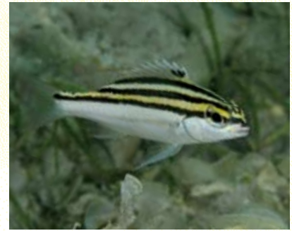
圖10 雙帶赤尾冬 Scolopsis bilineata 的小魚。(黃建華攝)

瀉湖區底質組成複雜：瀉湖北偏西側、西半部及南部的底質主要是死珊瑚、砂及礫石。瀉湖北偏東側，沿著整個東半部至南偏東側則具有相當高的活珊瑚覆蓋率，平均可達50%，主要為葉片形珊瑚形成的大型群集、大型微孔珊瑚群體與各種分枝形、葉片形及團塊形珊瑚骨骼殘骸或砂地交錯分布。砂地的部分主要由珊瑚骨骼碎片和珊瑚細砂所構成。在珊瑚骨骼碎屑構成的底質上，則有許多單體型及群體型的蕈珊瑚科種類生長。淺處的平台，表面則有生長茂盛的石珊瑚群聚，密布著粗枝礁珊瑚構成的大群體，而這也是截至目前為止全臺灣有記錄到此種珊瑚的地方。瀉湖東南側則為一大型礁塊，可見到沈船殘骸散布，礁塊表面有柳珊瑚、葉片形及其他團塊形珊瑚附生。此區珊瑚多樣性高，還有許多臺灣其他海域罕見或是未曾發現過的珊瑚種類，包括旁枝軸孔珊瑚、累積微孔珊瑚、細緻軸孔珊瑚、羽櫛軸孔珊瑚。