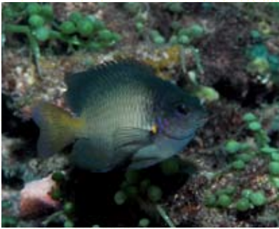
圖13 藍點雀鯛成魚，和黑背盤雀鯛習性相似，但較喜歡珊瑚碎片棲地。