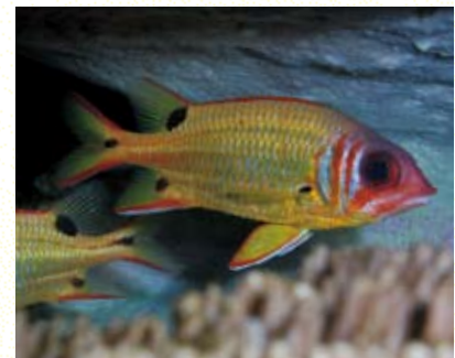
圖7 黑點棘鱗魚特寫。