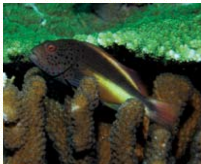
圖6 福氏副鰨停棲於珊瑚枝叢上。