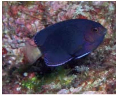
圖3 黃尾刺尻魚屬極稀有種。