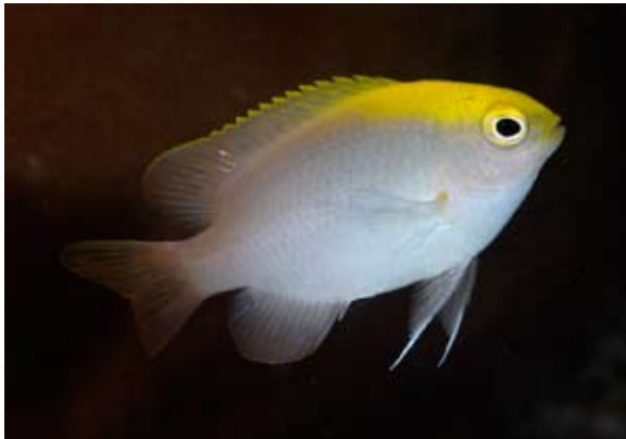
圖1 黃頭刻齒雀鯛 Chrysiptera chrysocephala 本魚種為南中國海的特有種，模式種標本採自南沙群島。在東沙為常見種，廣布於淺水域的珊瑚礁盤下方沙溝區或潟湖內礁沙交界處；日行性，往往數十尾散布在一小區域，但並不聚集成群。主要以礁上的無脊椎動物為食。有學者認為本種魚是雷克斯刻齒雀鯛 C. rex (Snyder, 1909) 的體色變異群 (Drew et al. 2010)；惟雷克斯刻齒雀鯛大都單獨棲息於礁底或礁間隱密處，二者習性明顯不同，因此應非同一魚種。