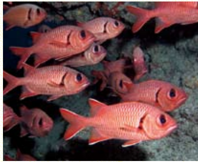
圖9 大礁洞中的凸頰松球 Myripristis berndti