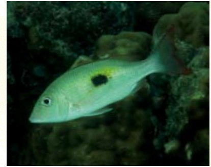
圖15 單斑龍占會成群在島邊覓食。

草床是此區的一大特點，僅東面稍有不同，近岸就有多處與潟湖中珊瑚礁區相似的地形和底質環境。機場旁就可以看到另外一個小潟湖，是由東沙島所環抱的內海，面積只有0.64平方公里，水深不及1公尺，該處海草生長十分茂密，許多魚群會隨漲潮入內。