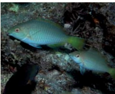
圖16 長吻鸚哥魚的亞成魚，成群在潟湖內碎珊瑚區覓食

礁臺中央的底質組成較複雜，像是潟湖和島邊綜合體，有海草、珊瑚骨骼碎屑、細沙、團塊型珊瑚和