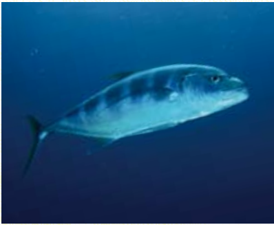
圖8 星點若鯨 Carangoides fulvoguttatus 常周游於礁區。