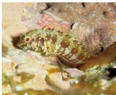
圖17 皺唇鳳鯛於印度洋較常見，臺灣新紀錄種。