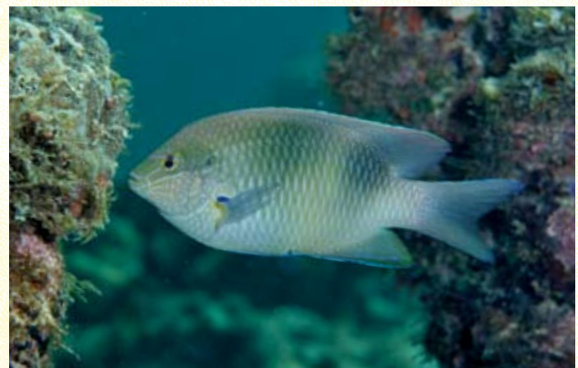
圖12 黑背盤雀鯛成魚，是典型珊瑚碎片與珊瑚砂底質區的棲息者。

東沙島邊群 ，島周圍因為日照充足、水域平緩，因而孕育了廣大的海草床，猶如一座迷你森林。海草床其間零星座落一些大型的微孔珊瑚群體，直徑可達數公尺，也有一些較小型的團塊形細菊珊瑚、角菊珊瑚、角星珊瑚以及分枝形微孔珊瑚等。海草床的景象看來雖稍顯單調，卻是許多小魚棲息成長及躲避掠食者的好地方，和珊瑚相輔相成構成生產力旺盛的生態系。東沙島南面、北面、東面和島中小瀉湖，廣大的海