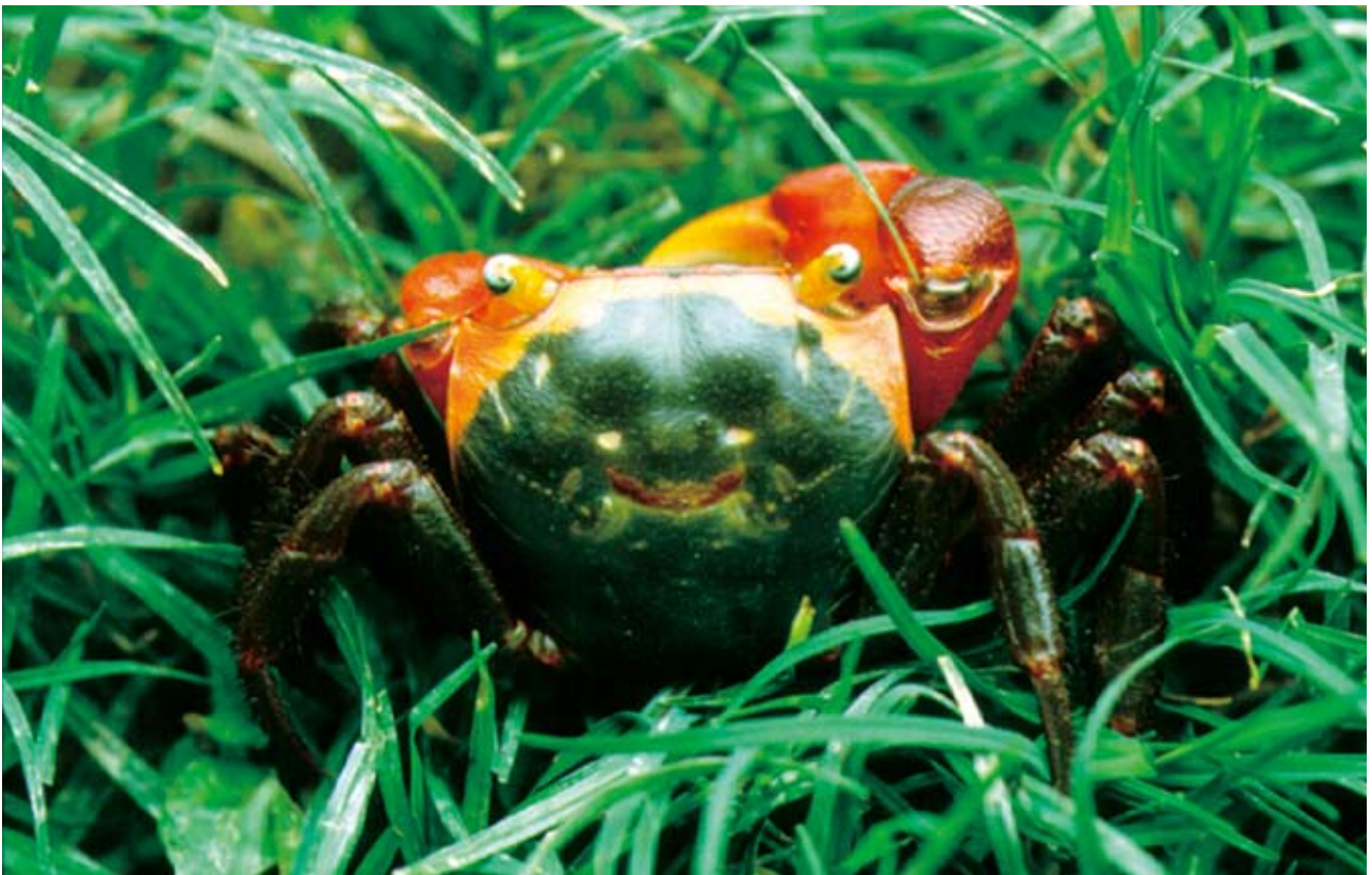
紅螯螳臂蟹 ( Chiromantes haematocheir (de Haan, 1833))。