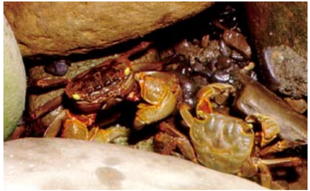
漢氏螳臂蟹 ( Chiromantes dehaani (H. Milne Edwards, 1853))。