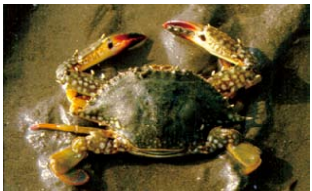
遠海梭子蟹 ( Portunus pelagicus (Linnaeus, 1766))。圖中的為雌蟹。