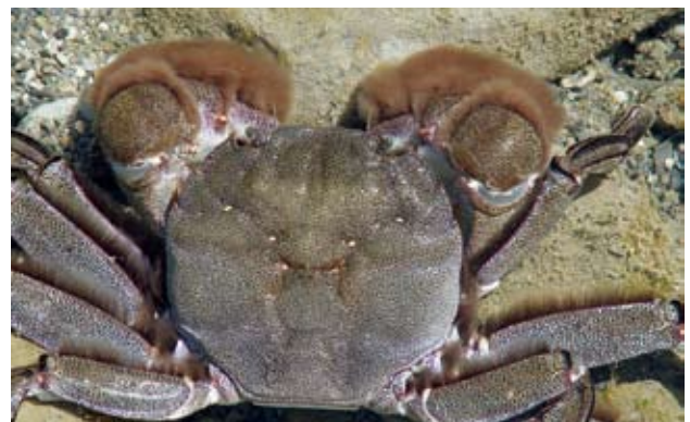
臺灣扁絨螯蟹 ( Platyriocheir formosa (Chan, Hung & Yu, 1995)) 俗稱「青毛蟹」。