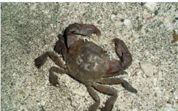
弓蟹 ( Varuna sp.)，屬於弓蟹科 (Varunidae)。