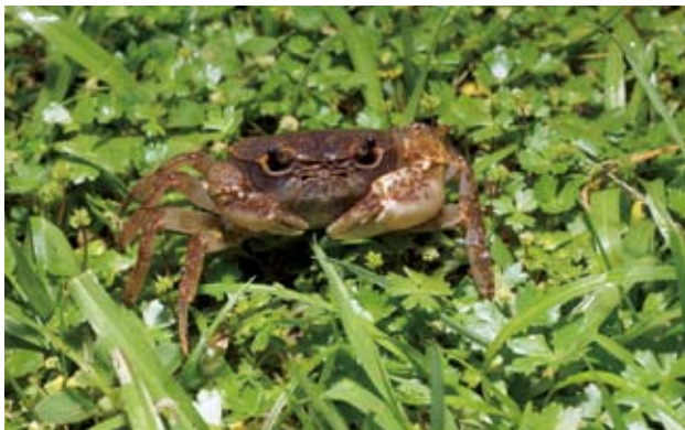
陽明山澤蟹 ( Geothelphusa yangmingshan Shy, Ng & Yu, 1994)。

註解： 「晚稻」是插秧期較晚或成熟期較晚的稻子，在臺灣就是二期稻作。大閘蟹需下海產卵、抱卵和釋放幼蟲。每年秋天，當兩性成熟，就從溪河的住家向河口遷移。在河口一帶交配後，母蟹往外海鹽度較高處移動，到達鹽度千分之三十左右的海水後，就停留在這區域。幾天後，腹部附肢就黏附了許多受精卵。大約兩個星期後，孵出蚤狀幼蟲(zoea)，在海水中營浮游生活。蚤狀幼蟲經過大約兩個月的時間，歷經五次脫殼生長後，變成大眼幼蟲(megalopa)，開始營底棲生活。接著，大眼幼蟲會向