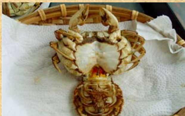
雌蟹腹部較寬圓，故稱「團臍」。圖中的大閘蟹的腹部被扳開，可見到抱卵肢。