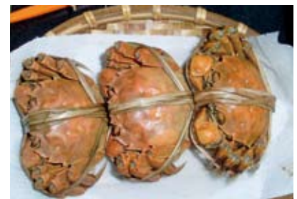
中華絨螯蟹 ( Eriocheir sinensis H. Milne-Edwards, 1853)，也就是俗稱的「大閘蟹」。圖中的大閘蟹已被蒸熟，故體色變紅。