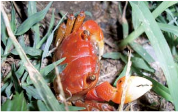
中型仿相手蟹 ( Sesarmops intermedius (de Haan, 1835))。