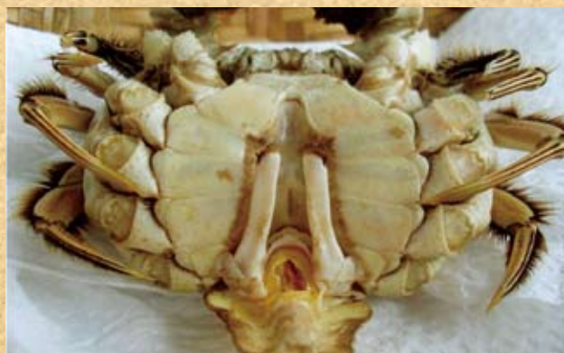
雄蟹腹部較尖窄，故稱「尖臍」。圖中的大閘蟹的腹部被扳開，可見到一對交尾肢。