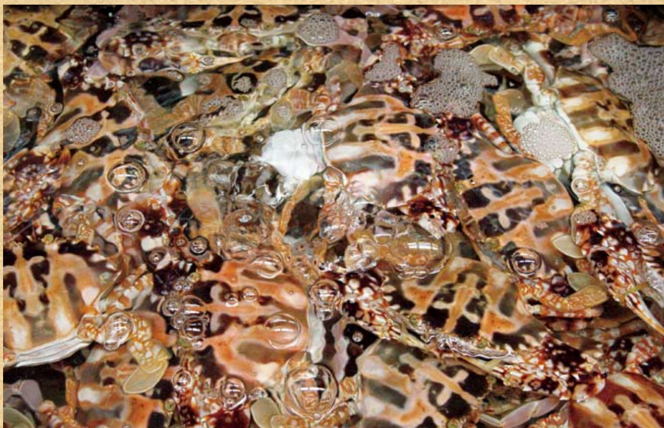
鑼斑蟹 ( Charybdis feriatus (Linnaeus, 1758))。