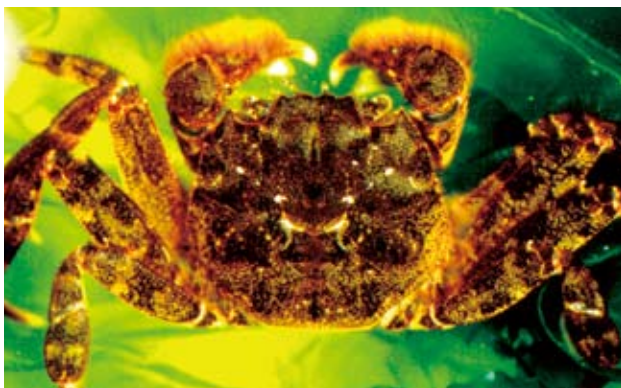
日本絨螯蟹 ( Eriocheir japonica (De Haan, 1835)) 在臺灣俗稱「毛蟹」。

臺灣東部的溪流還棲息著另外一種毛蟹，俗稱「青毛蟹」，學名是臺灣扁絨螯蟹 Platyriocheir formosa (Chan, Hung & Yu, 1995)。臺灣扁絨螯蟹是臺灣的特有種，分布北起宜蘭大溪，南至屏東港口溪。臺灣扁絨螯蟹跟大閘蟹、臺灣西部的日本絨螯蟹一樣，需下海產卵、抱卵和釋放幼蟲。特別的是，臺灣扁絨螯蟹的交配繁殖高峰是在端午節前後，也正是相思樹開花的季節。所以說，端午節粽子飄香，滿山的相思樹開滿黃花的季節，是臺灣扁絨螯蟹「似虎」的時候。■