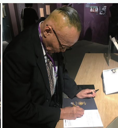
印尼前教育文化部長Prof. Wardiman Djojonegoro 於展覽現場留下感想