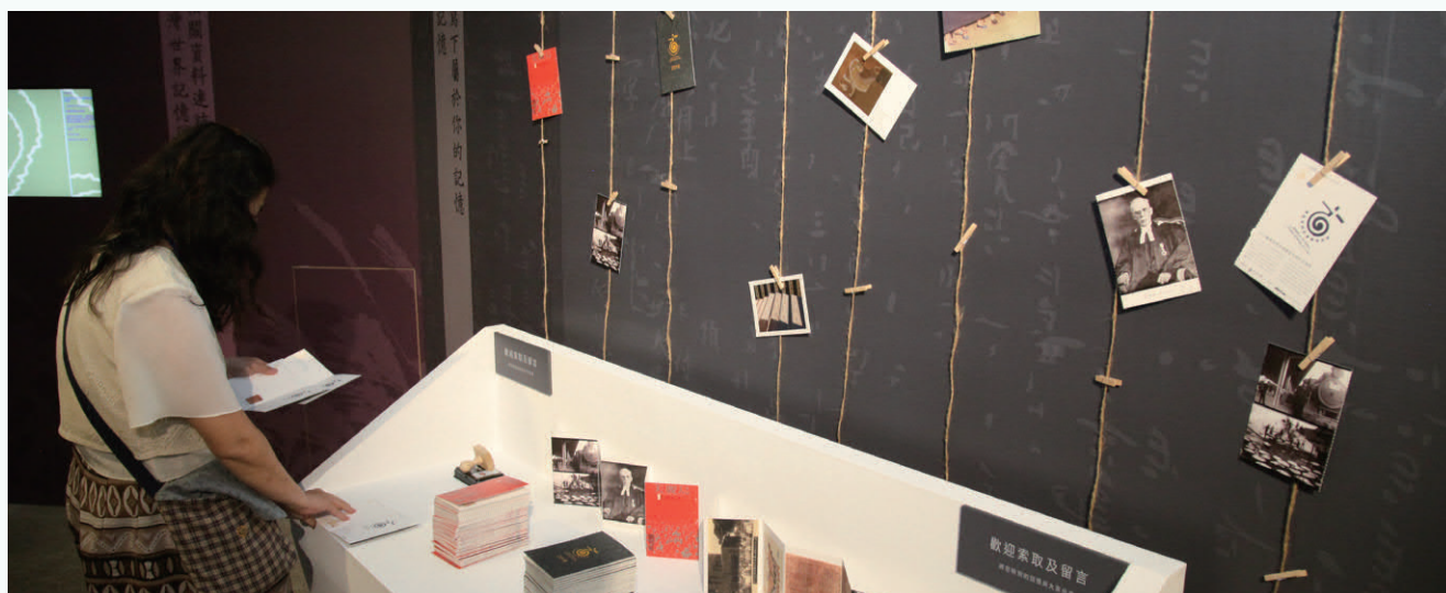
「手寫記憶：寫下屬於你的記憶」互動專區