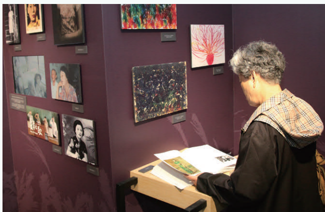
《「臺灣慰安婦」及其人權運動文獻》展區

輪流放映9項國家名錄影片，除了更完整說明登錄項目的記憶價值，也使觀眾的觀展體驗更為豐富。其中《日治後期臺灣教育宣傳影片》是以數位檔案為主要登錄載體，因此在展示規劃上採影片播放的形式，將日治末期在日本帝國統治下殖民地臺灣的面貌真實呈現在觀眾面前。