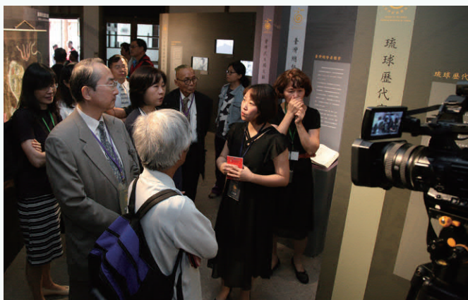
國際交流論壇貴賓參觀2018年名錄特展