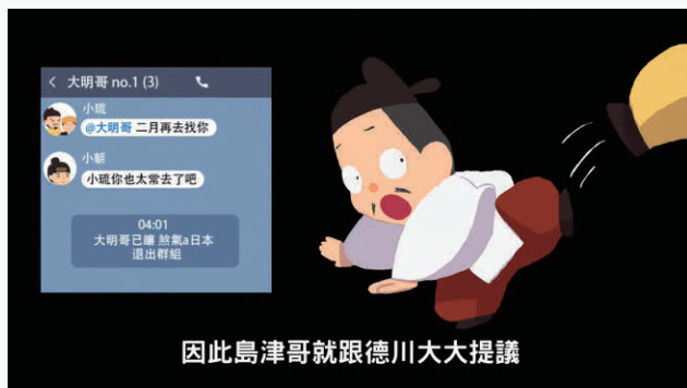
因此島津哥就跟德川大大提議

除此之外，為落實紀錄遺產開放讓大眾普遍及永久性地利用之使命，文化資產局每年提供數位化保存及再利用之補助經費，補助項目包含文獻檔案數位化、詮釋資料及典藏資料庫建置等工作項目。例如第二屆登錄之《澎湖縣鸞書》，澎湖縣政府文化局即向文資局申請補助書籍整飭維護、詮釋資料撰述及數位化建檔等經費，資料未來將存置於該局既有澎湖記憶數位資料庫與檢索系統，並建置目錄、標題等檢索資料，以提供各界查詢及全文下載使用。一般而言，經登錄之國家名錄，若保管單位為國立保管機關（構），大多數已建置資料庫可供民眾查詢利用，例如臺灣總督府檔案查詢系統、國家檔案資訊網、國立臺灣博物館典藏資源檢索系統及歷代寶案脈絡分析系統等；其他尚未完成數位化保管之單位，文化資產局也會持續輔導並協助提報補助計畫，以利未來臺灣世界記憶國家名錄達到全面開放大眾利用之目標。