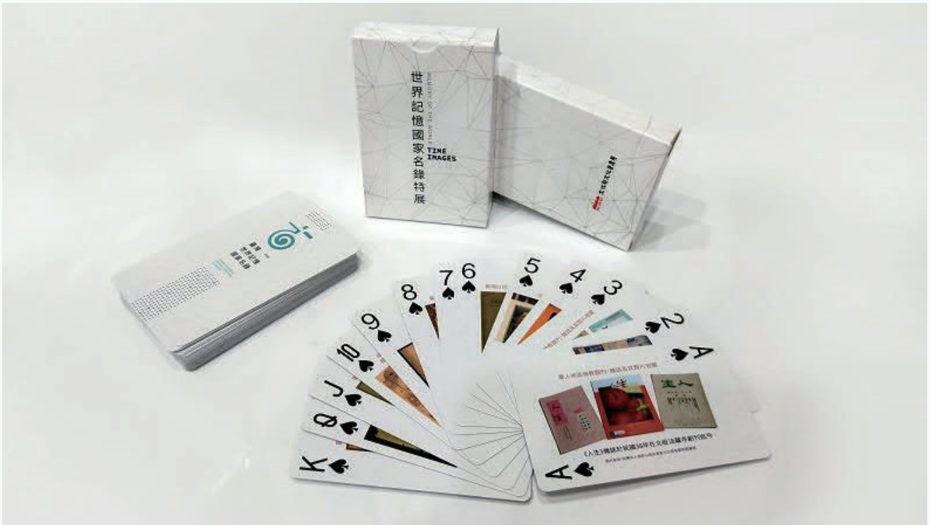
第二屆臺灣世界記憶國家名錄的教育推廣品。從保管單位授權使用的圖片，挑選具代表性的52張製成撲克牌，兼具知識、娛樂及實用的教育推廣效果

是否具有相關聯的記憶，或是過去支援友邦有關醫療、經濟、教育及文化等工作紀錄，如與拉美友邦關係長期穩定，未來也可朝向與友邦聯合提報的方式發展。