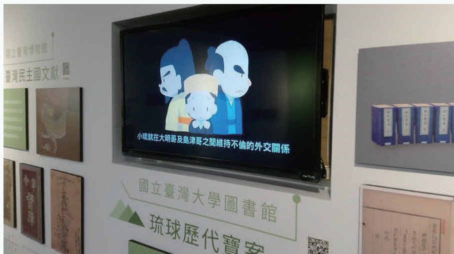
「琉球歷代寶案」宣傳動畫作品的影音展示（圖片來源：文化部文化資產局）