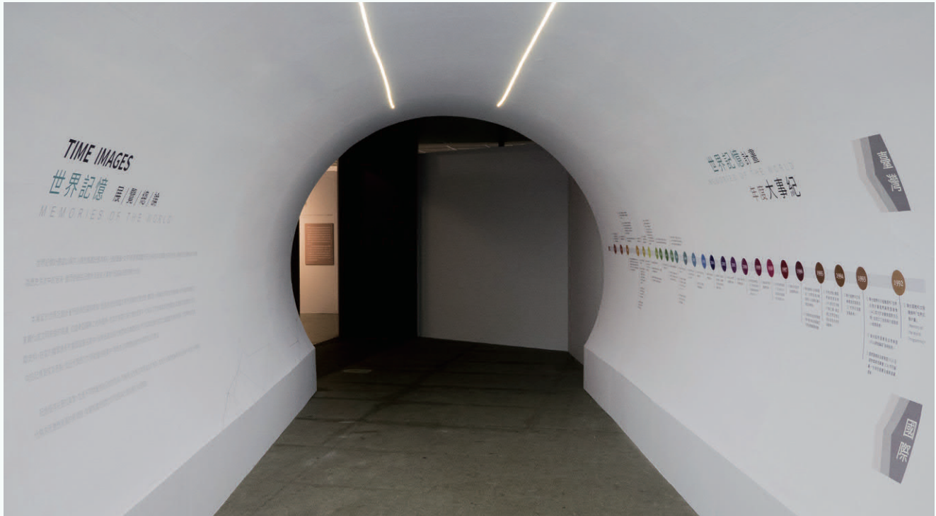
展示入口意象，以時空隧道的方式，右邊為國際及國內世界記憶計畫大事紀年表，左邊為展覽論述 (圖片來源：文化部文化資產局)

音等載體的形式，連結成豐富多樣可持續的記憶寶庫；因此藉由維護有形的紀錄載體，讓無形的記憶不致成為歷史洪流中的泡沫，進而使過往記憶所涉及的人事物，成為永恆的時代印記。2020年名錄特展分為「平行的記憶時空」、「記憶在彼時哈囉」及「此刻編織的記憶」3個篇章。順著時光隧道時間發生的序列，介紹世界記憶計畫在國內外的動態，再針對過去（第一屆）及現在（第二屆）的國家名錄，透過內容連帶闡釋不同時空與文化背景中，臺灣諸多集體記憶結構。值得注意的是，本展覽特別介紹尼加拉瓜、瓜地馬拉、貝里斯、聖露西亞、海地、巴拉圭及聖文森等我國友邦登錄的紀錄遺產，帶領觀眾一睹友邦國家豐富的紀錄遺產，並從這些拉丁美洲國家提報經驗當中，思考臺灣在已登錄項目中