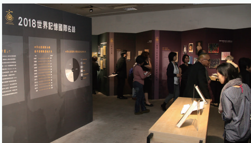
臺灣世界記憶國家名錄介紹及國際登錄數量現況展區

處，主要介紹UNESCO推動世界記憶計畫目標及國際名錄歷年登錄統計數量，建立觀眾對於世界記憶之基礎概念。2018年名錄特展由於圖像及影像資料豐富，展示方式採以靜態展示為主：例如《臺灣總督府檔案》及《二二八事件與白色恐怖檔案》皆登錄大量的公文書資料，礙於展場空間的關係，僅能呈現部分的資料，因此展場設置宣傳影片播放區，