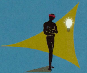
4. 遇見導師 (支援出現)